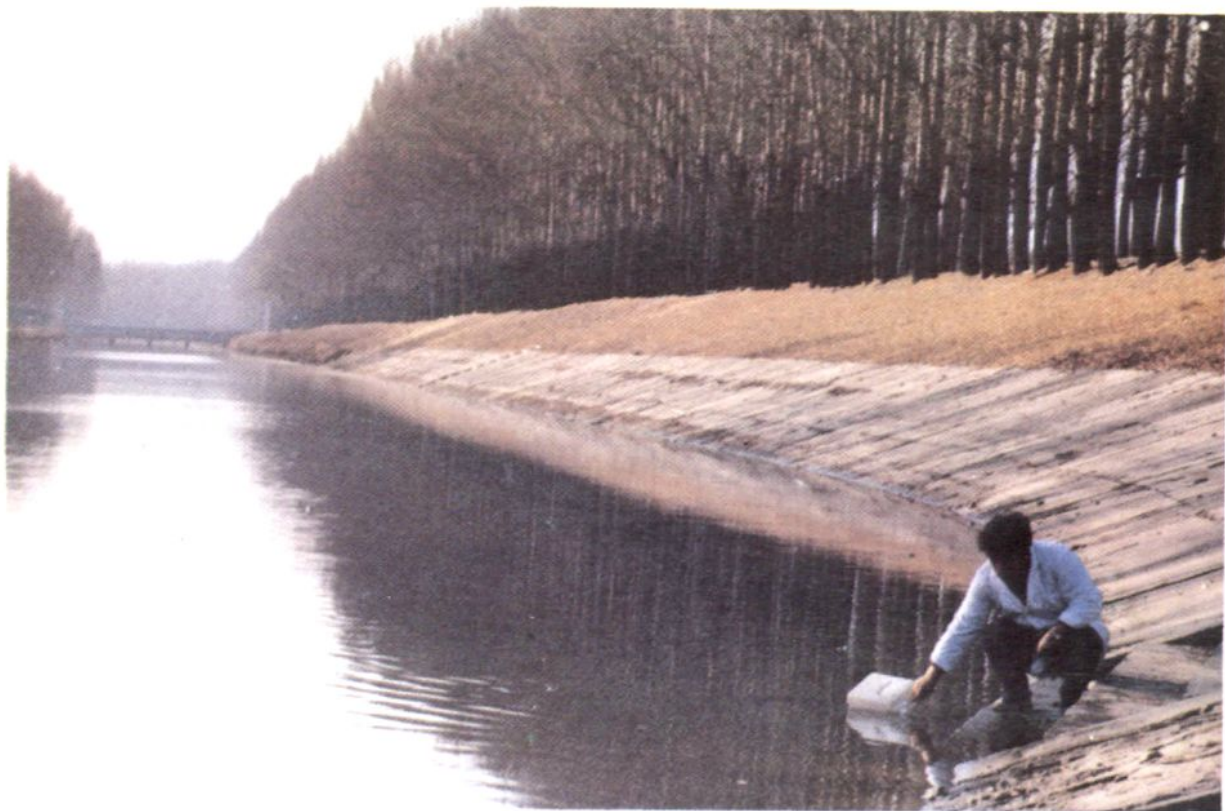
• 环境临测人员采集京密引水渠水样