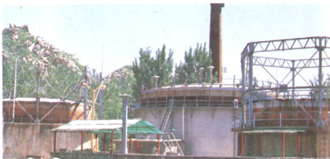
• 57603部 队生产清洁能源