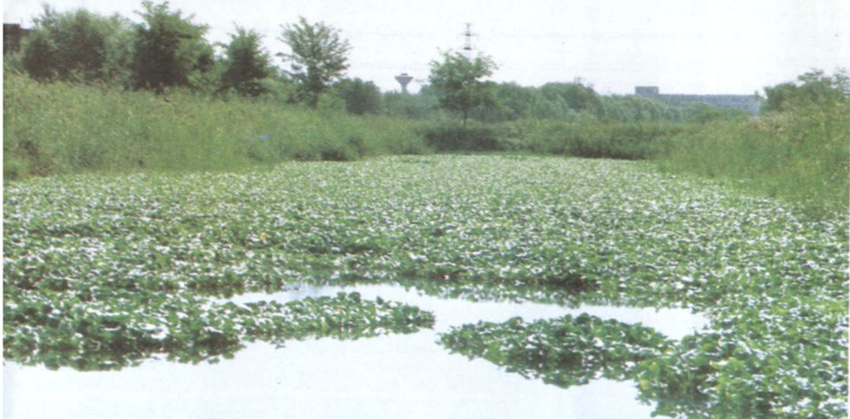
• 回龙观氧化塘中水生植物长势茂盛