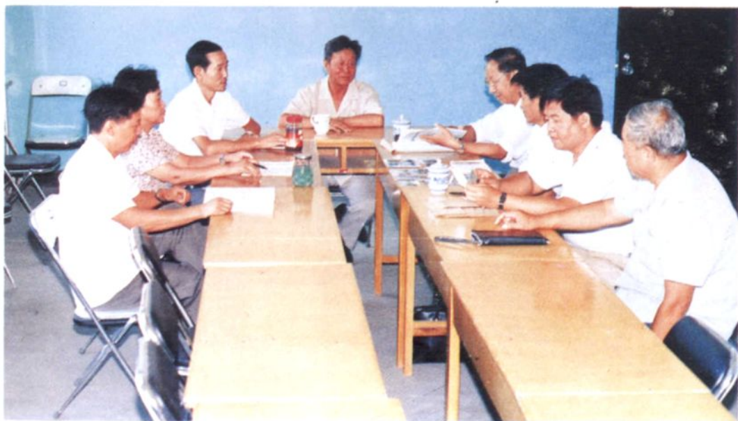
• 《昌平县环境保护志》审定会