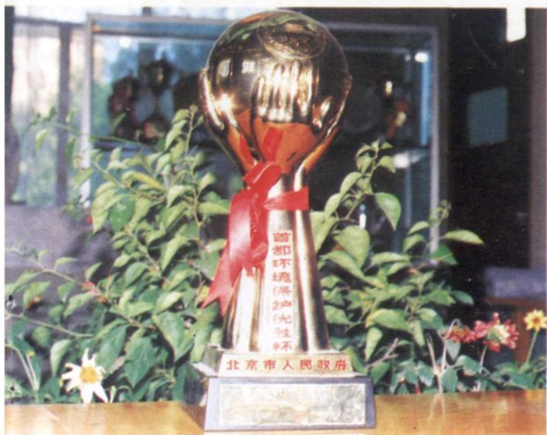
• 昌平县人民政府荣获 “首都环境保护优胜杯”。