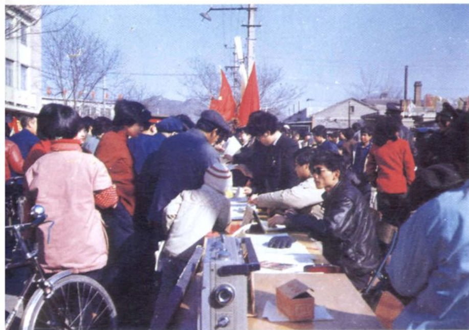
• 环境人员宣传 环境保护法规