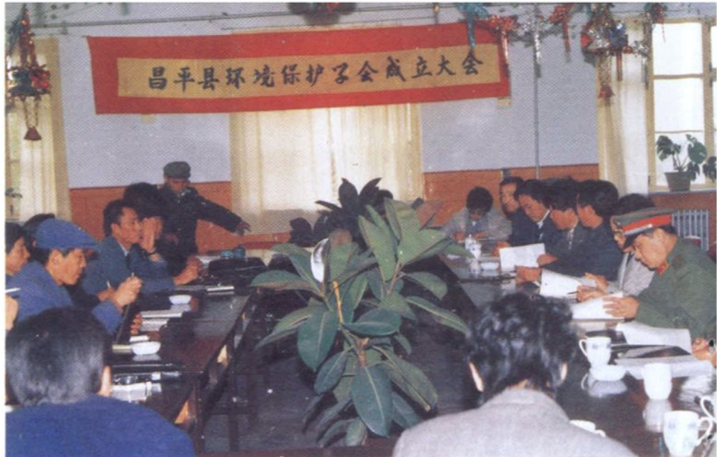
• 昌平县环境保护学会成立会议