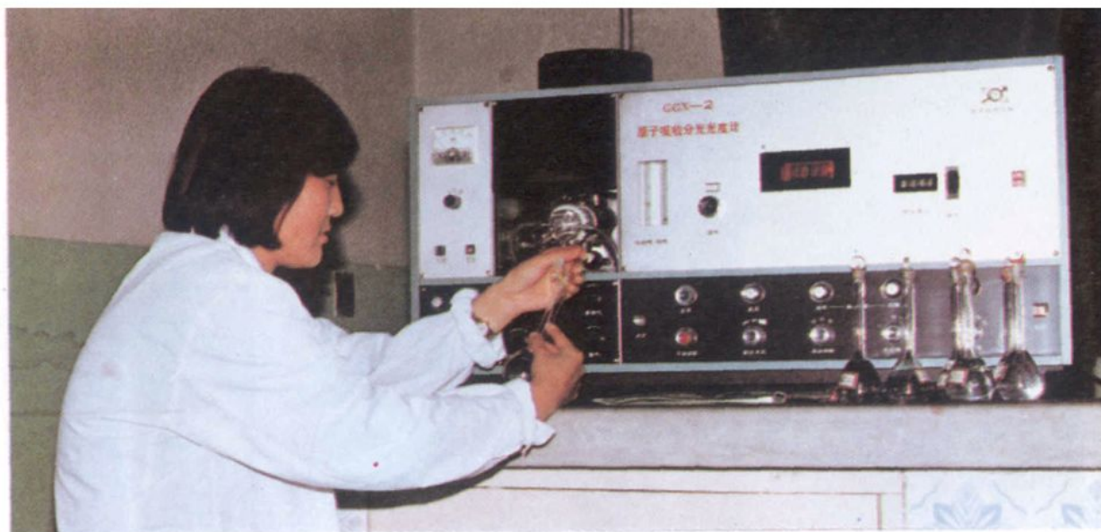
• 用原子吸收光谱测量金属元素含量