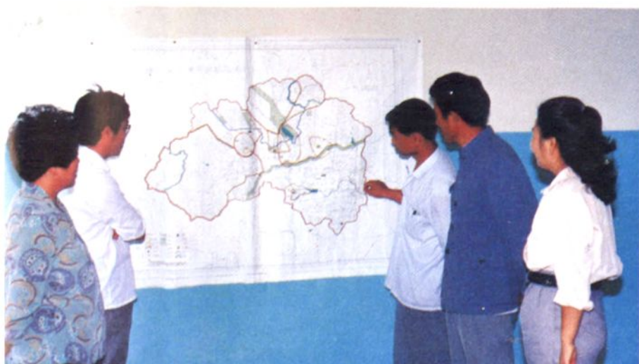
• 科技干部制定 环境规划