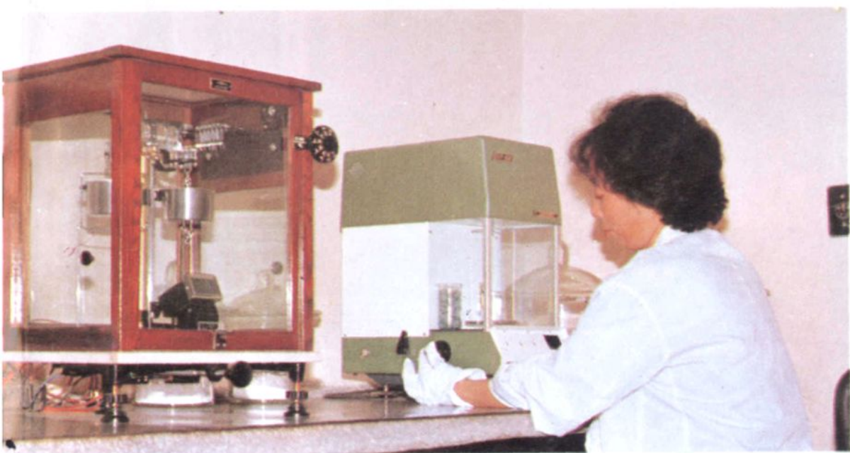
• 技术人员进行重量分析