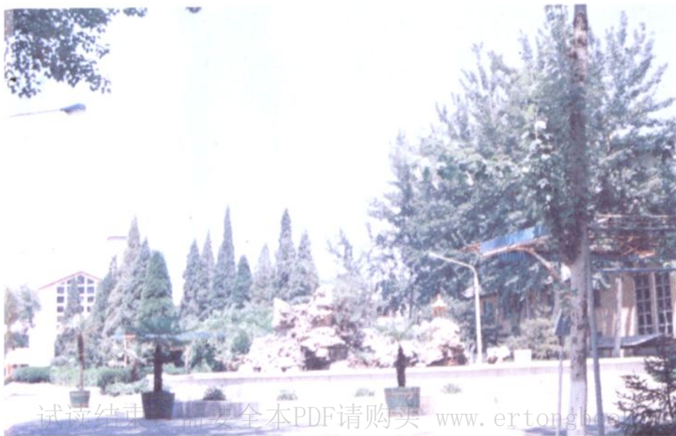
• 全国环境优美 工厂——北京保温 瓶厂