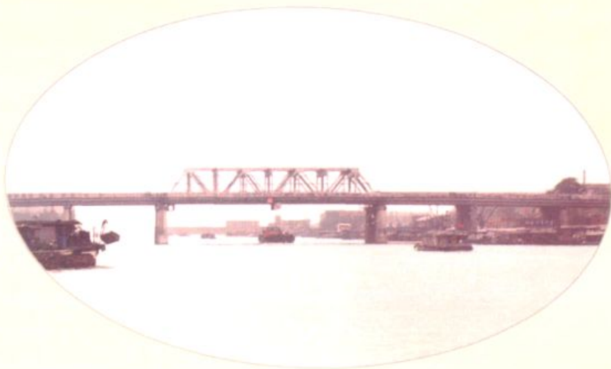
▲ 横跨京杭大运河的交通枢纽扬州大桥雄姿(沙口村东境)