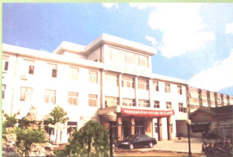
▲以专科特色享誉省内外的城东医院——沙口村村民统筹医疗所在医院