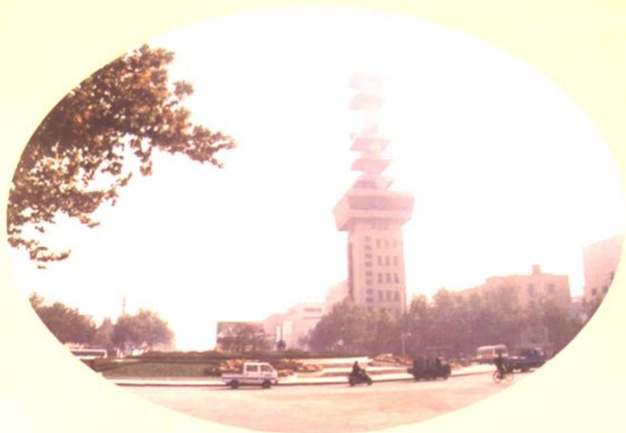
电信局微波塔（沙口村西部） ◀ 扬州东郊的标志——扬州