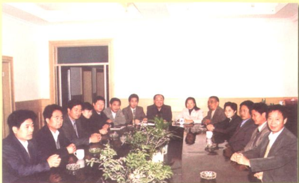
▲沙口村党总支、村委会、居委会领导开会研究工作