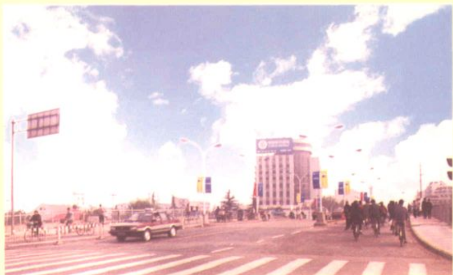
► 横跨古运河的解放桥 与东郊第一大厦——扬州 大厦（沙口村西北部）