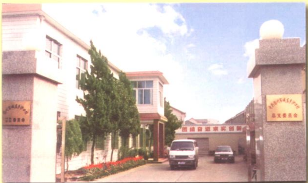
▲沙口村党总支、村委会、居委会驻地