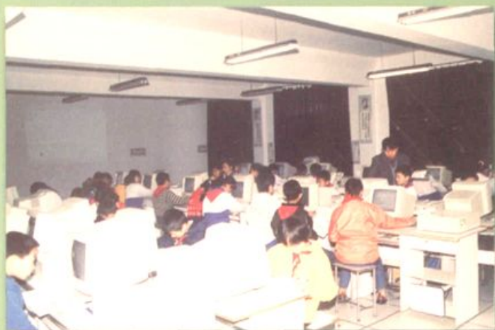
正在游戏 ◀沙口幼儿园的孩子们