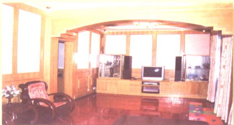
▲ 现代化的沙口村村民居住生活条件