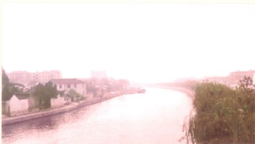
▲ 开凿于隋代、孕育扬州唐代经济与文化空前繁荣的古运河(沙口村西境)