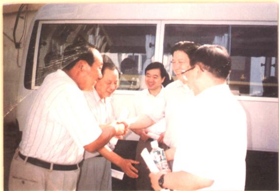
曲江小商品市场四期工程开业 启鸿在市、区领导陪同下参加 ▲ 1998年省人大副主任凌