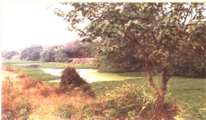
▲ 汉魏古曲江遗址(沙口村北部)