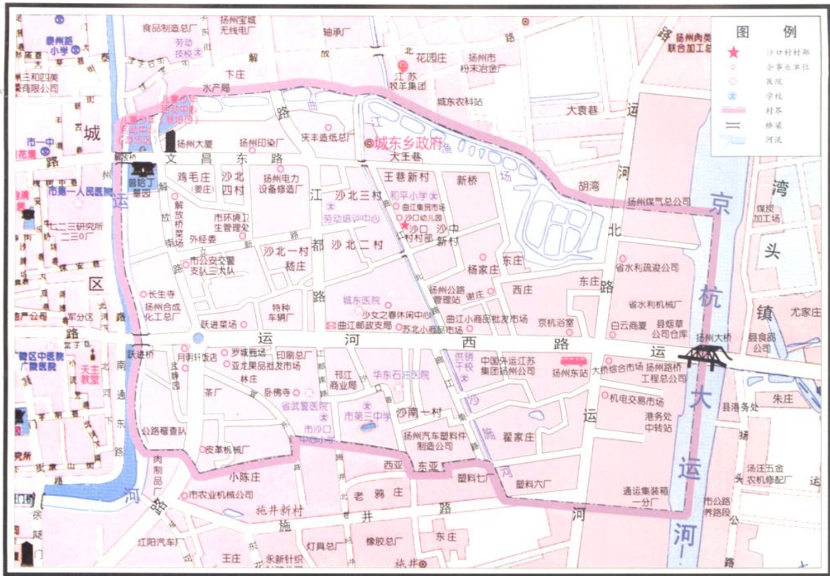
扬州市沙口村地图