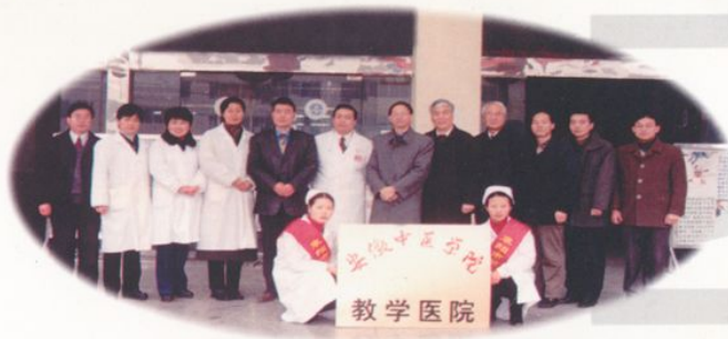
安徽中医学院教学医院挂牌仪式