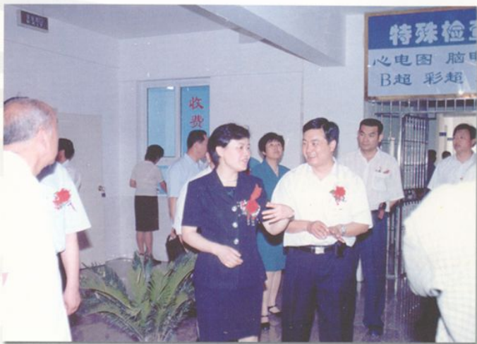
阜阳市政府杜长平副市长视察医院