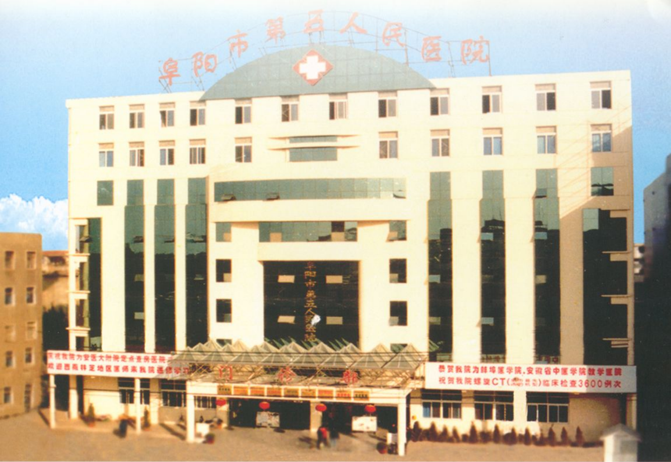
新建现代化门诊大楼