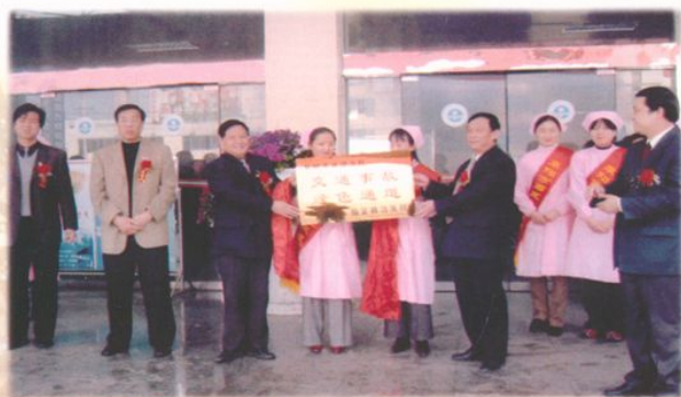
交通事故绿色通道挂牌仪式