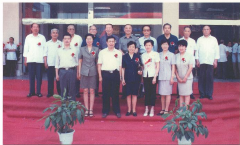
医院历任领导班子合影