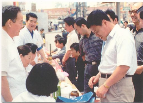
中共颍泉区委书记张治安看望我院义诊工作人员