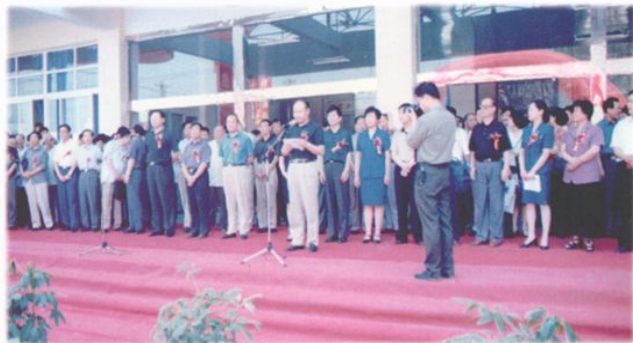
门诊大楼竣工暨螺旋 CT 启用庆典