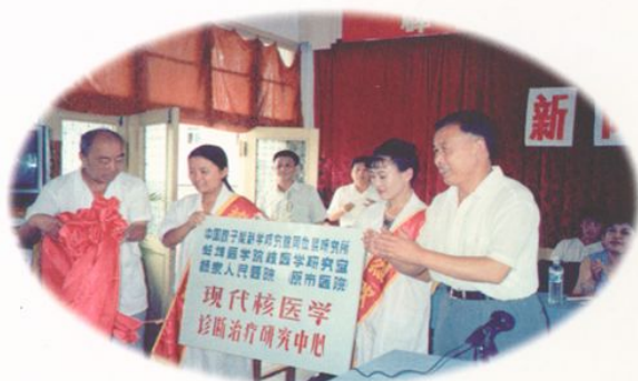
核医学科挂牌新闻发布会