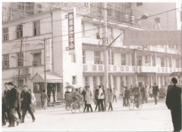
建于二十世纪六十年代的医院门诊楼