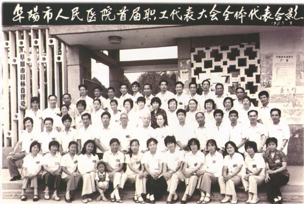
首届职工代表大会全体代表合影