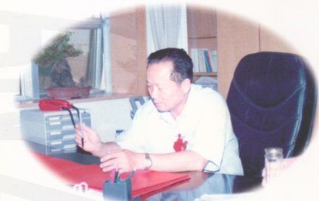
阜阳市卫生局局长洪乃敏为医院题字