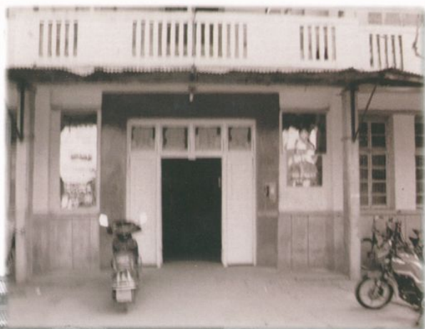
一九九九年医院门诊大楼