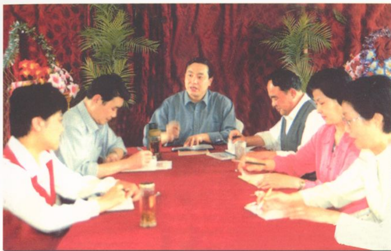
医院现任领导班子合影