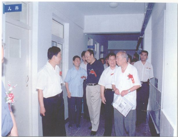
安徽省卫生厅严中亚副厅长视察医院