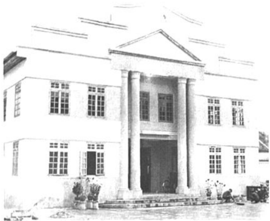
图为1950年市政府在民权路修建的人民礼堂

6月1日 4000多名儿童在桃源路民众体育场集会,庆祝南宁解放后第一个“六一”国际儿童节。