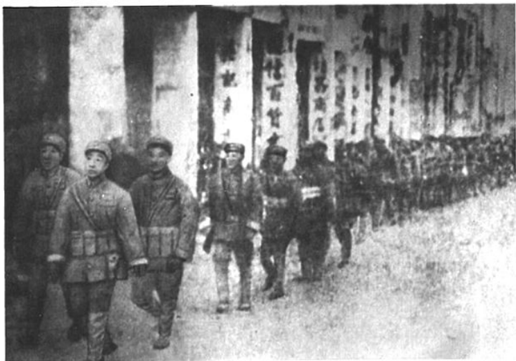
图为1949年12月5日解放军进驻南宁

12月4日 上午,国民党停在南宁机场的最后几架飞机飞走,飞离时用机关炮轰击油库,机场一片火海。等候渡江南逃的数百辆汽车从兴宁路沿中山路、桃源路一直排到凌铁渡口。沿邕宾公路南逃的散兵游勇络绎不绝地拥入城内,居民大多数关门闭户。下午,国民党三三〇师全部撤至邕江南岸后,纵火烧毁江上浮