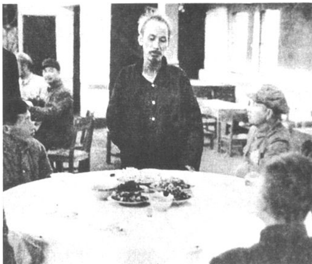
图为1950年1月中共广西省委领导在南宁金山酒店宴请胡志明主席(中)

2月1日 市军管会颁布《禁用银元及金银管理暂行办法》。规定银元与人民币的比价为1:4000,并定于2月3日正式实行。南宁各界人民同日举行“禁用银元,拥护人民币”大游行。