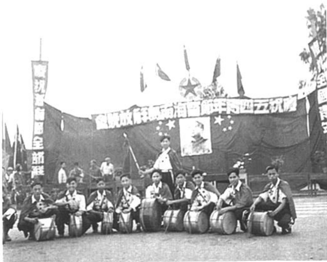
图为1950年5月5日南宁中学洋鼓队在庆祝“五四青年节”暨海南岛解放晚会会场上留影

5月18日 广西军区组建税警团,负责税收缉私工作,并对水陆交通运输武装护航押运。南宁市的缉私工作由该团团部负责。