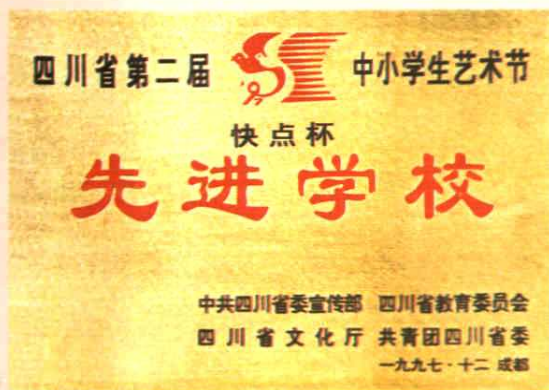
南门小学1997年获四川省第二届中小学艺术节先进学校