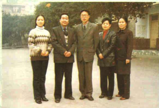
学校领导班子成员