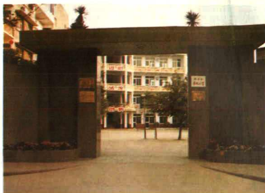
南门小学2000年装饰一新的校门