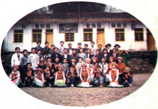
1997年南门小学与马边白家湾小学结为兄弟学校，图为南小部分教师与白家湾小学教师在白家湾小学合影