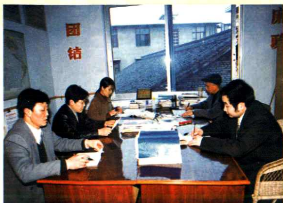
南门小学校志领导小组成员合影