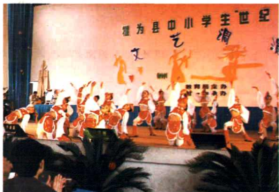
学校2000年参加县中小学生“世纪风采”文艺调演我校节目《草原小骑兵》荣获县小学一等奖