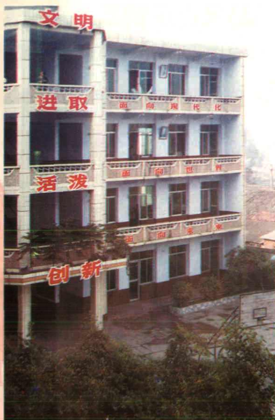
南门小学教学大楼