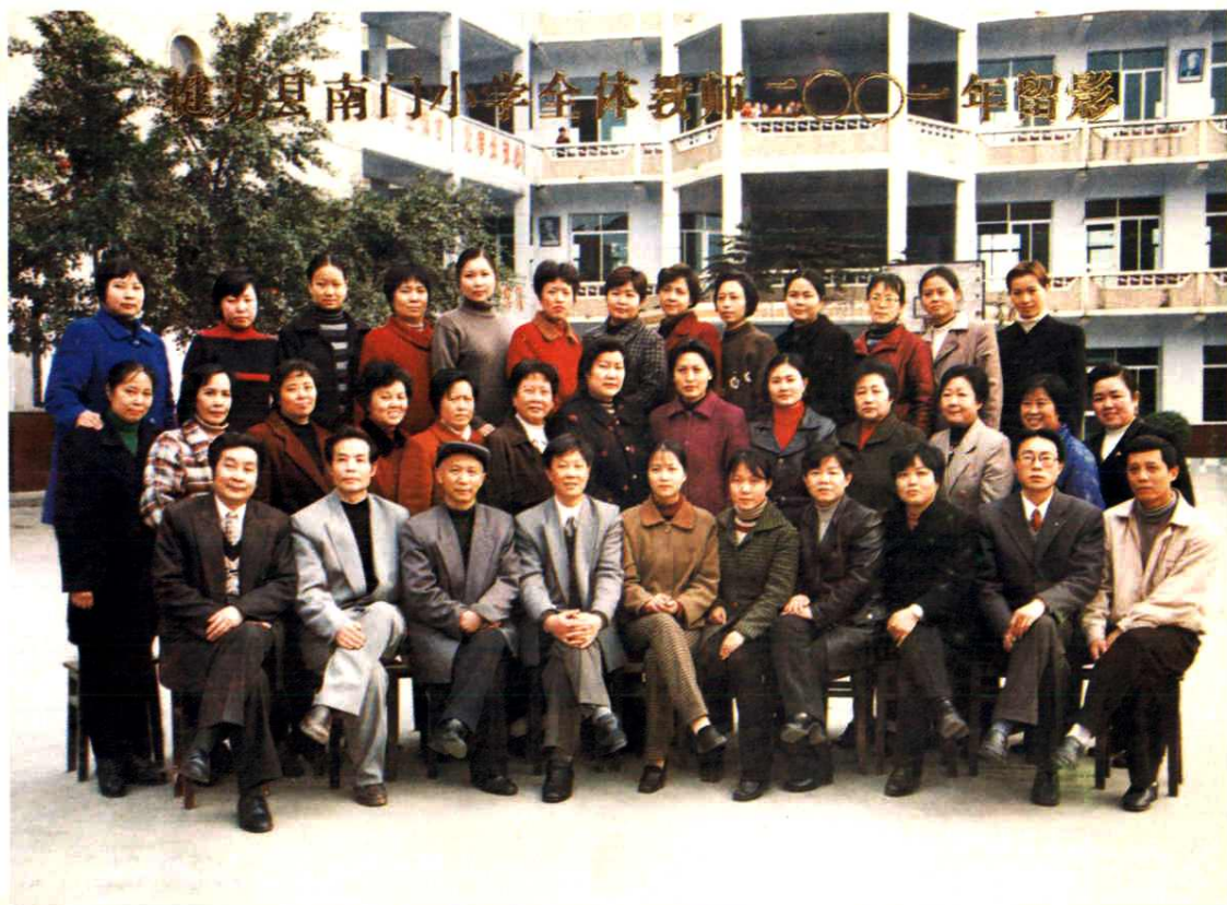
南门小学全体教职工合影