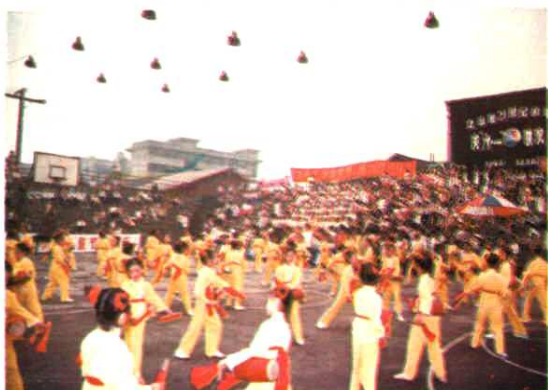
1999年学校参加县“立志做21世纪的雄鹰”庆“六·一”联欢会，图为我校腰鼓队正在表演