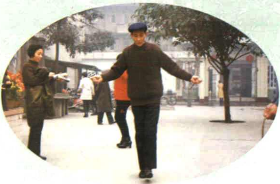
学校开展工会活动，图为教师体育比赛的情景