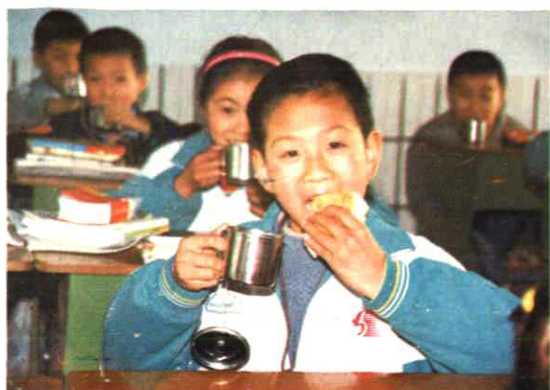
南小实施豆奶工程，学生们正在愉快地喝豆奶