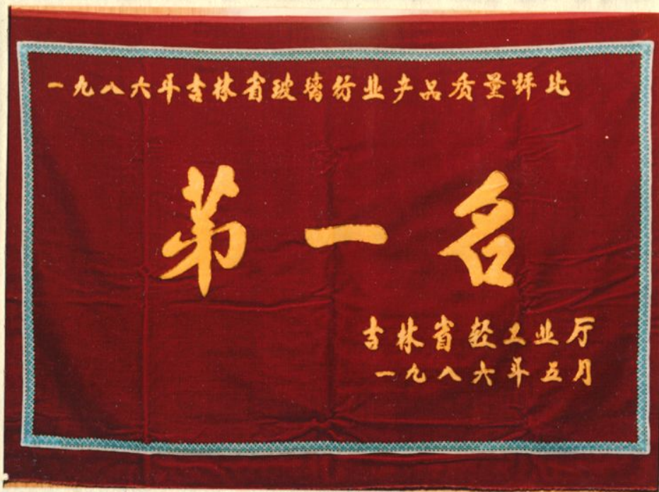
荣获省轻工业厅玻璃行业产品质量评比第一名