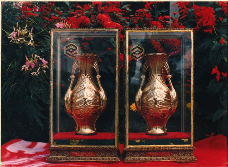
荣获1984年吉林市优秀包装产品腾飞杯奖