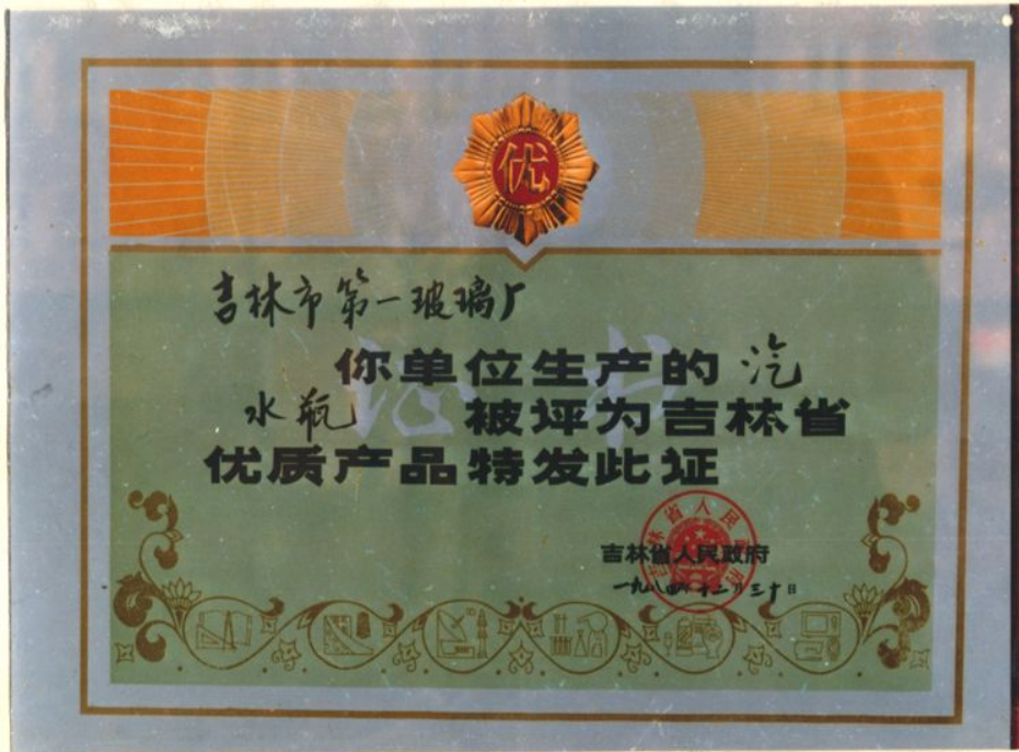
荣获吉林省政府优质产品证书