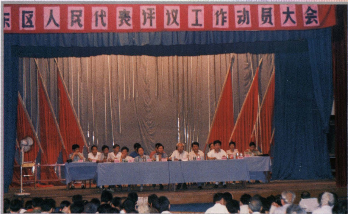
1995年8月,东市区十二届人大常委会组织人大代表对区检察院工作进行评议,图为评议动员大会会场