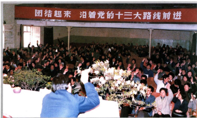
东市区十届人大四次会议上，代表表决大会决议