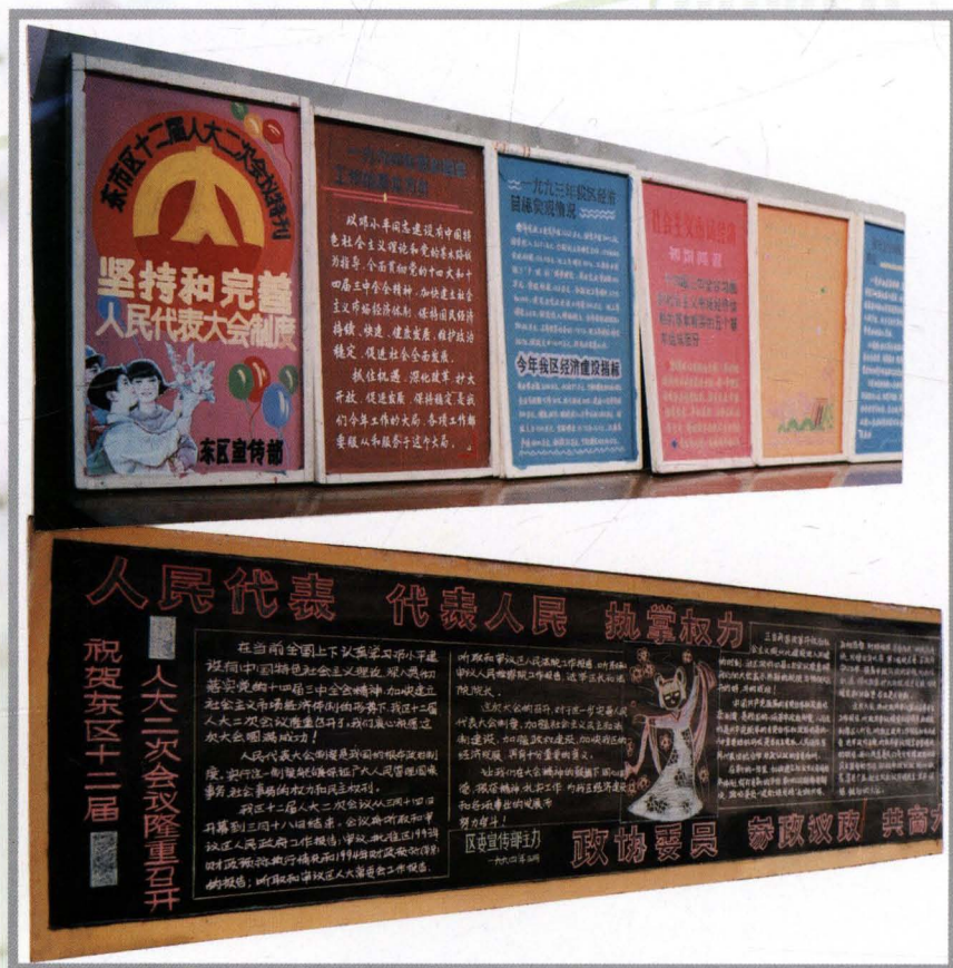
十周年,组织了板报宣传。图为板报