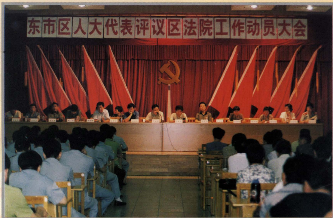
1998年8月18日，东市区第十三届人大常委会组织区人大代表对区人民法院的工作进行评议。上图为评议动员大会会场。下图为区人民法院全体干警在听动员报告