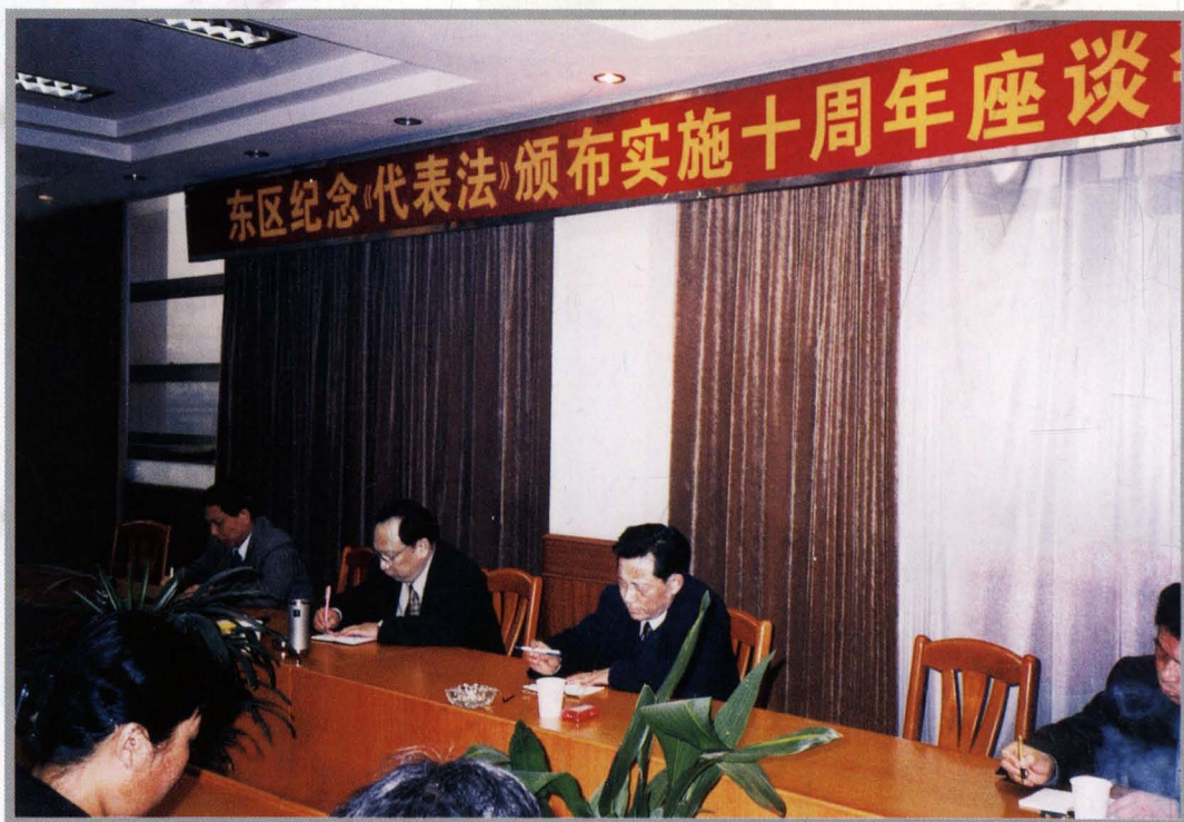
代表法颁布十周年之,东市区人大常委会举行座谈会。图为座谈会会场