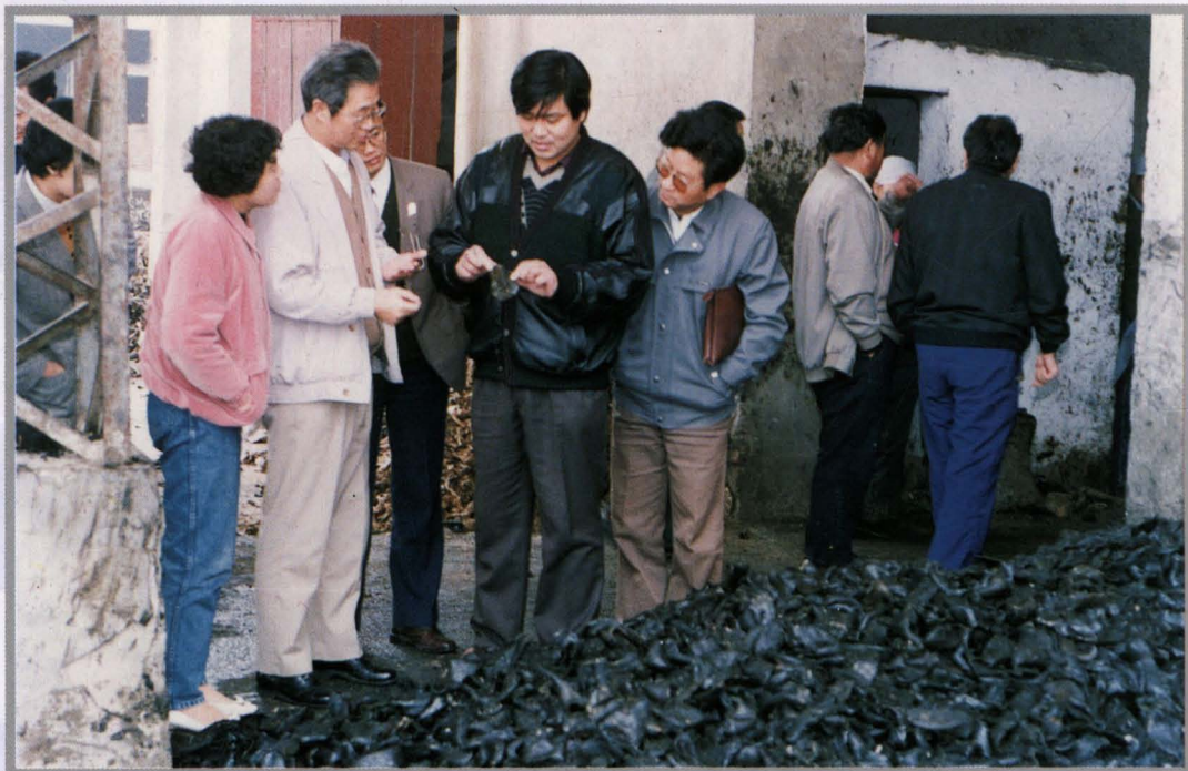
省人大财经工委孙主任在会议期间参观东市区角粒化工厂