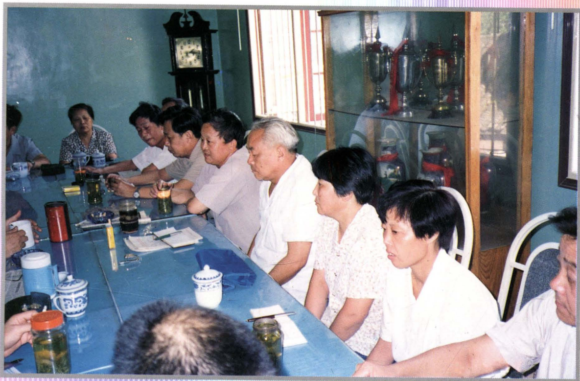
1994年8月28日,东市区人大常委会召开纪念人民代表大会成立40周年座谈会,区委、区人大、区政府领导和代表们在一起畅谈