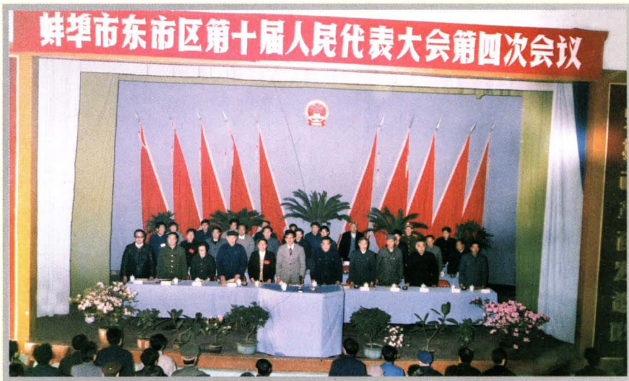
东市区十届人大四次会议于1989年3月29日在区礼堂举行，图为大会会场