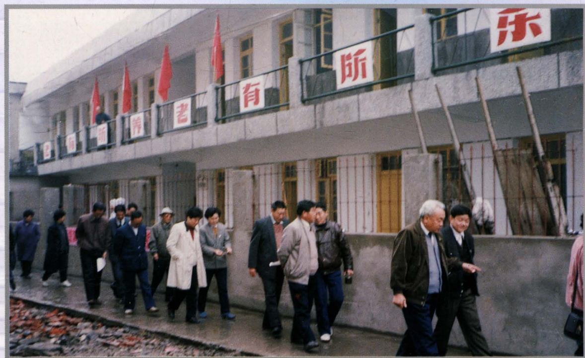
参加县区人大工作研讨会的来宾参观东市区老年公寓