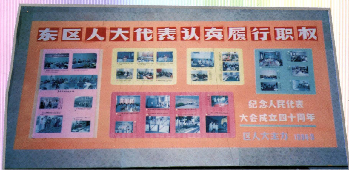
区人大常委会办公室为纪念人大40周年制作的板报