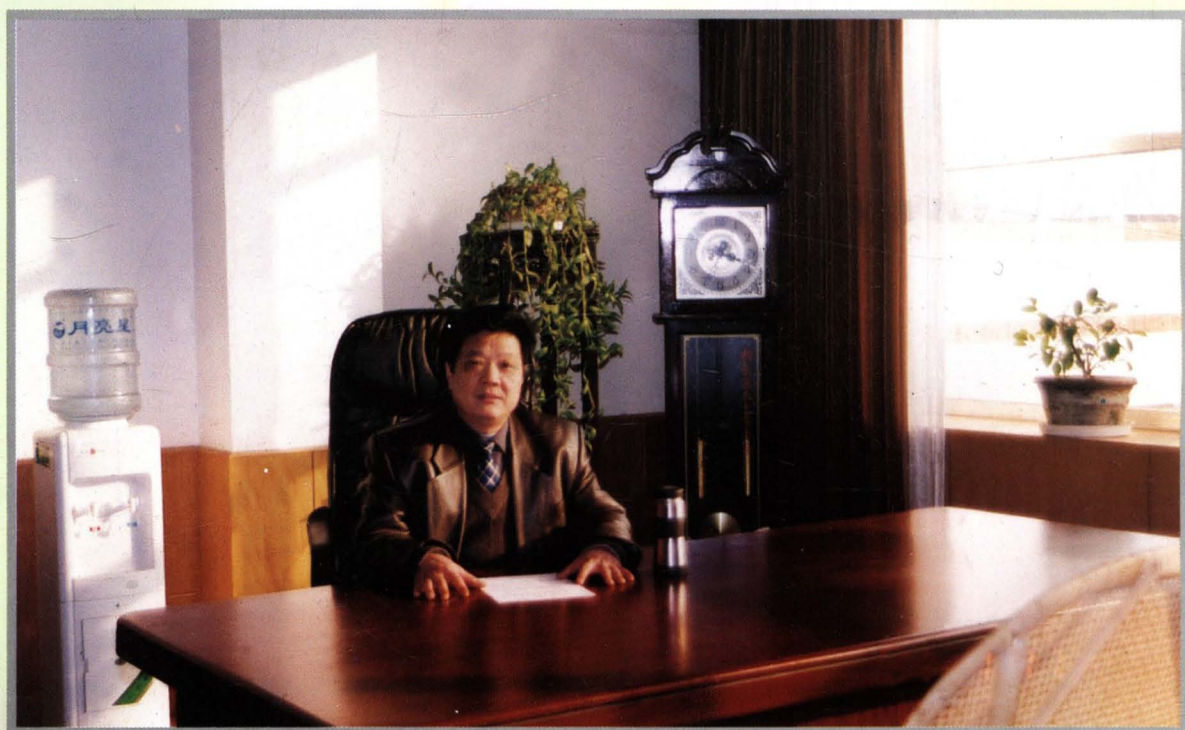
东市区第十三届人大常委会主任刘振华