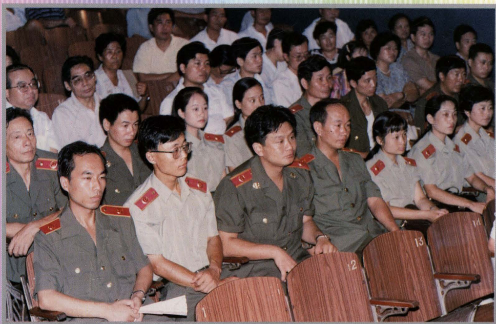
东市区人民检察院干警参加评议动员大会