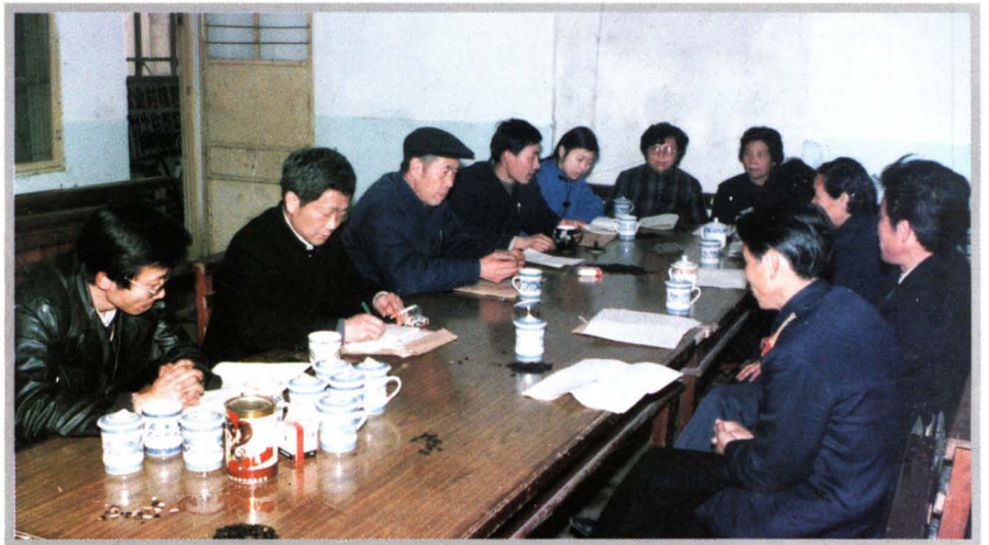
东市区十届人大四次会议期间，宏业村代表团代表在审议工作报告