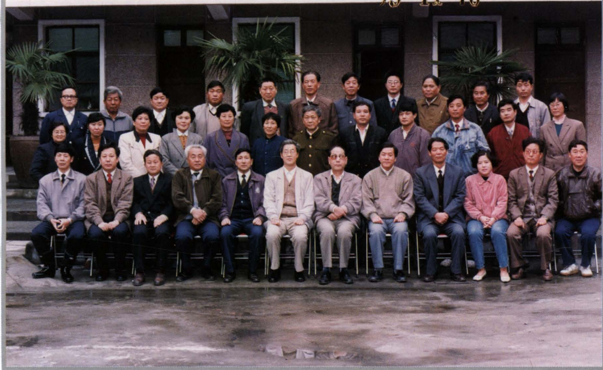
蚌埠市三县四区人大工作研讨会第五次会议于1993年11月10日在东市区政府三楼会议室召开。图为省、市、区人大领导人及特邀合肥市东市区、铜陵市狮子山区人大负责人合影