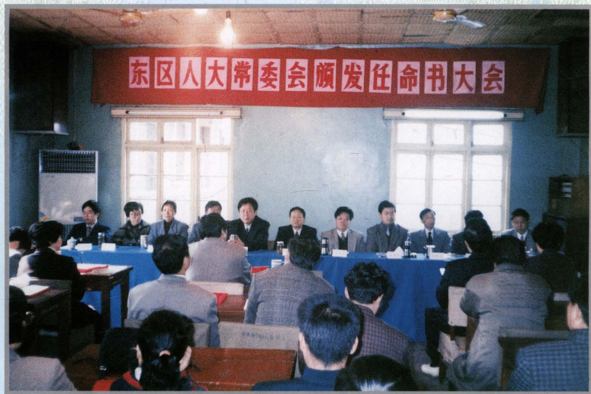
东市区十三届人大常委会召开颁发任命书大会