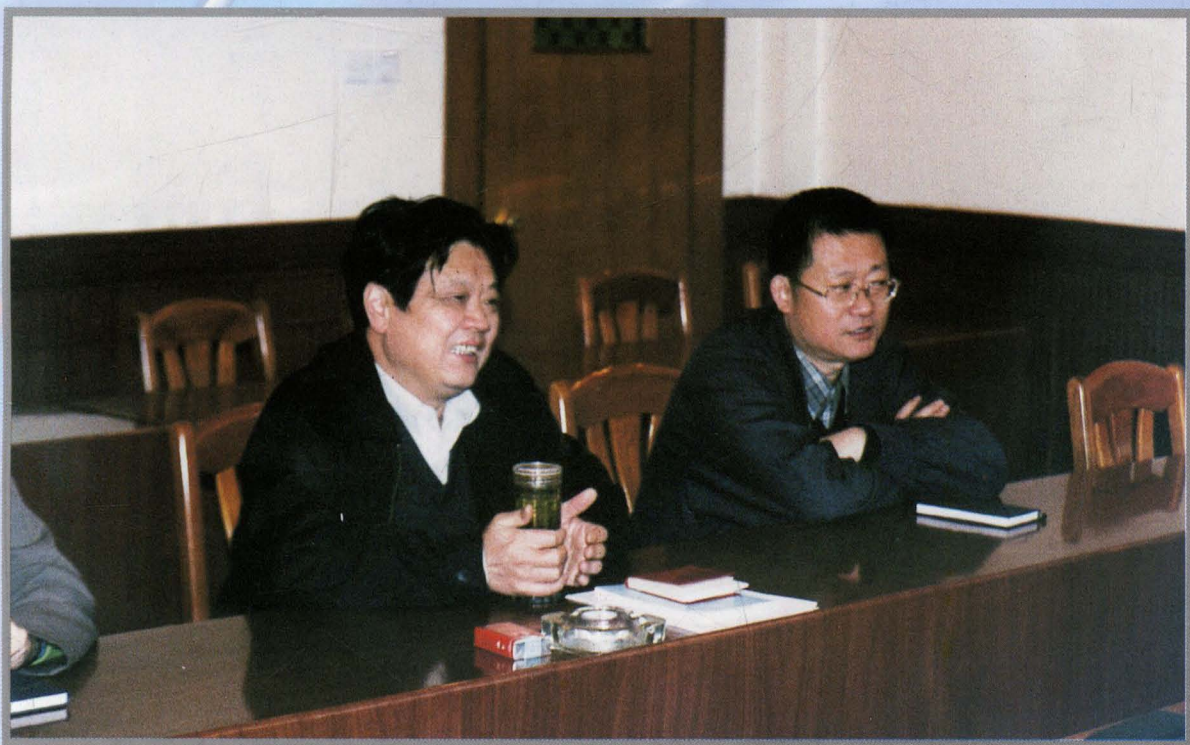
区委书记朱忠权(右)、区人大常委会主任刘振华向市人大常委会领导汇报工作