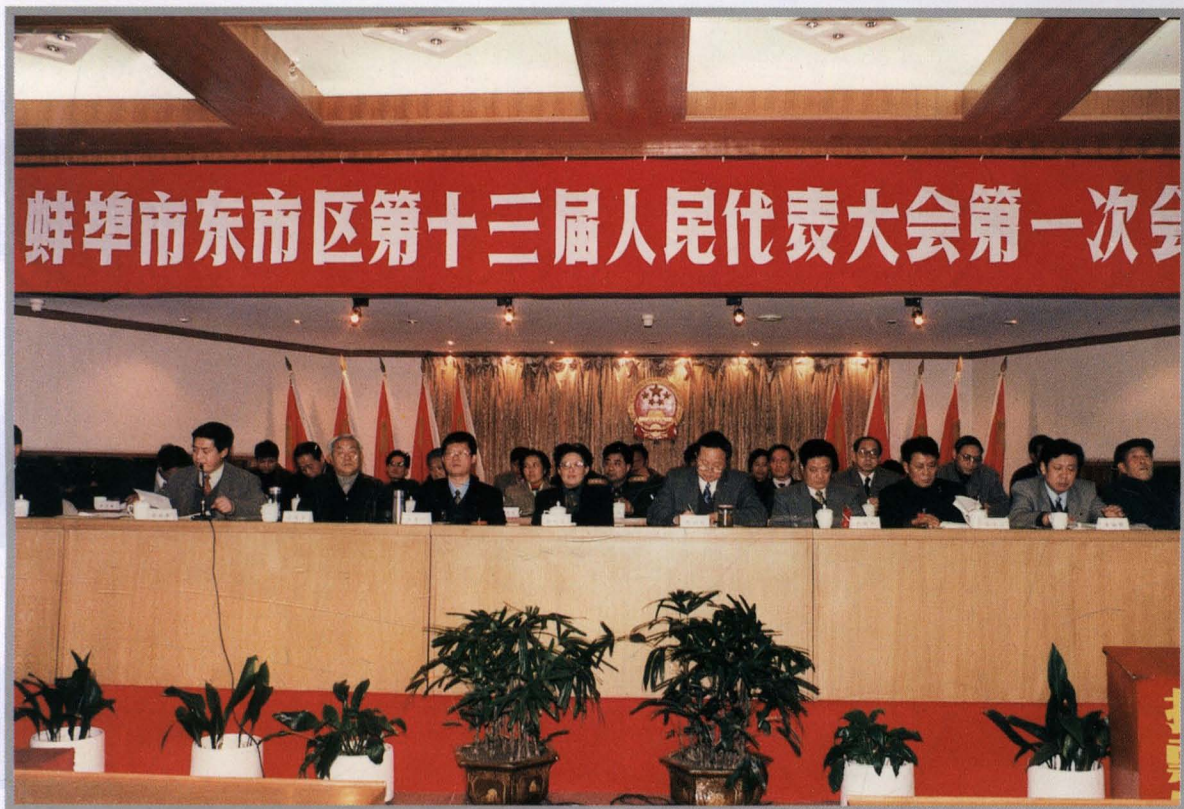
区第十三届人民代表大会第一次会议于1997年12月下旬召开。 上图为大会主席台,下图为与会代表听取大会工作报告。