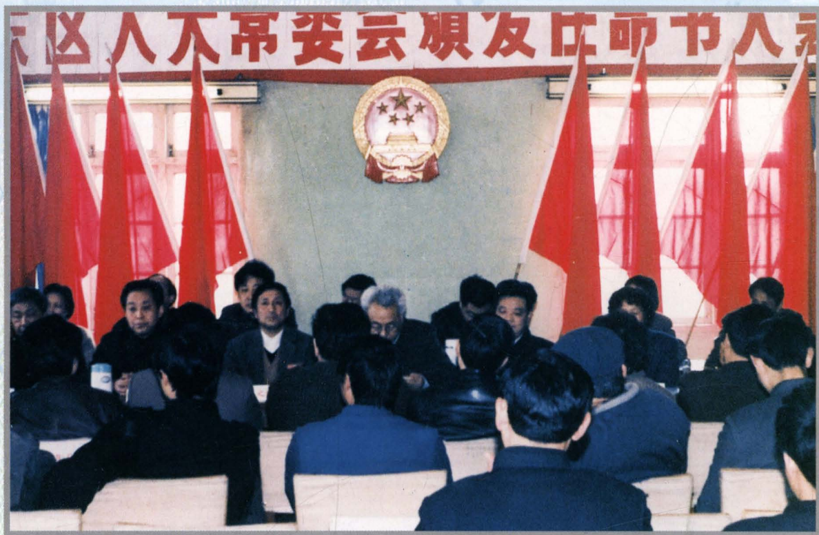
东市区十二届人大常委会召开颁发任命大会，向任命的国家工作人员颁发证书