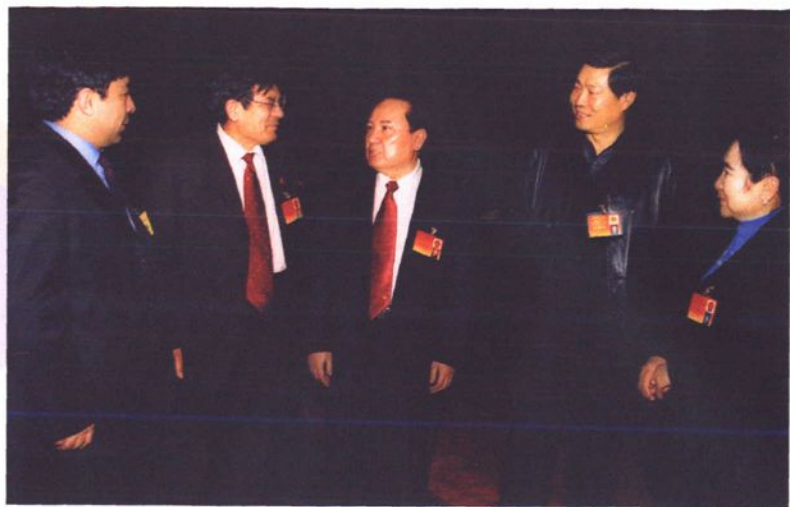
●中共新疆维吾尔自治区党委副书记、自治区人民政府主席司马义·铁力瓦尔地同志在自治区十届人大一次会议上向喀什地区的代表了解喀什地区的教育情况。