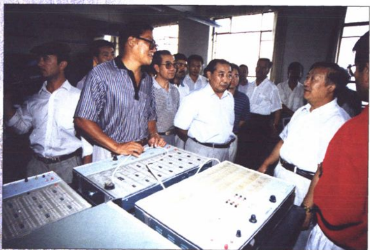
●1998年10月教育部副部长周远清视察喀什教育工作。