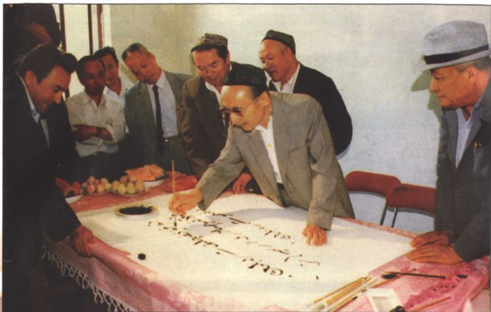
●1988年9月10日，中共中央政治局委员、全国人大常委会副委员长赛福鼎·艾则孜同志视察喀什师范学院时，为喀什师范学院题词：“当教师光荣，培养教师更光荣”。