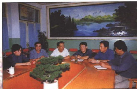
● 喀什地区教育委员会领导班子。