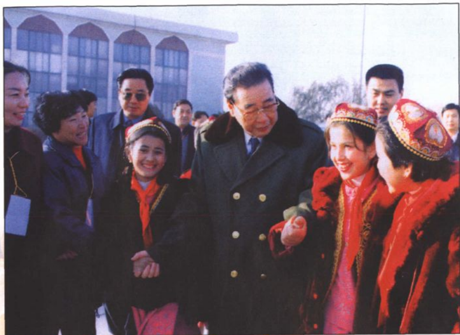
● 1999年12月6日，李鹏委员长在喀什视察工作时与喀什各族少年儿童在一起。