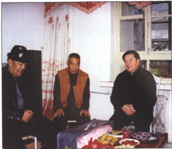
● 喀什行署副专员买买提明·皮尔多斯看望退休老教师。