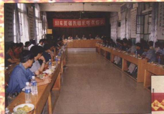
● 喀什地区领导代表喀什各族人民欢迎山东援疆教师来喀。