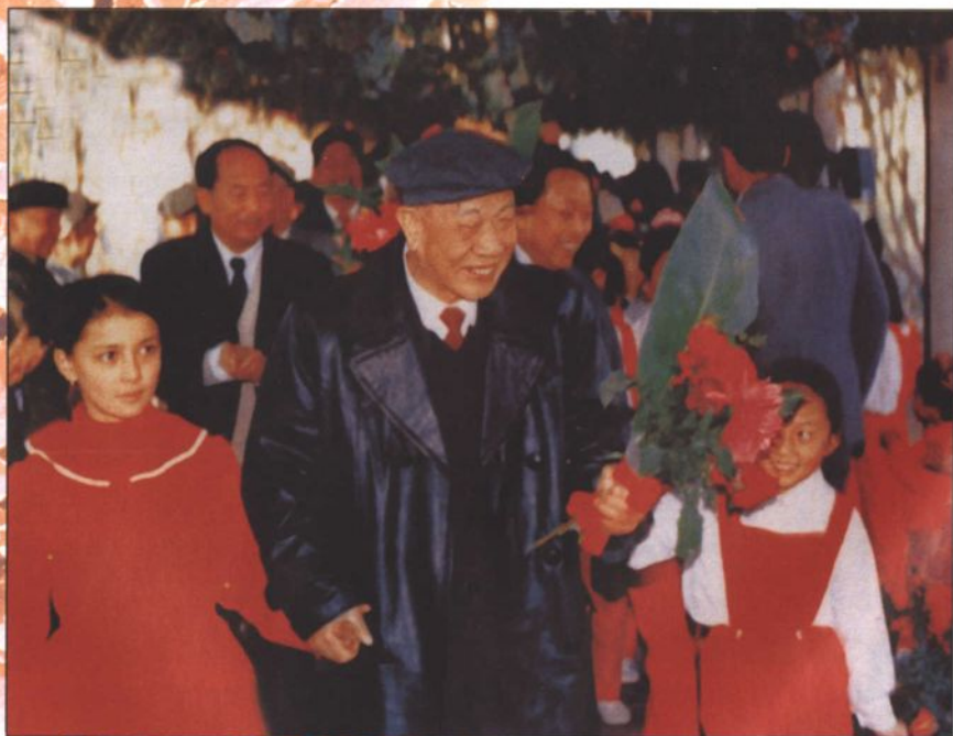
●1989年11月，全国政协副主席、自治区顾委主任王恩茂在喀什视察工作时与喀什各族少年儿童在一起。