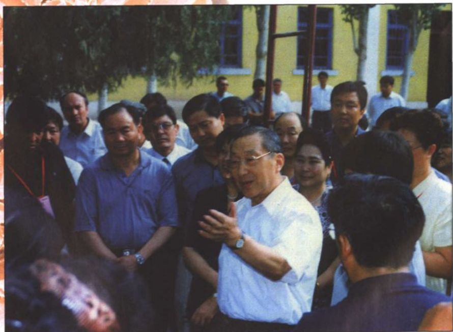
● 2000年8月20日中共中央政治局常委、国务院副总理李岚清以及教育部部长陈至立等在自治区党委书记王乐泉以及地区党政领导的陪同下视察了喀什地区的教育工作。