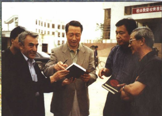
● 2002年9月教育部副部长、中国联合国教科文组织全国委员会主任章新胜在喀什地区视察教育工作。