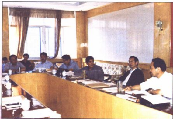
●喀什地区四大班子领导研究布置教育工作。