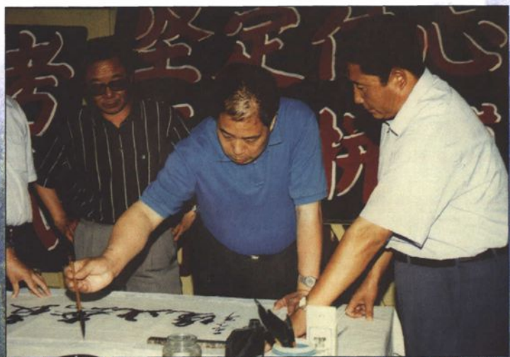
● 1999年教育部副部长张保庆在自治区政协副主席、自治区教委党组书记张贵亭陪同下来喀什视察工作时为喀什二中题词。