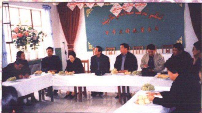
●中共喀什地委书记姚永锋带领地市领导与双职工座谈。