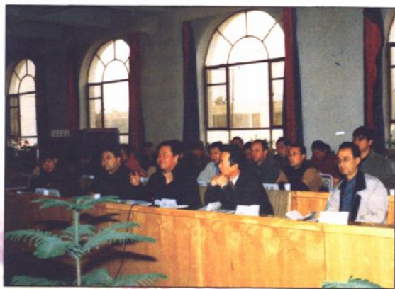
●新疆维吾尔自治区教育厅厅长沙塔尔·沙吾提在喀什与教育工作者座谈。