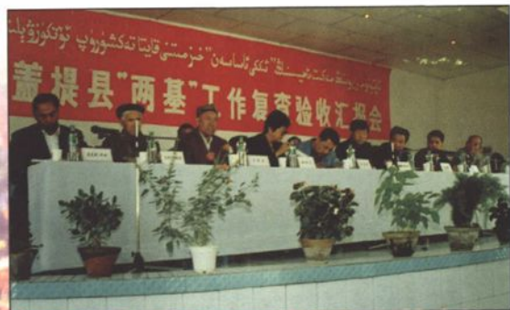
● 麦盖提县“两基”工作通过自治区复验。