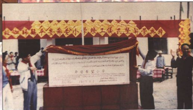
● 伽师县地震后平安希望小学竣工仪式。