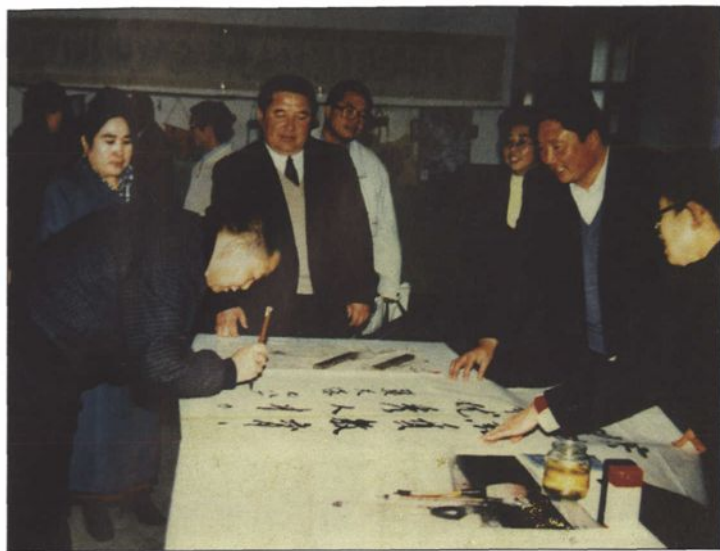
● 1998年11月13日教育部副部长张天保在喀什视察教育工作后题词留念。