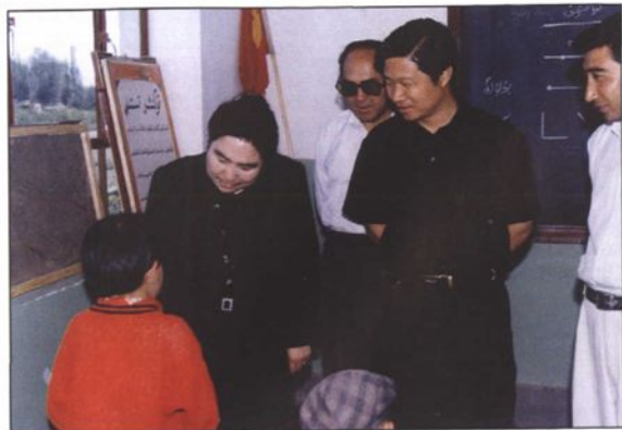
● 中共喀什地委副书记孜乃提·吾买尔在喀什市小学检查工作。