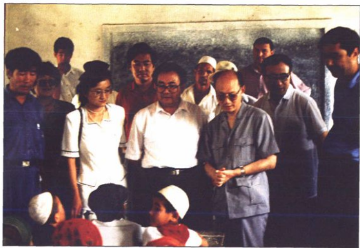
●1996年 中共中央委员、国家教委主任朱开轩在自治区副主席吾甫尔·阿不都拉的陪同下来喀什视察教育工作。