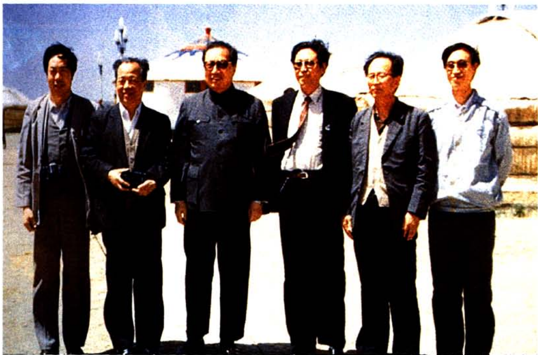
1987年7月，中共中央政治局常委、全国人大常委会委员长乔石视察四子王旗