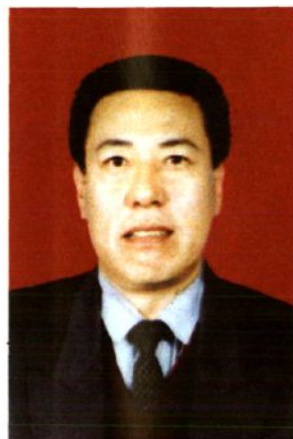
帅志凯 2004年4月至今 任政协乌兰察布市第一届委员会主席