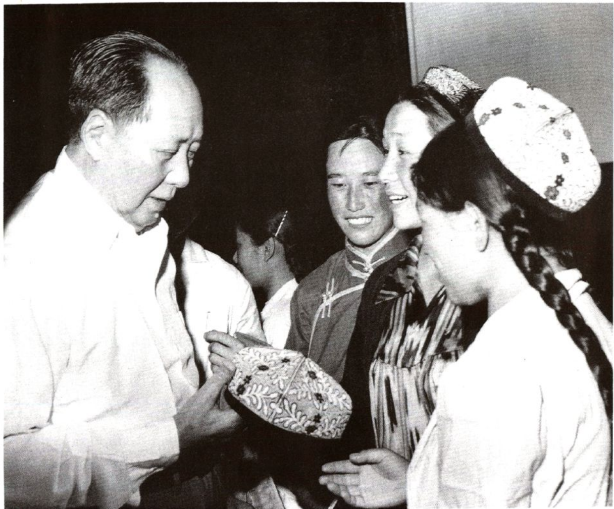
1963年6月12日,毛主席亲切接见出席共青团第九届全国代表大会乌兰察布盟代表旭仁花(右三)