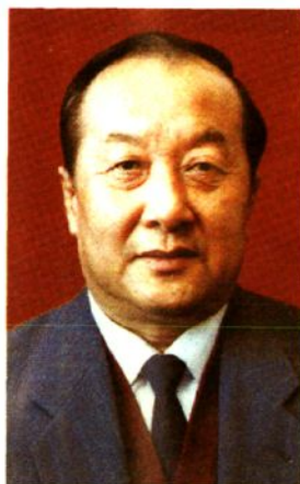
杨尚 1990年8月—1991年3月 任政协乌兰察布盟第七届委员会主席