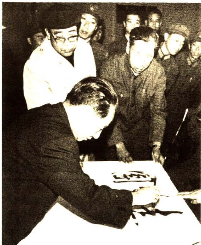
1984年9月，中共中央总书记胡耀邦视察乌兰察布盟，并题词「团结起来，建设边疆」