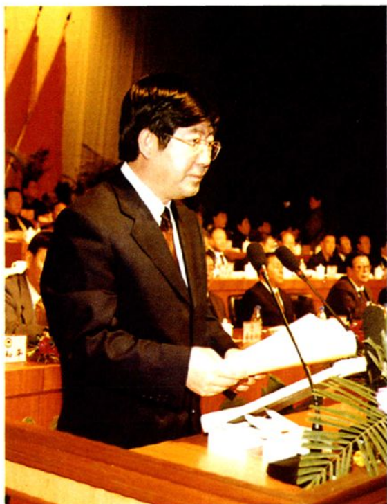
中共乌兰察布市委副书记、政府市长傅铁钢在政协乌兰察布市第一届委员会第一次会议上讲话