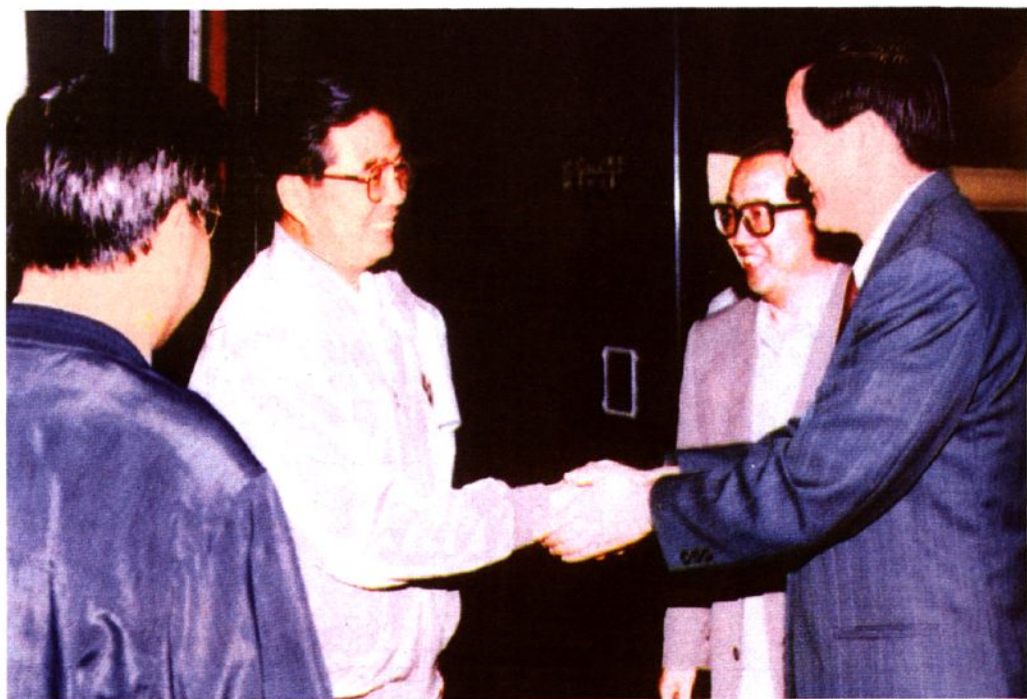
1994年,中共中央政治局常委、书记处书记胡锦涛在乌盟视察工作时与乌盟行署盟长王维山(右一)亲切握手(右二为中共乌盟盟委书记韩振祥)