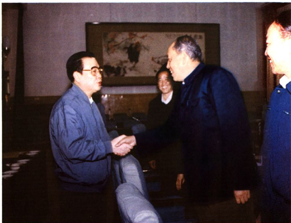
1992年2月,中共中央政治局常委、全国人大常委会委员长李鹏接见全国机构改革试点县代表卓资县县委书记朱暄(右二)