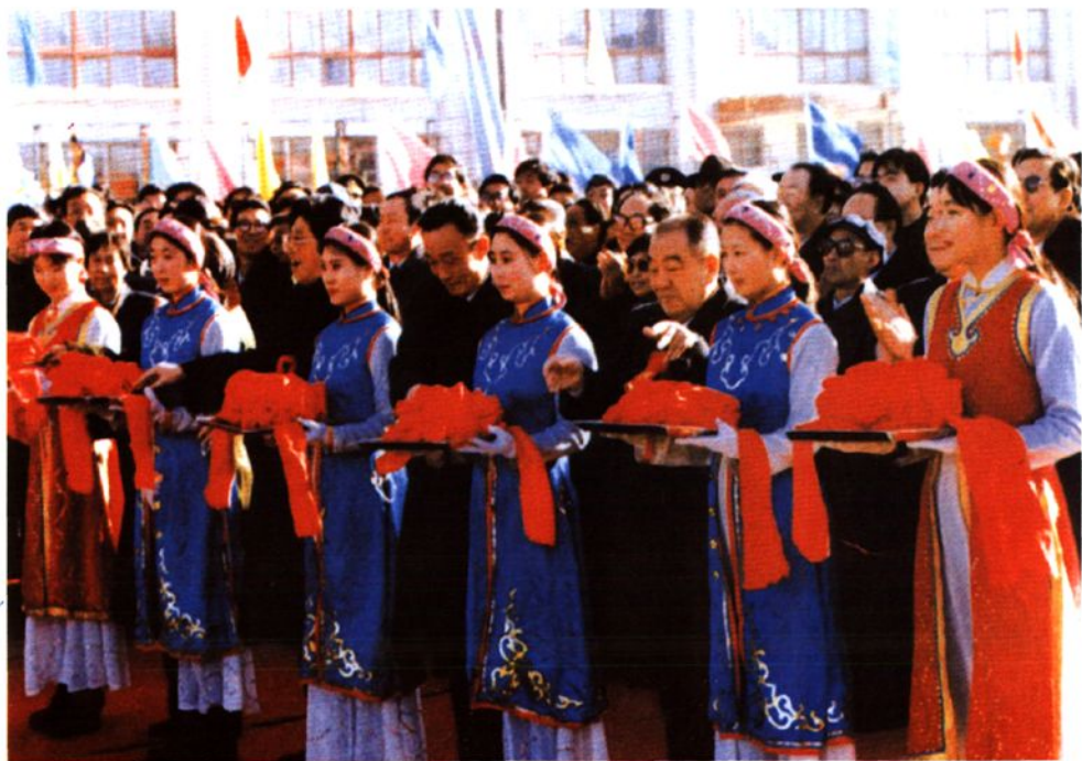
1995年12月,国务院副总理吴邦国为集通铁路开通剪彩