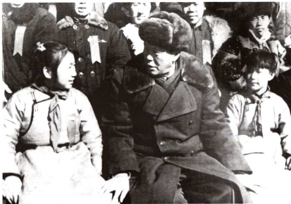
1965年,国务院副总理、内蒙古自治区人民政府主席乌兰夫与草原英雄小姐妹龙梅玉荣交谈