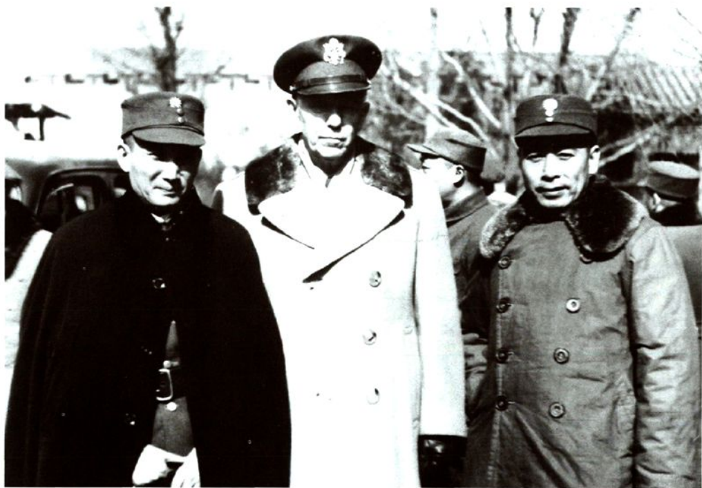
1946年1月,集宁战役结束后,周恩来等军调处执行部三人小组飞抵集宁视察