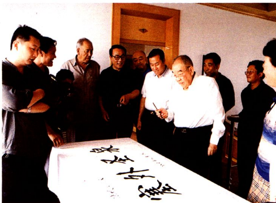
2003年8月,原全国人大副委员长布赫在凉城县视察工作