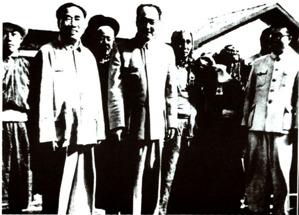
1958年10月,朱德委员长深入乌兰察布盟牧区视察