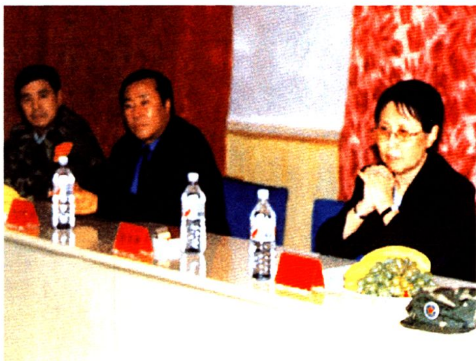
1999年7月,全国人大常委会副委员长乌云其木格在四子王旗视察工作