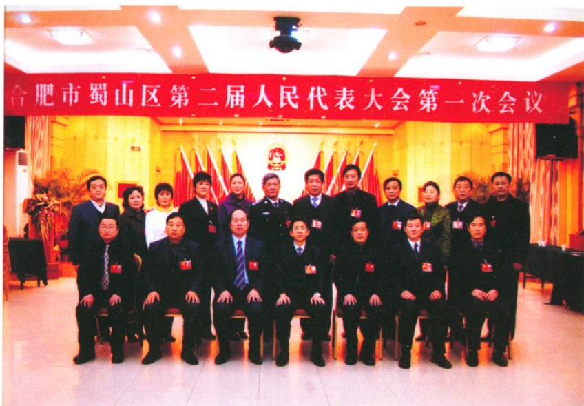
合肥市蜀山区第二届人大常委会组成人员合影（2007年1月25日）