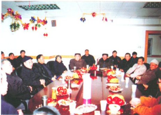
邀请人大离退休的老同志参加新春茶话会(2001年春节)