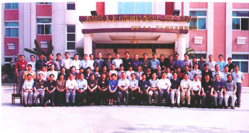
九城区人大工作研讨会第十二次会议与会人员合影（2002年6月6日）