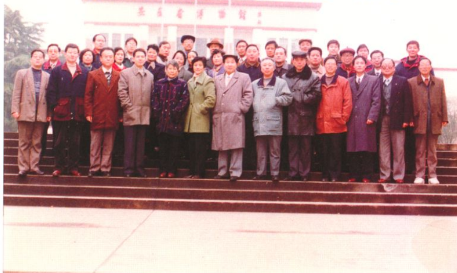
合肥市西市区第十二届人大常委会第三十四次会议全体人员合影（1998年2月26日）