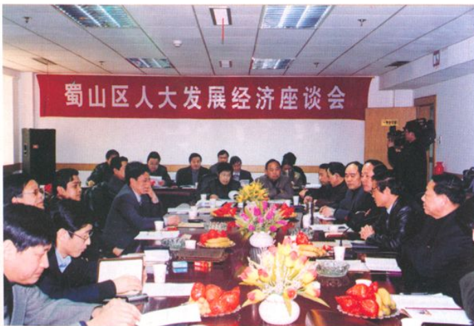
召开发展经济座谈会