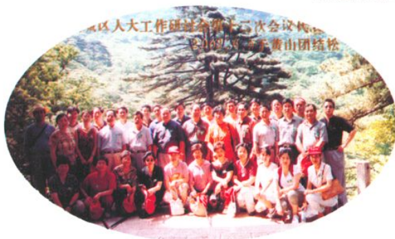
全国九城区人大工作研讨会第十二次会议与会人员于黄山团结松合影（2002年6月9日）