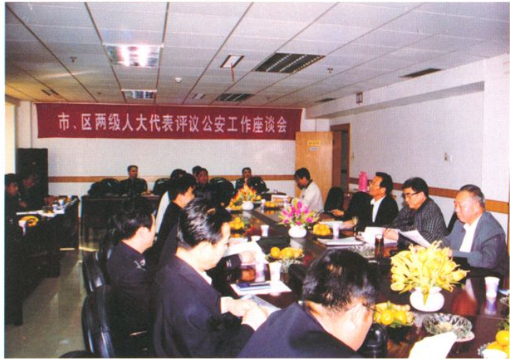
市、区两级人大代表评议公安工作座谈会