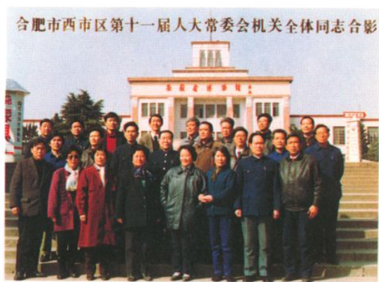
合肥市西市区第十一届人大常委会机关全体人员合影（1993年3月旧）