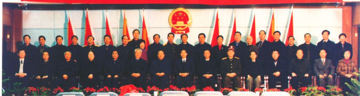
合肥市蜀山区成立大会（2002年3月6日）