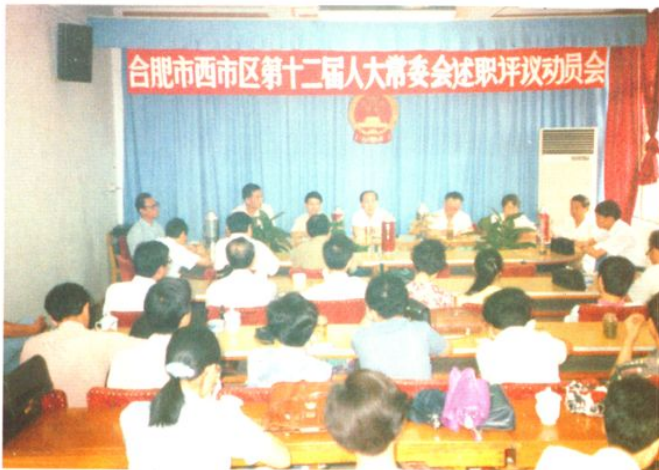
合肥市西市区第十二届人大常委会述职评议动员会