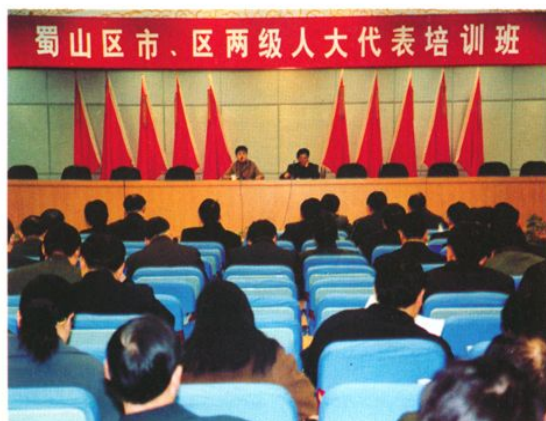
举办市、区两级人大代表培训班（2003年3月）