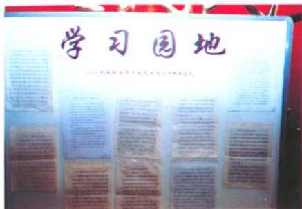
保持共产党员先进性教育学习园地（2005年上半年）