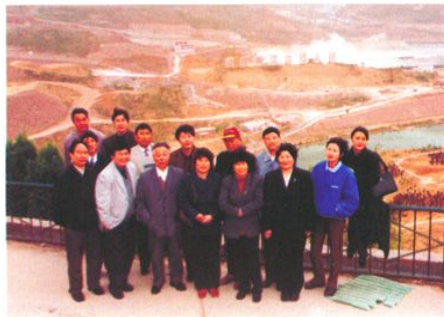
赴河南参观黄河小浪底工程（2001年4月9日）