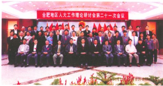
承办合肥地区人大工作研讨会第二十一次会议（2000年10月12日）