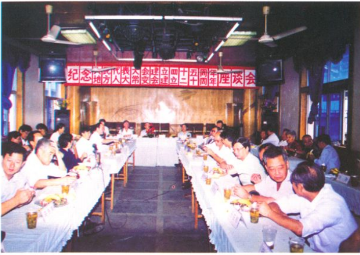
举办纪念人民代表大会建立45周年暨地方人大常委会建立20周年座谈会（1999年9月15日）