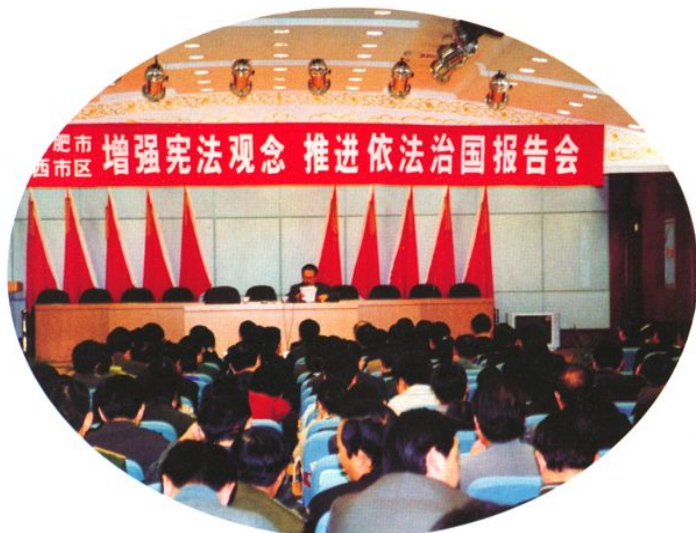
举办增强宪法观念推进依法治国报告会