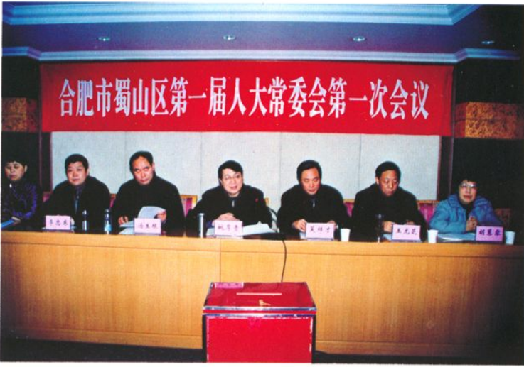
合肥市蜀山区第一届人大常委会主任副主任主持常委会第一次会议（2003年1月28日）