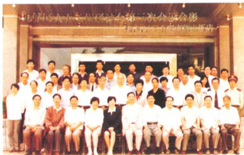
承办全国九城区人大工作研讨会第三次会议（1993年9月22日）