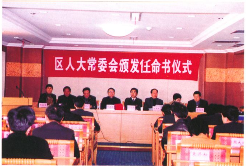
蜀山区第一届人大常委会举行颁发任命书仪式（2003年3月21日）