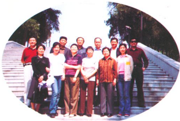
瞻仰金寨县革命烈士陵园（2005年）