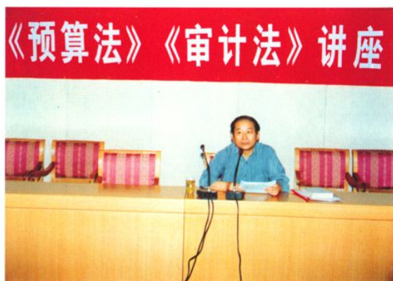
举办预算法审计法知识讲座