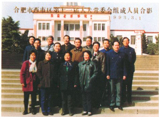
合肥市西市区第十一届人大常委会组成人员合影（1993年3月旧）