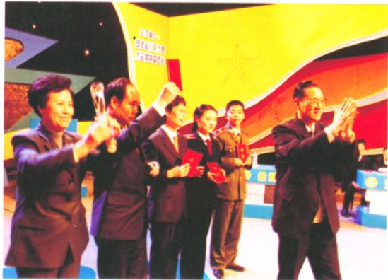
省九届人大常委会主任孟富林为全省美菱杯宪法知识竞赛电视决赛第一名获得者合肥市代表队颁奖（2002年12月4日）