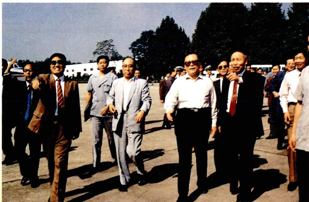
1989年9月14日中共中央总书记江泽民视察阎良