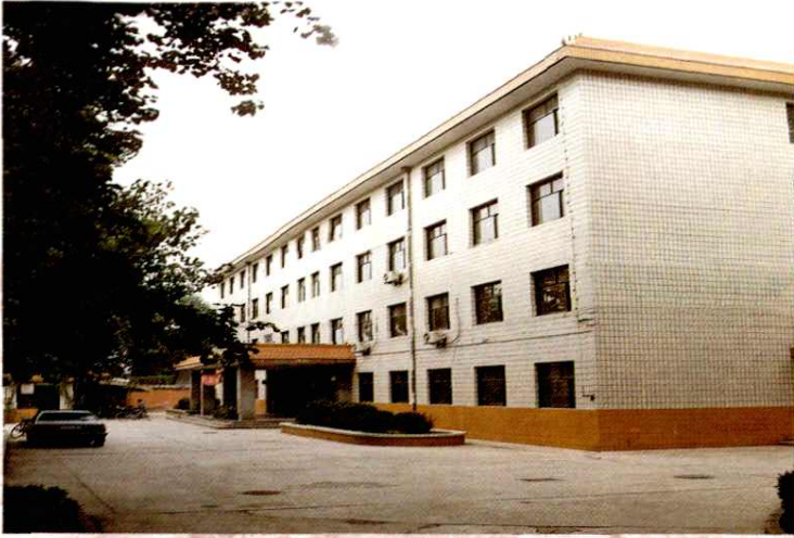
中国共产党西安市阎良区委员会