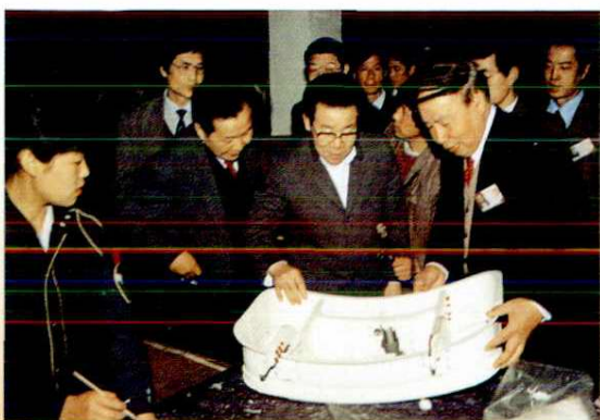
1990年4月15日中共中央政治局常委李瑞环视察阎良