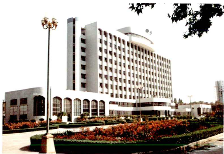
西安飞机制造公司科研楼