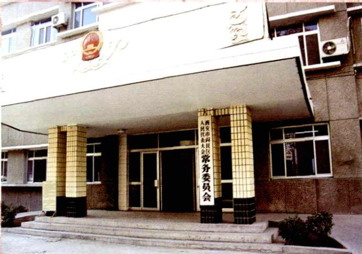
西安市阎良区人民代表大会常务委员会