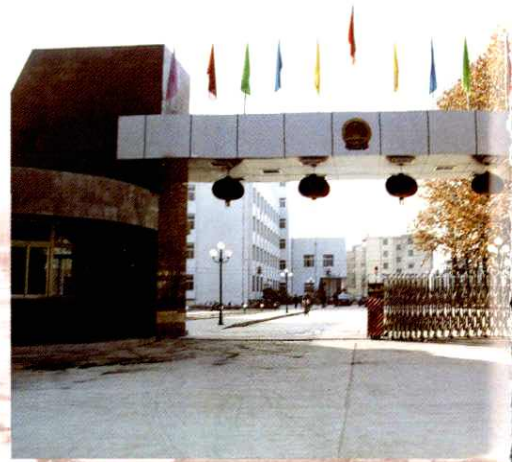
西安市阎良区人民政府、中国人民政治协商会议西安市阎良区委员会