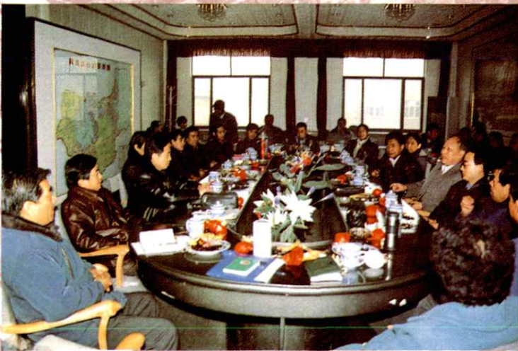
区委、区政府领导人与驻区单位领导人共商建设新阎良