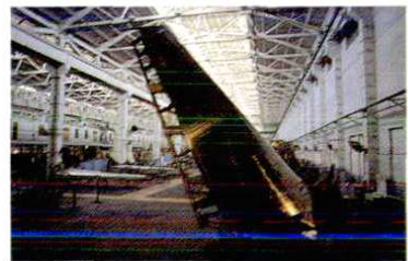
波音 737 飞机垂尾生产线