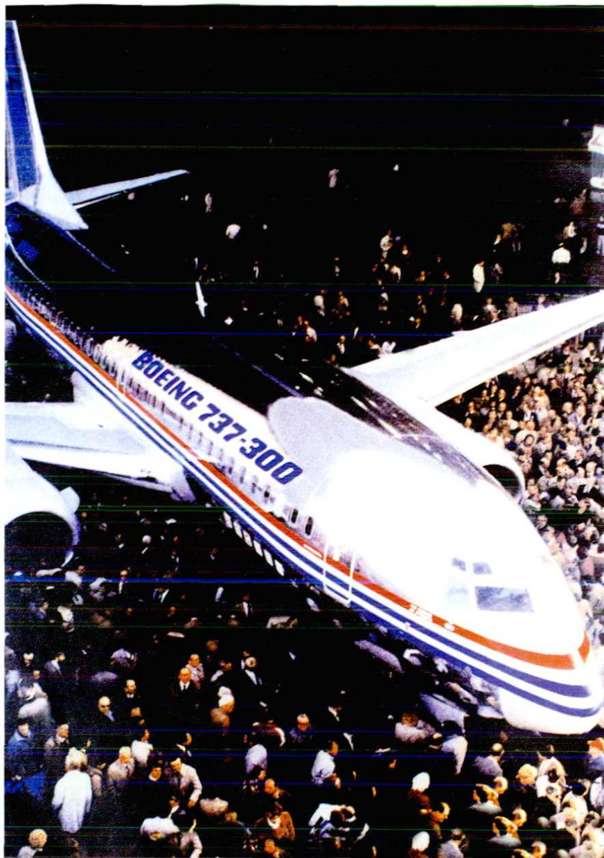
西飞公司为波音 737-300 生产的垂尾、平尾在美国对接成功