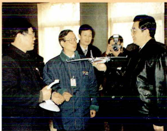
1995年1月21日中共中央政治局常委、中央书记处书记胡锦涛视察阎良