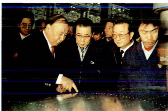
1990年11月18日国务院总理李鹏视察阎良