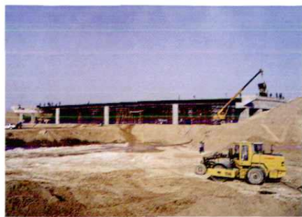
建设中的西(安)——阎(良)高速公路立交桥