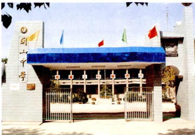
关山中学(原四维中学)