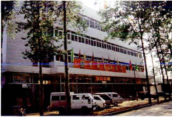
中国农业银行西安市分行阎良支行