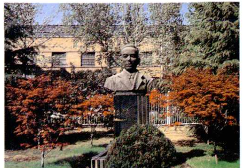
我国第一代著名飞机设计师徐舜寿塑像