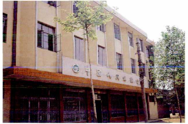
中国保险公司阎良办事处