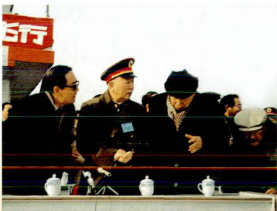
1989年1月24日中央军委副秘书长刘华清视察阎良