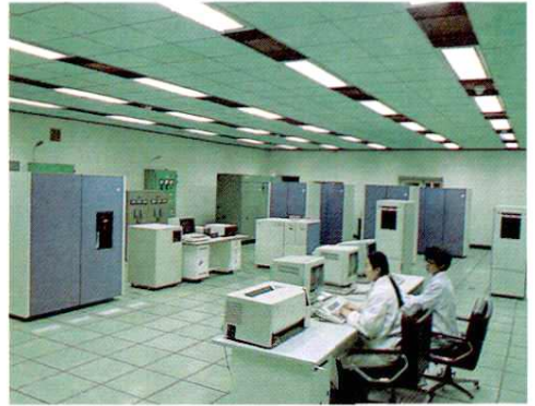
CAD/CAMM 辅助飞机制造、管理系统