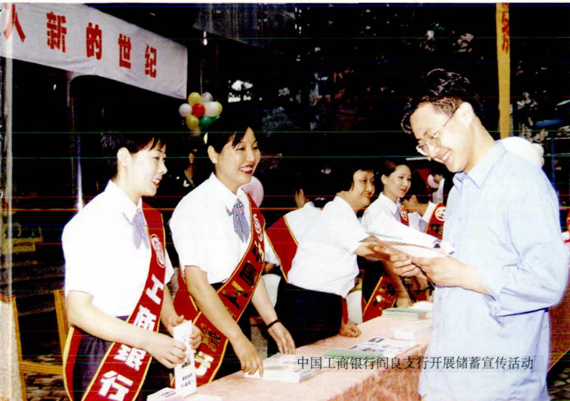
中国工商银行阎良支行开展储蓄宣传活动