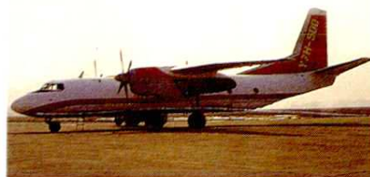
运七 H-500 型飞机