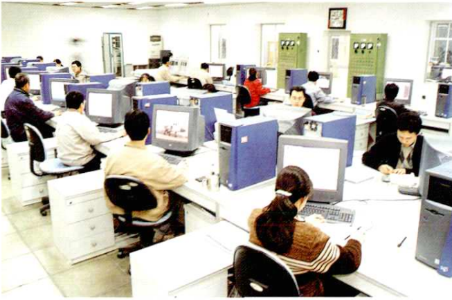
综合航电设计研究