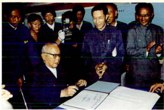
1984年9月7日国家主席李先念视察阎良