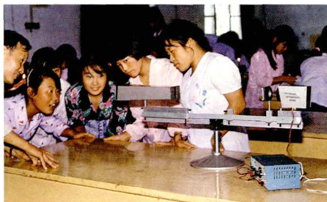
阎良二中学生在上实验课