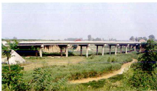
新(丰)——阎(良)公路清河桥