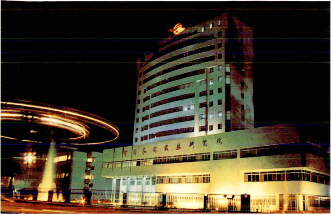
中国飞行试验研究院科研楼