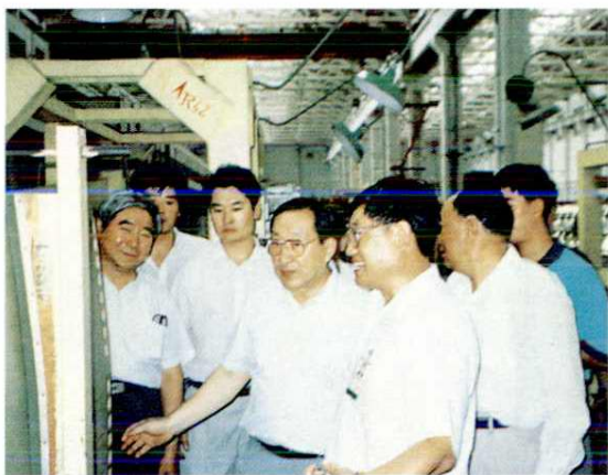
1995年7月22日国务院副总理李岚清视察阎良