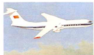
西安飞机设计研究所设计或改型设计的部分型号飞机