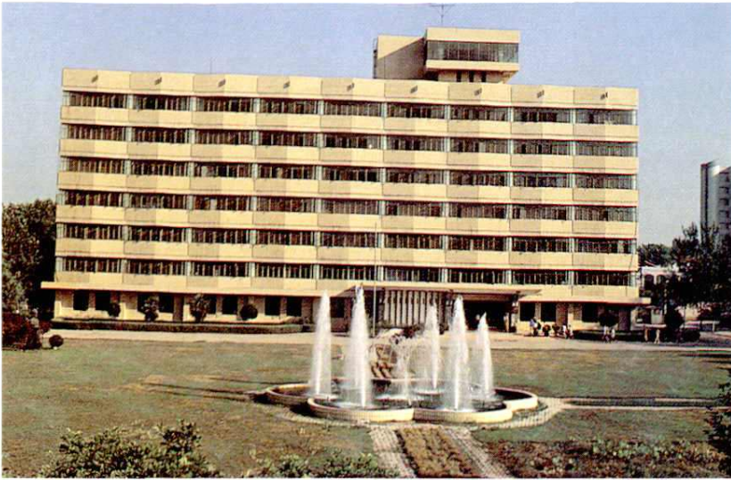
西安飞机设计研究所科研楼