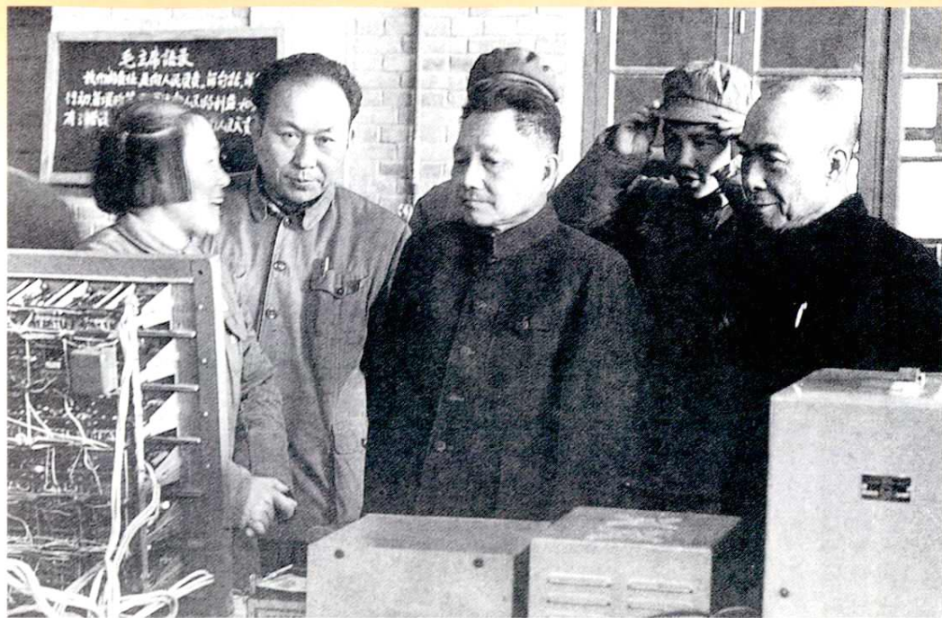
1966年3月12日中共中央总书记邓小平、国务院副总理李富春视察阎良