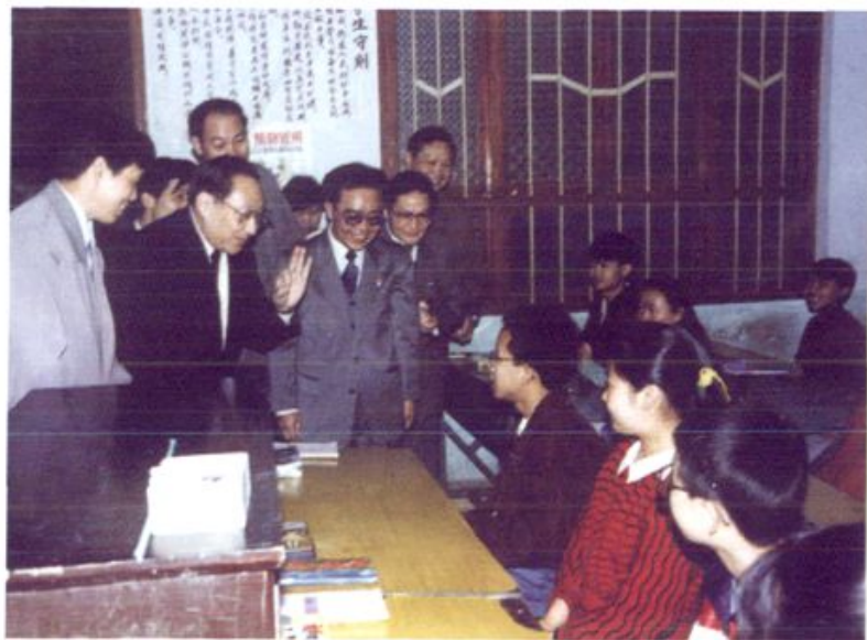
1995年4月18日，国务院副总理李岚清到清华中学视察。