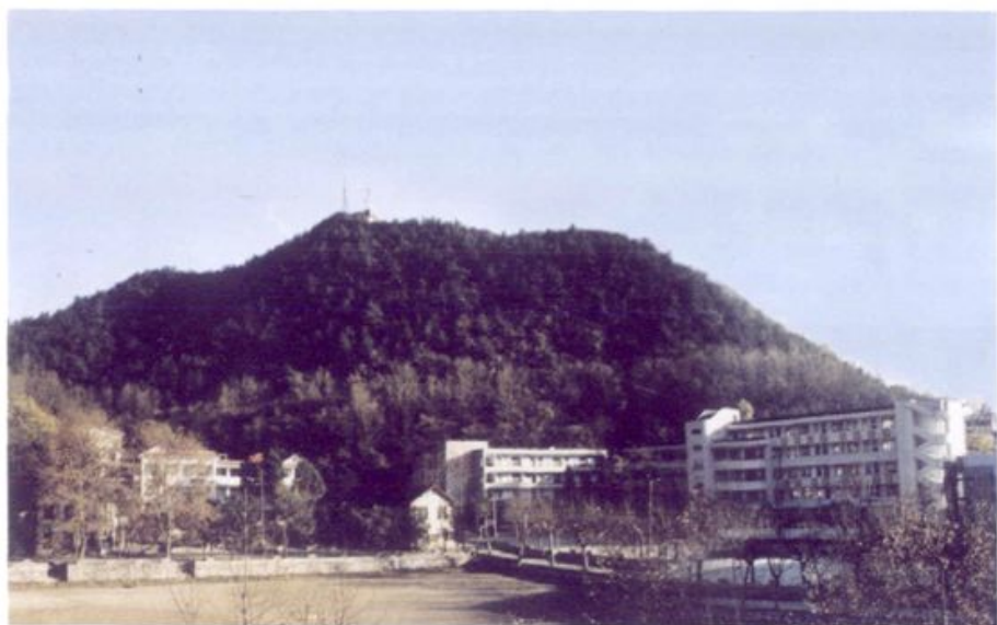
现在的清华中学（2002年）