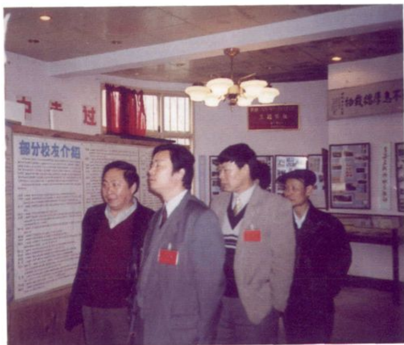
2001年1月13日，贵州省教育厅厅长 孔令中到清华中学视察。