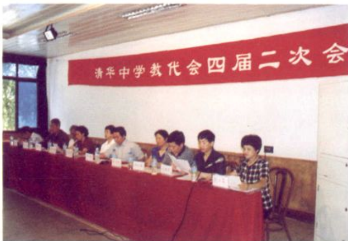
清华大学教代会四 届二次会议 (二〇〇〇年七月十一日)