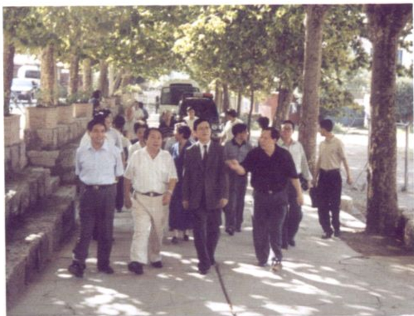
1999年教师节，钱运录省长视察 清华中学。