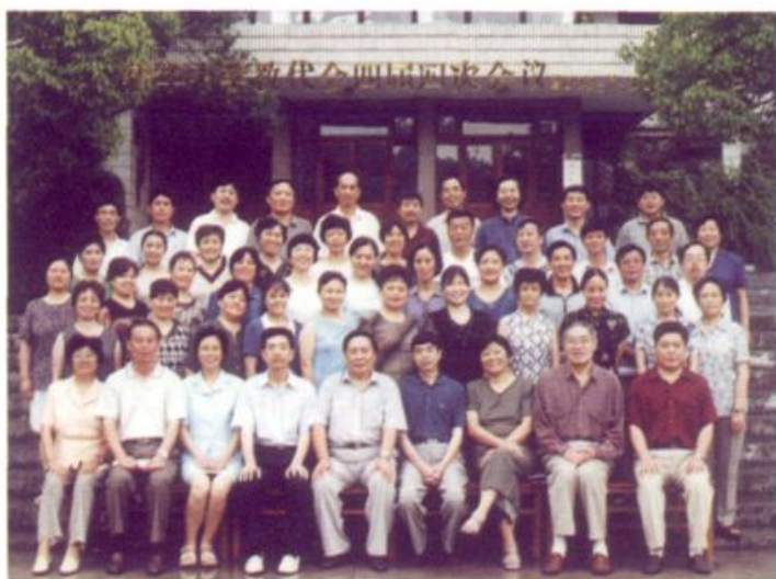
清华大学教代会 代表合影 (二〇〇二年七月十日)