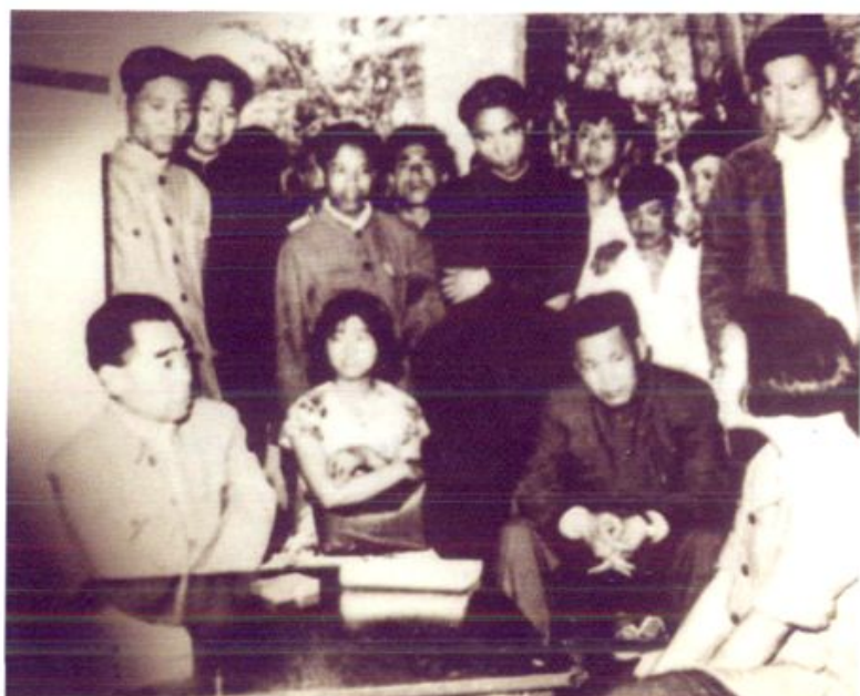
1960年，周恩来总理在花溪公园接见花溪中学学生代表。