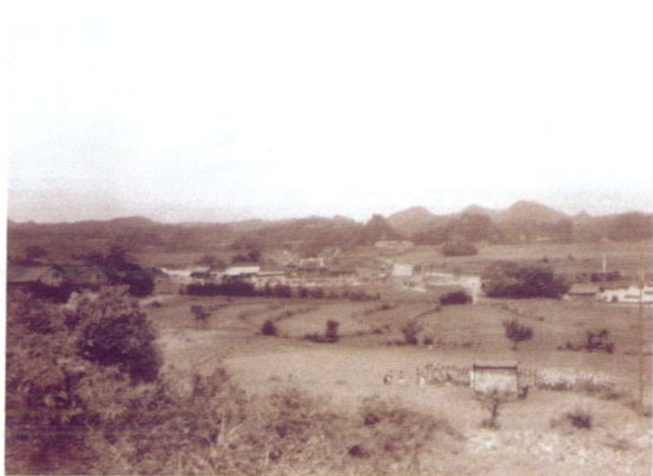
三、四十年代的清华中学