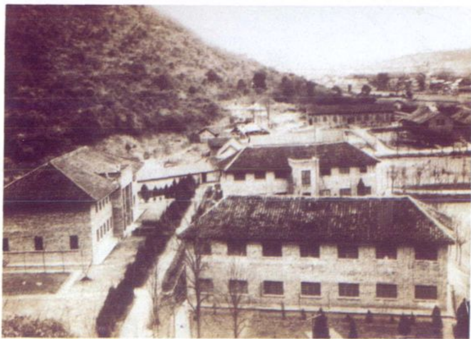
五、六十年代的清华中学