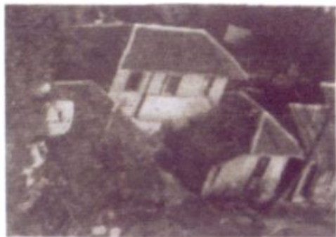
“特支”活动场地（山庄丙所）