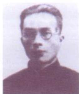
名誉董事长:梅贻琦