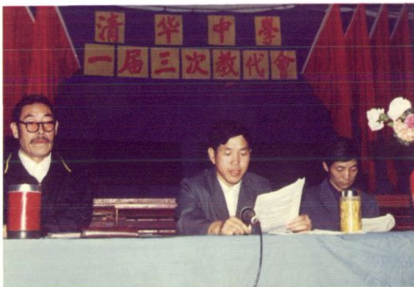
清华中学教代会一届三次会议 (1989年11月4日)