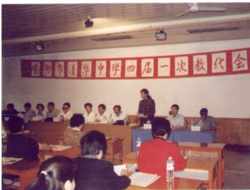
清华中学教代会四届一次会议 (1999年7月16日)