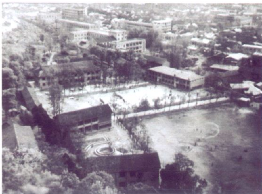
七、八十年代的清华中学