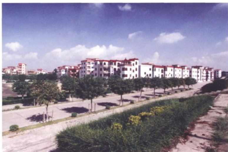
上元村农民住宅新村