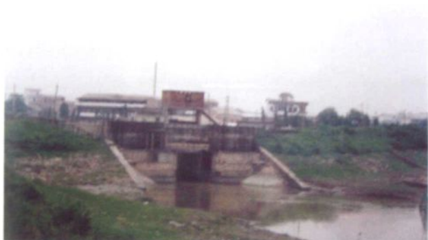
现存陈旧的水利设施南顺二联围平流水闸