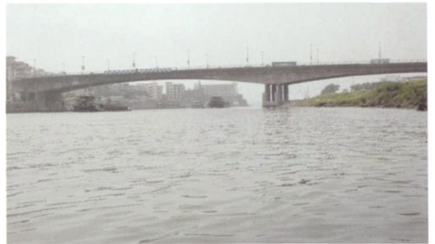
1991年9月建成的石南大桥