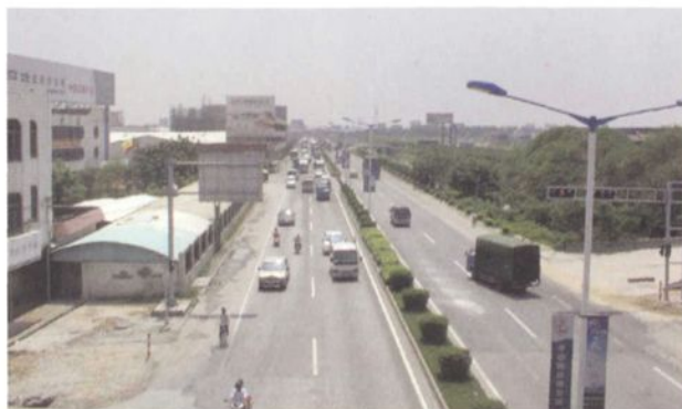
1975年建成的省道三大线镇境段樵乐公路