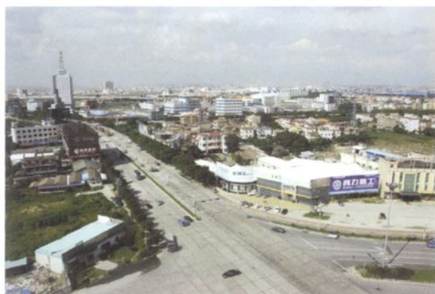
1992建成的南庄二马路