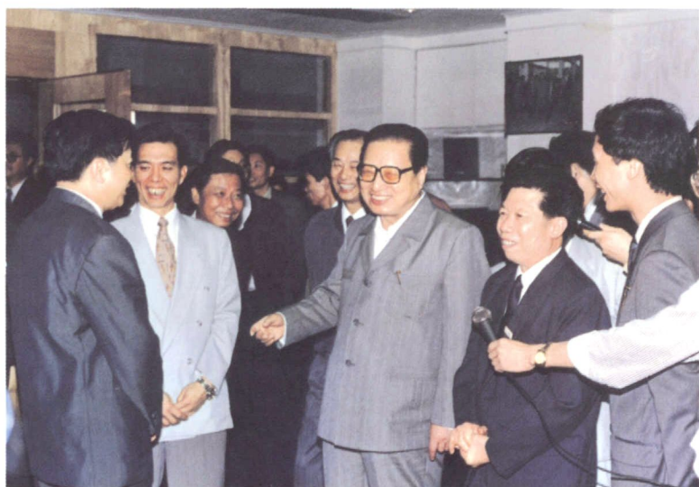
1993年4月18日，中共中央政治局常委、全国人大常委会委员长乔石(前排右三)视察兴发铝型材厂。