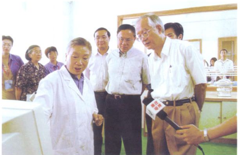
2002年9月2日，广东省副省长游宁丰(左六)，著名经济学家、国务院发展研究中心研究员吴敬琏(左七)考察兴发铝型材厂。