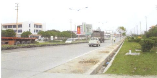
1976年建成的紫洞公路