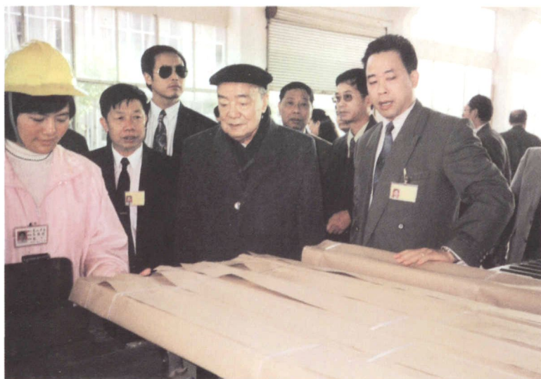
1994年12月30日，原国家主席杨尚昆(左四)视察兴发铝型材厂。