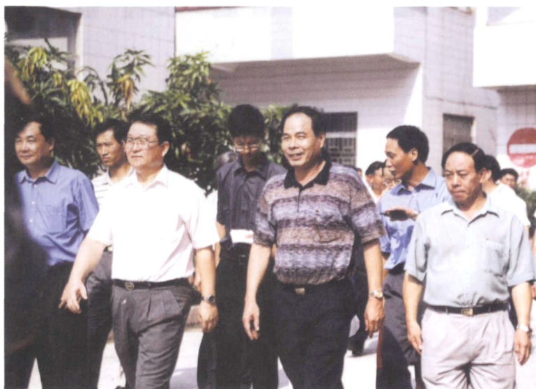
1999年7月14日，中共中央政治局委员、广东省委书记李长春(左三)视察罗南村。