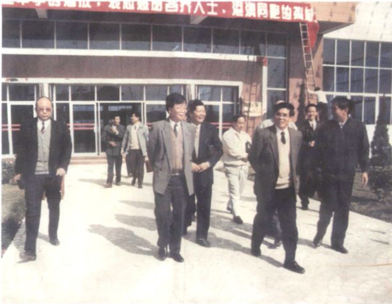
1994年12月22日，广东省副省长卢钟鹤(右三)参观新落成的南庄三中。