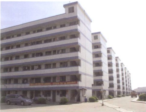
吉利村利华员工村