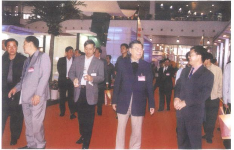
2002年10月30日，广东省政协主席郭荣昌(前排右二)考察华夏陶瓷博览城。