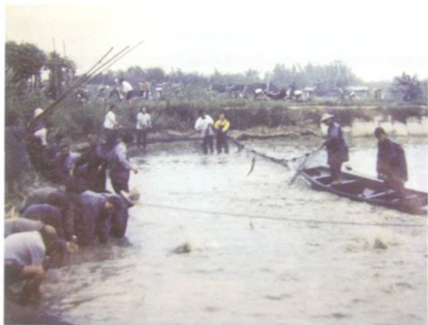
鱼跃人欢，罗南村东兴村民捕捞塘鱼（1990年摄）