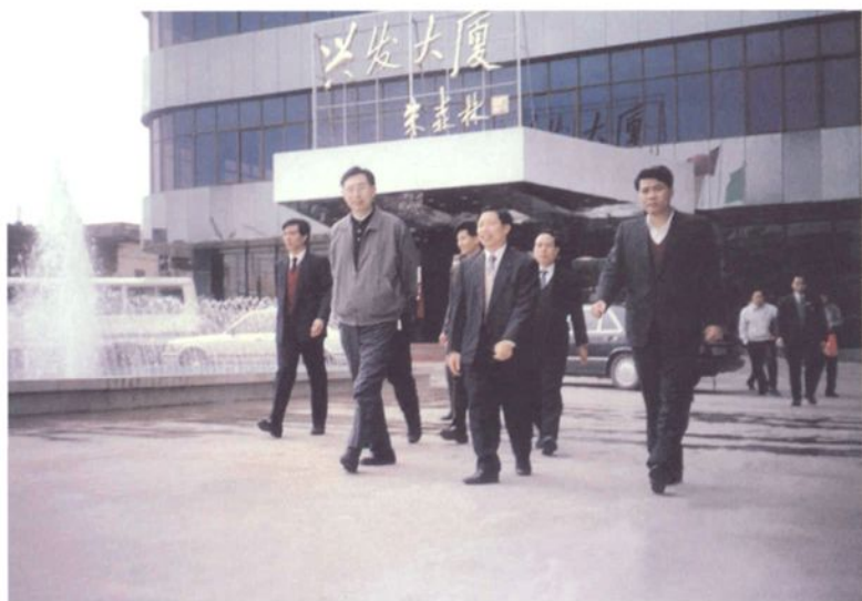
1992年12月15日，广东省省长朱森林(左二)考察兴发铝型材厂。