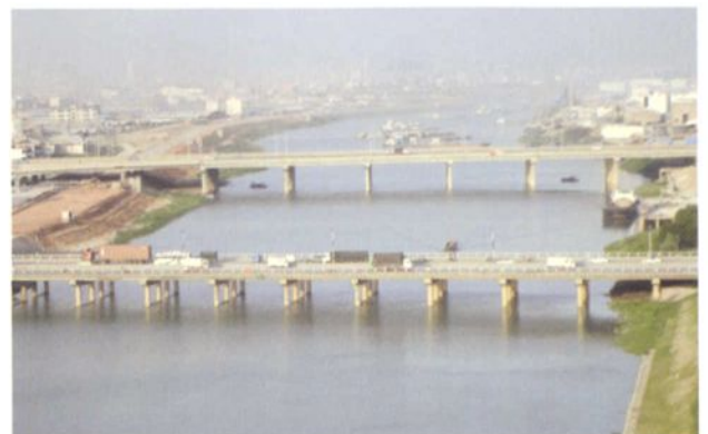
1993年初建、1996年扩建的吉利二桥(图中下方)