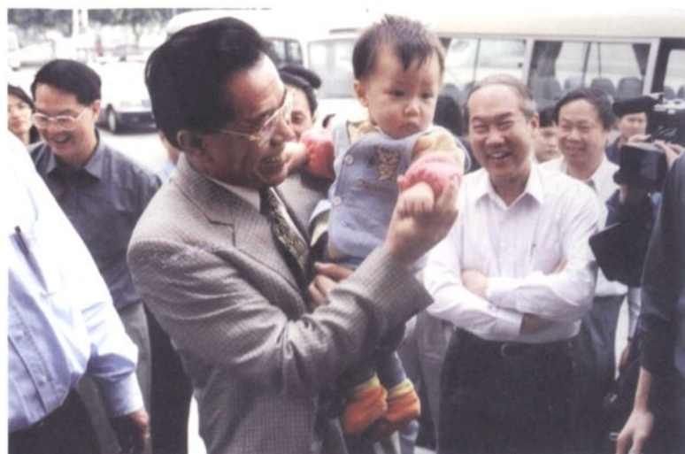
2001年3月22日，广东省省长卢瑞华(前排中)访问罗南村农家。