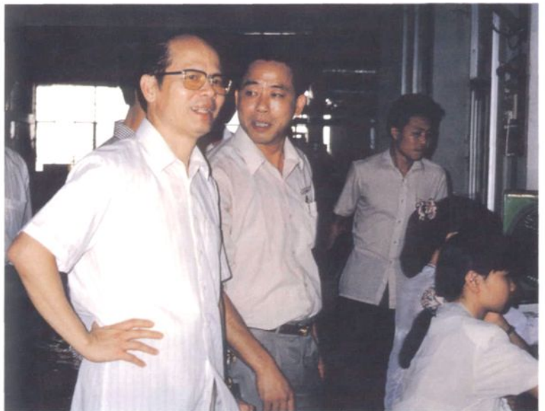
1992年9月25日，中共广东省委书记谢飞(前左一)考察南庄镇村镇工业。