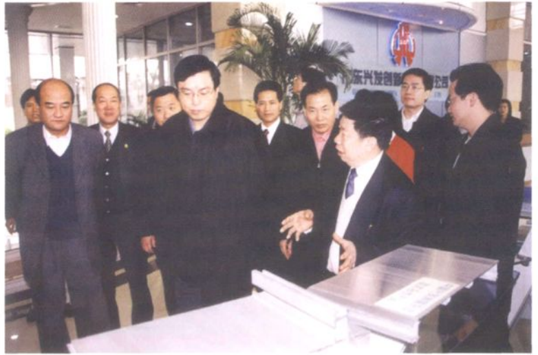
2003年2月14日，中共中央政治局委员、广东省委书记张德江(左五)视察兴发铝型材厂。