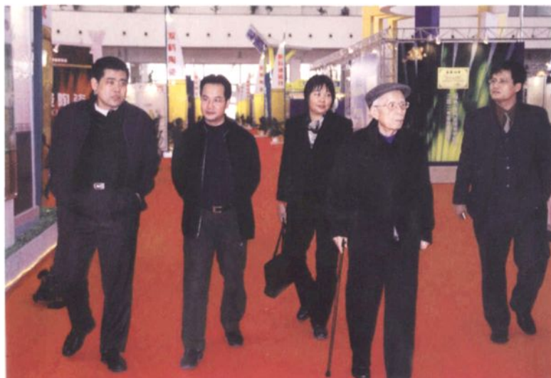
2003年1月3日，原中共广东省委书记任仲夷(右二)考察华夏陶瓷博览城。