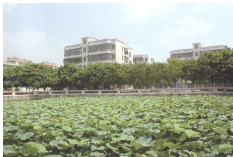
东村村南街农民公寓