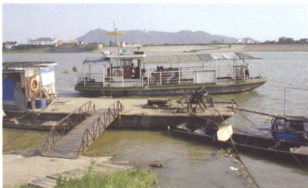
隆庆横水渡口及渡船