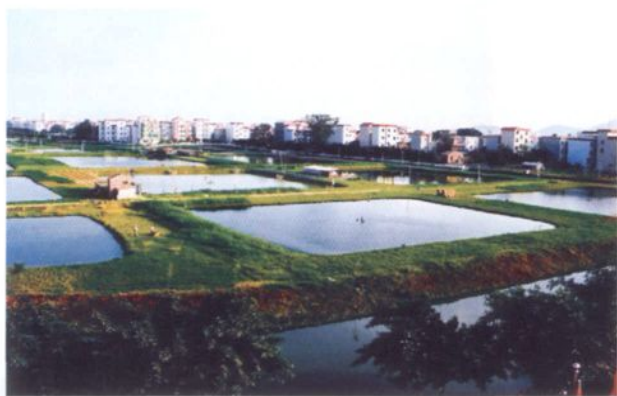
罗南村2001年整治后的鱼塘与农民住宅相映衬