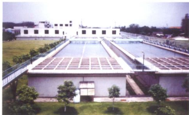
1995年5月建成供水的南庄自来水公司紫洞水厂