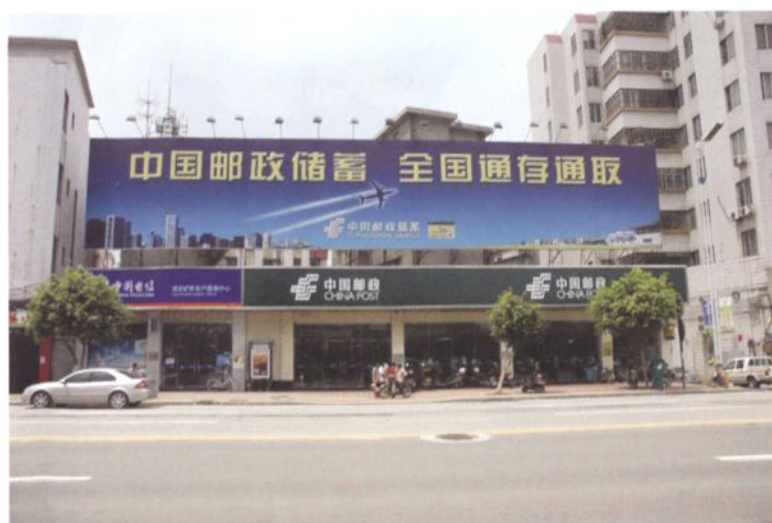
南庄邮政分局营业厅