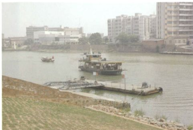
柏壑横水渡口及渡船，镇境现存两个渡口其中之一