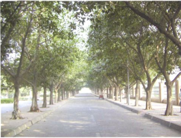
人和路至南庄二桥堤面通道