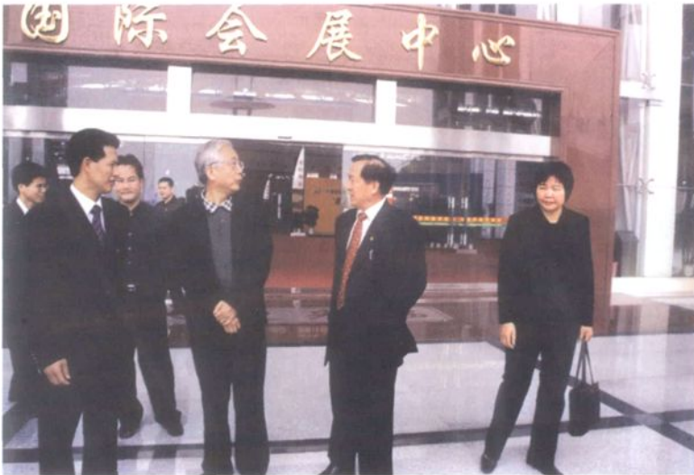
2002年12月18日，全国政协副主席张思卿(右三)视察华夏陶瓷博览城。