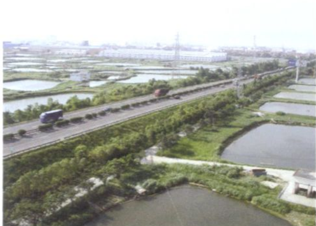
1996年10月通车的佛开高速公路镇境吉利村路段