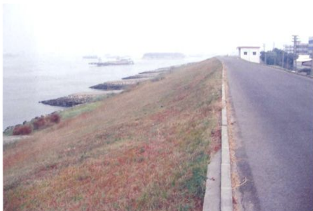
整治加固后的罗格围嘉村段堤围