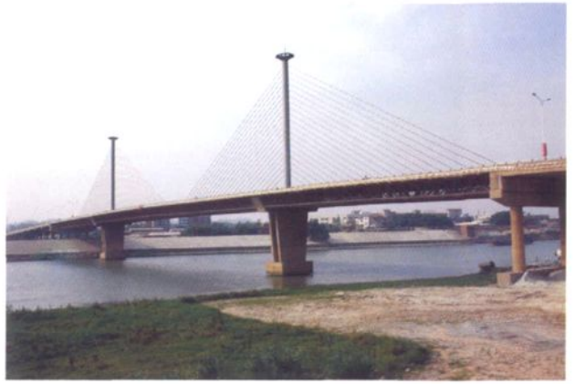
1996年7月建成的紫洞大桥