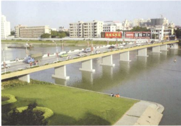
1993年重建的吉利大桥