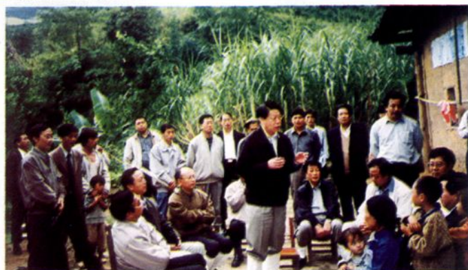
2000年10月13日,卫生部副部长殷大奎到兴义市视察传染病工作。