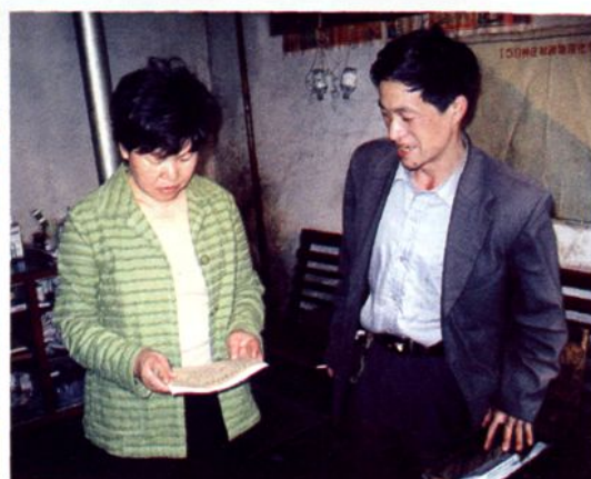
州政府副州长童其芳视察新型农村合作医疗工作