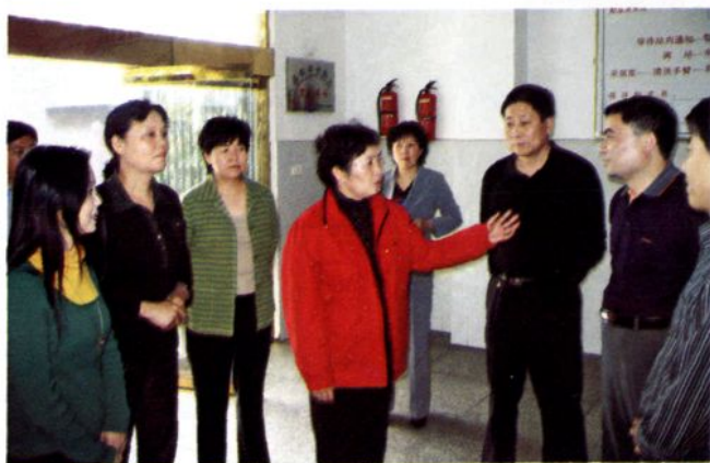
省政府副省长刘鸿庥视察晴隆县农村卫生工作