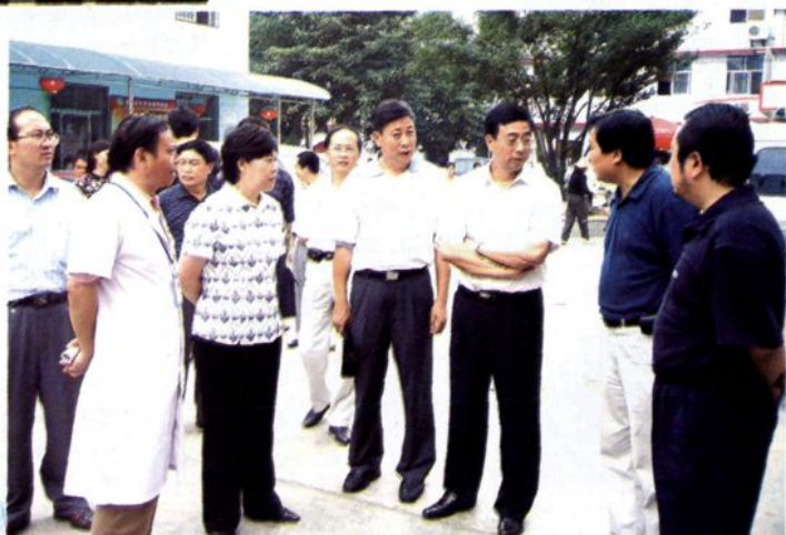
2007年8月22日,贵州省政协副主席李嘉琥到州人民医院视察工作。