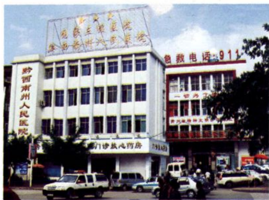
黔西南州人民医院