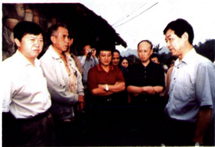
2004年9月7日,卫生部副部长王陇德到贞丰县视察农村计划免疫工作。