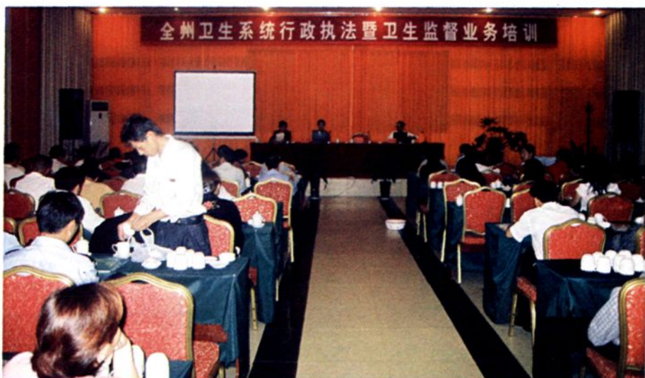
全州卫生系统行政执法暨卫生监督业务培训

为加强母婴保健专项技术的法制化、规范化管理,《母婴保健法》及“实施办法”实施以来,全州开展了多轮多次的母婴保健专项技术考核培训工作。图为2008年开展的全州母婴保健专项技术考核培训。