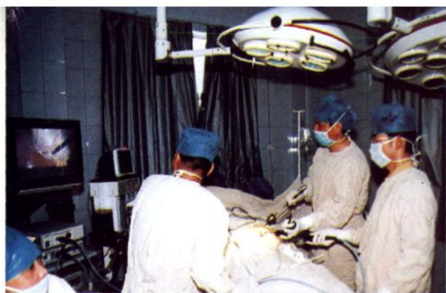
黔西南州医院开展电视腹腔镜手术