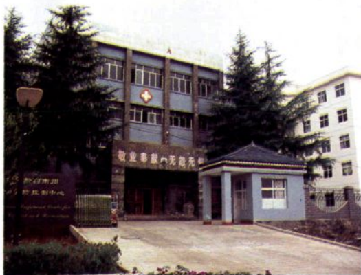
黔西南州疾病预防控制中心新办公大楼