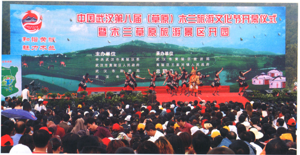
中国武汉第八届(草原)木兰旅游文化节开幕仪式暨木兰草原旅游景区开园仪式