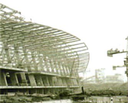
天河机场二期工程施工现场