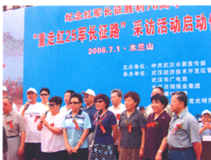
“重走红25军长征路”采访活动仪式开幕式