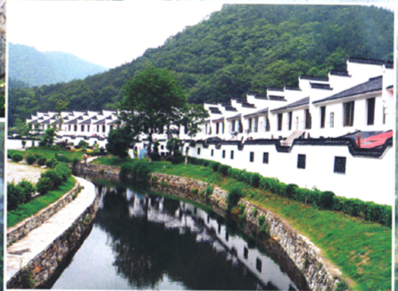
木兰天池农家乐山庄