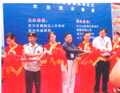
木兰武术表演开幕式