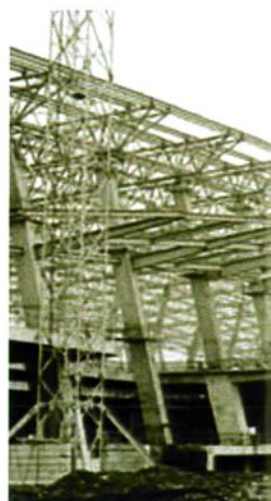
天河机场二期工程效果图