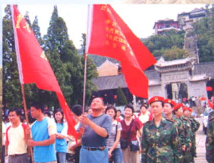
参加“重走红25军长征路”采访活动队员