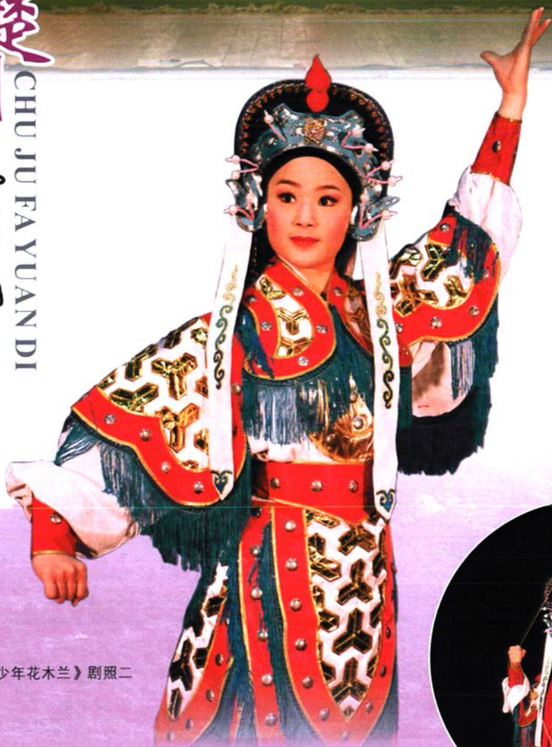
《少年花木兰》剧照二