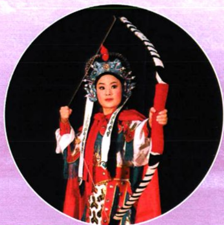
《少年花木兰》剧照三