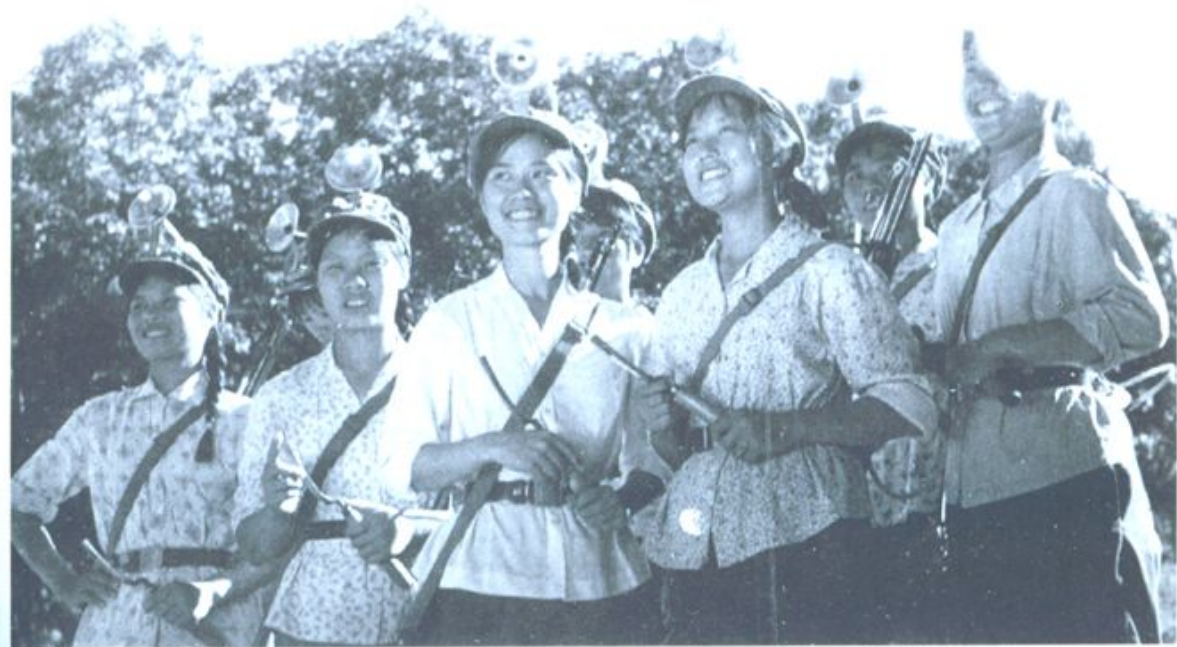
▲1968年,广州知青在兵团四师十二团九连。