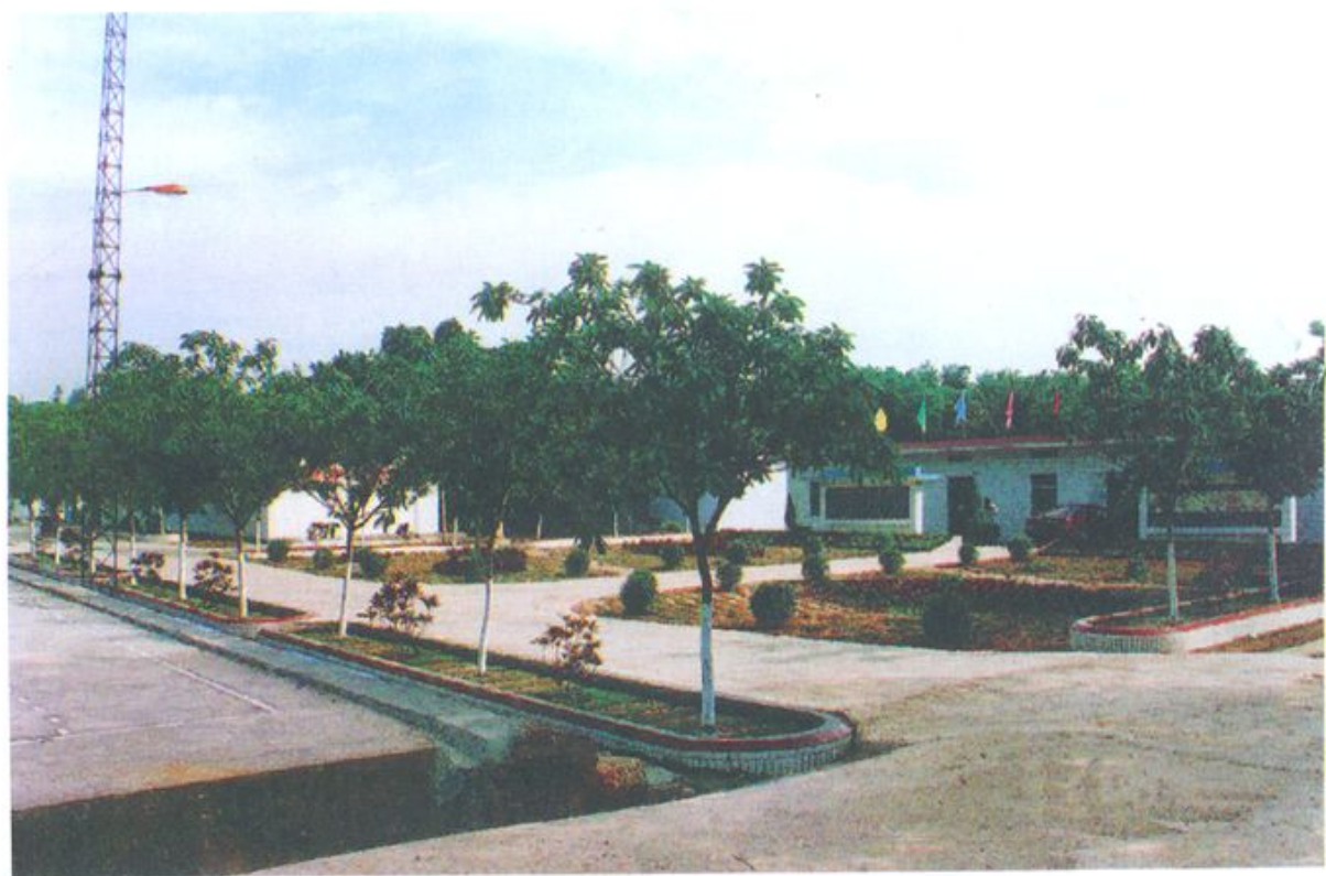
▲整洁优美的三队文明点