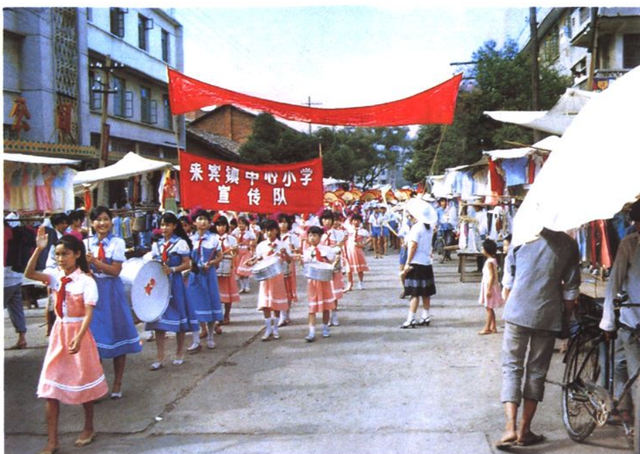
1990年全縣中小學大力宣傳《中華人民共和國義務教育法》。圖為來賓鎮中心小學宣傳隊正在街上宣傳義務教育法的現實意義。