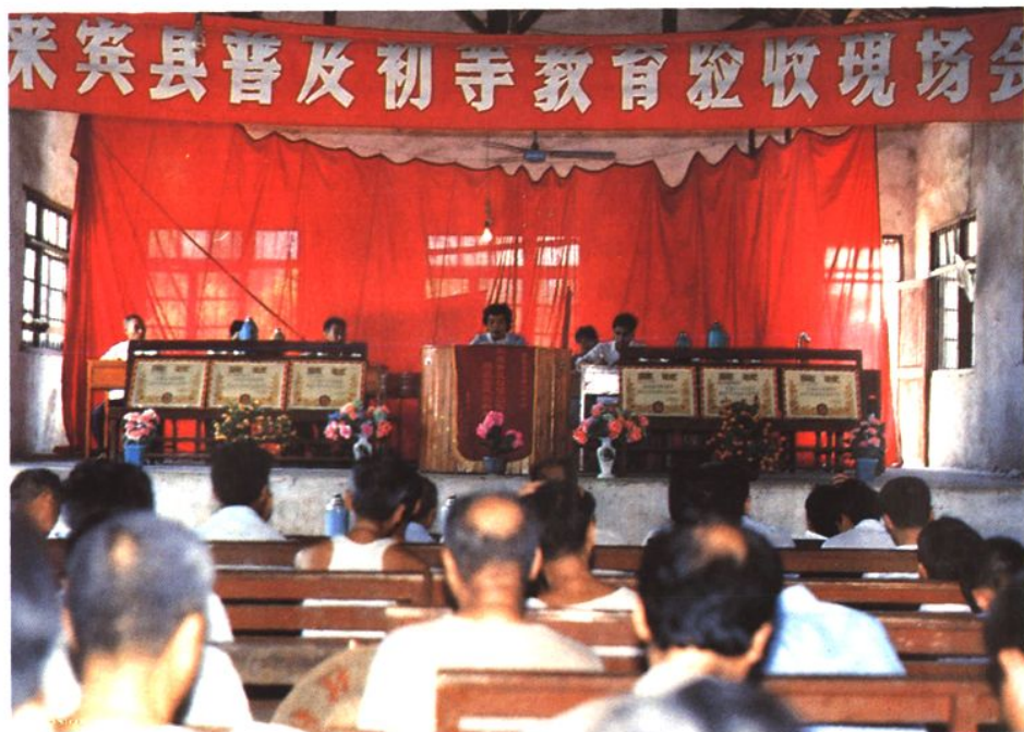
來賓縣普及初等教育首批驗收現場會于1987年6月在來賓鎮召開。