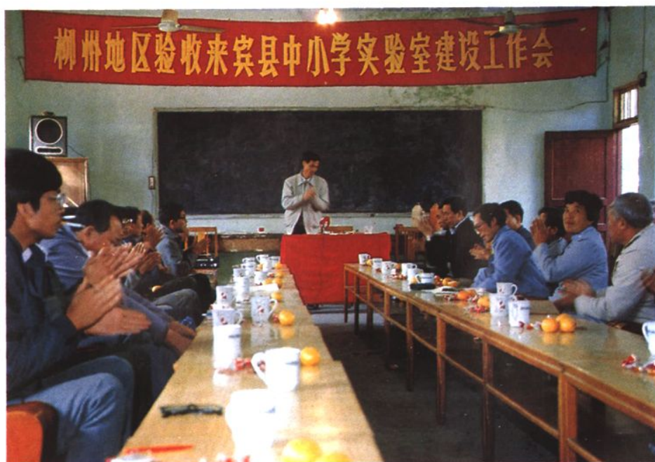
1990年來賓縣中小學實驗室建設通過地區驗收合格。圖為總結會會場。