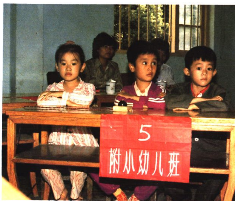
1987 年縣教育局舉辦幼兒智力競賽。圖為縣師範附小（今縣實驗小學）學前班代表參加競賽的鏡頭。