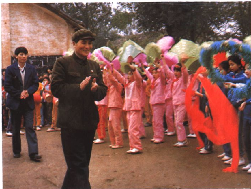
全軍英模、全國社會主義精神文明建設標兵、全國優秀校外輔導員王遐方同志于 1987 年到我縣作報告。圖為縣師範附小(今實驗小學) 師生夾道歡迎王遐芳同志。