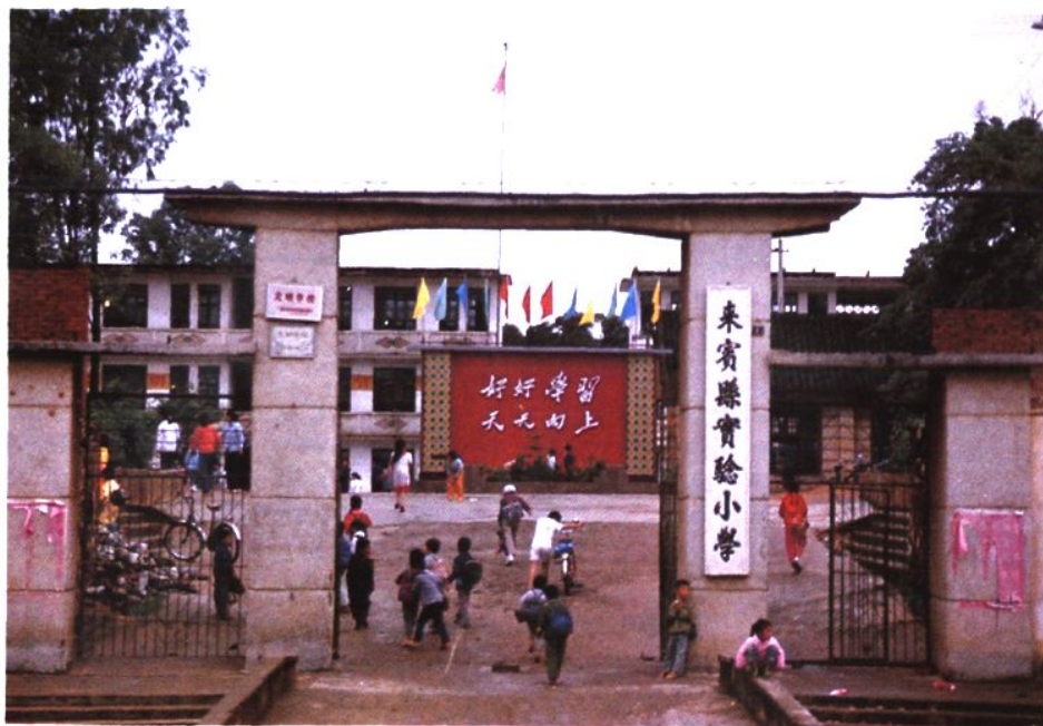
擁有 3000 多學生的縣實驗小學校園一角。