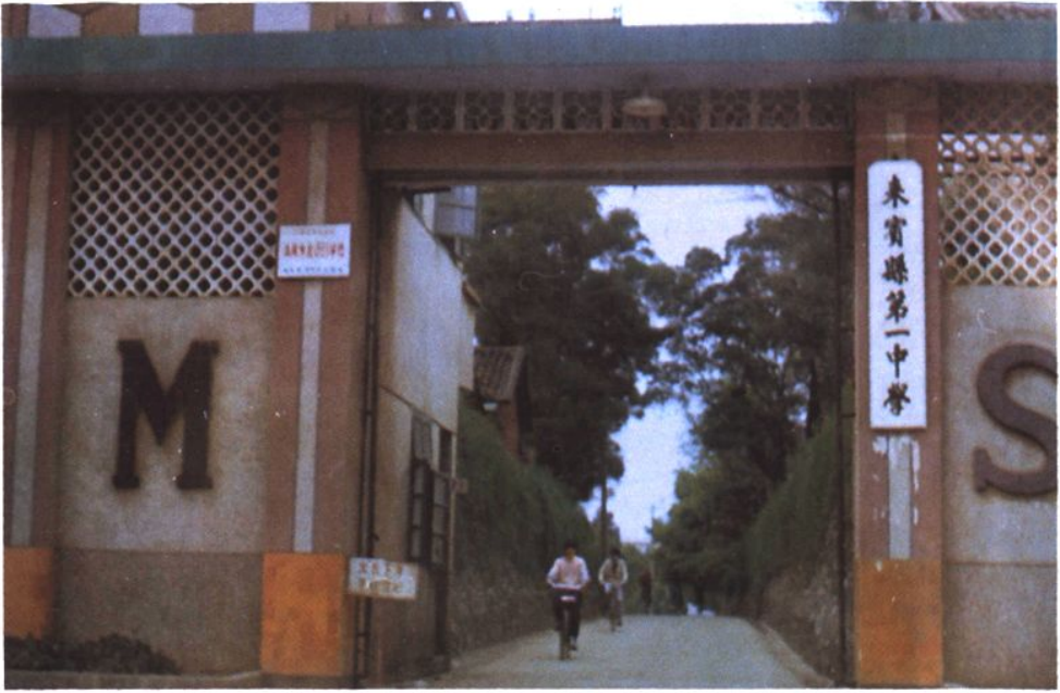
環境幽靜的來賓縣第一中學。