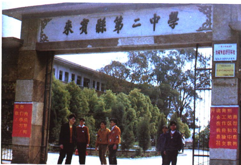
園林式的來賓縣第二中學。