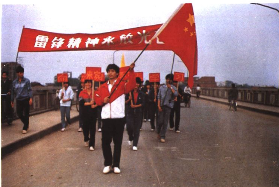
雷鋒精神永放光芒。圖為縣職業技術中學的學生上街為群眾做好事。