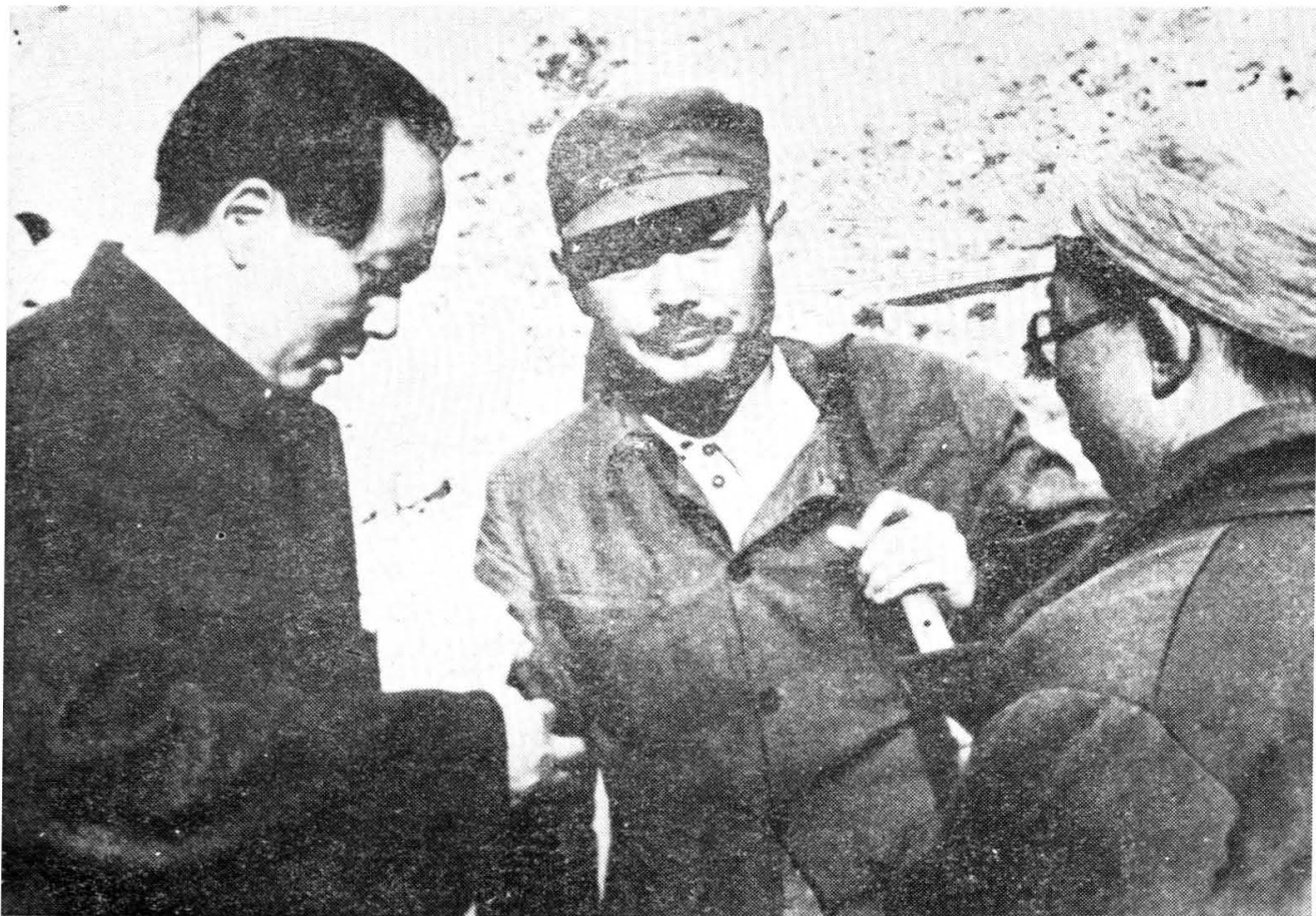
毛主席、叶剑英、陆定一在延安(1945年)。