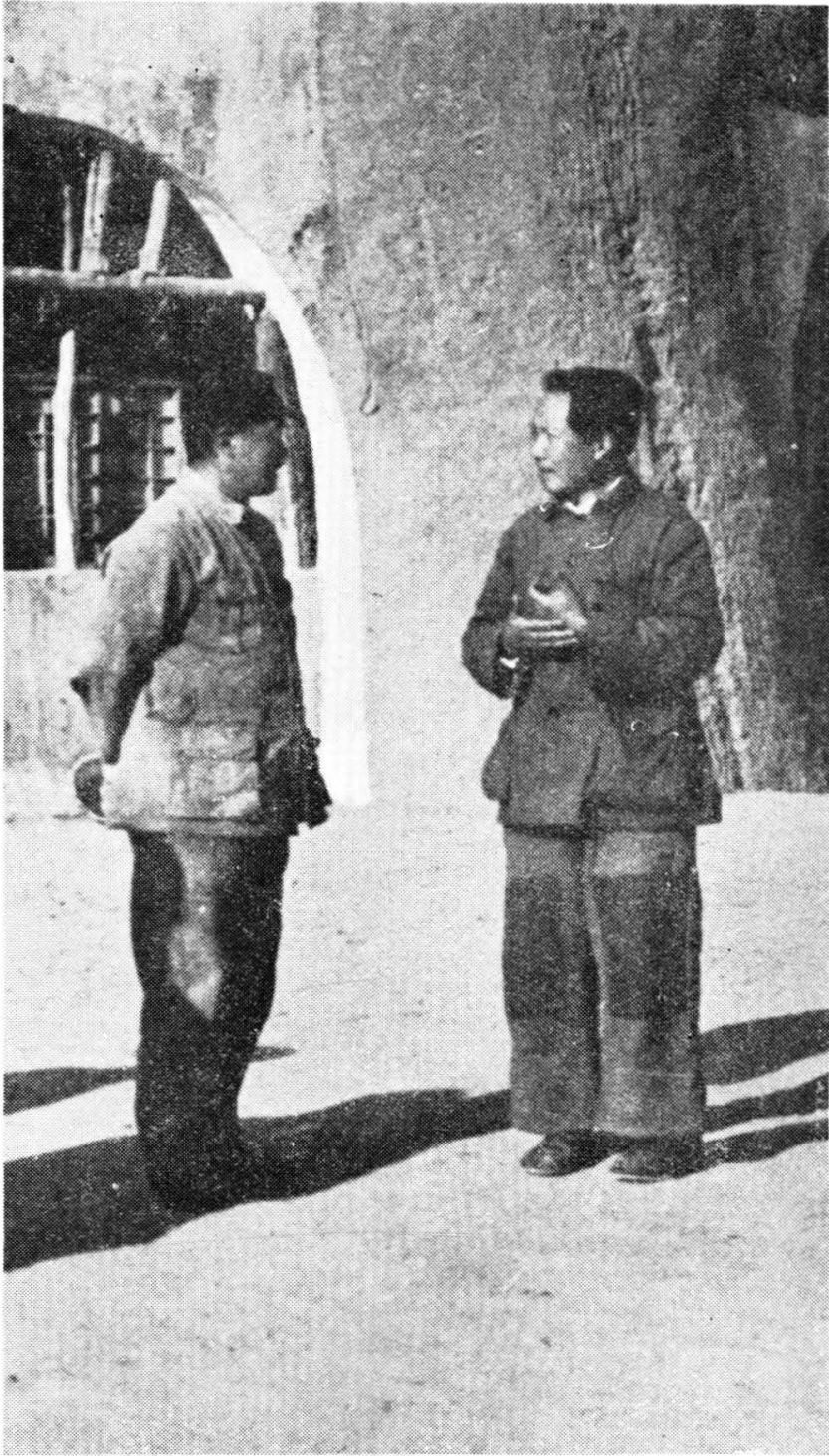
毛主席和贺龙在延安(1942年)。