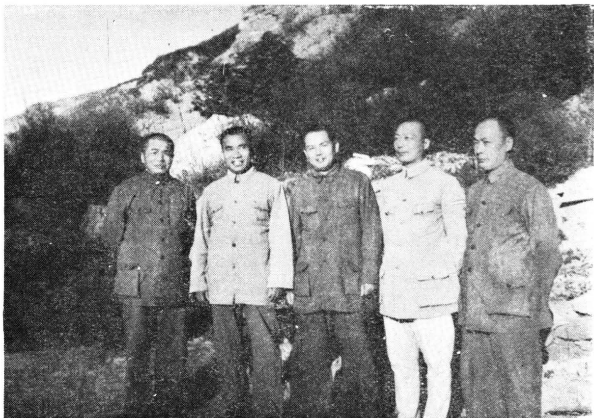
(从左至右)彭德怀、朱德、叶剑英、聂荣臻、陈毅在延安 (1945年)。