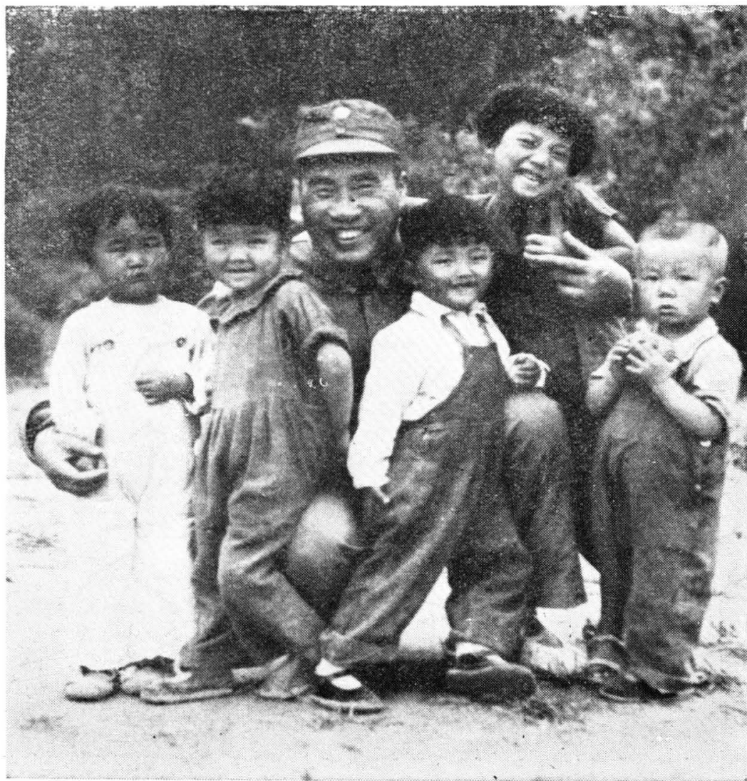
朱德总司令在延安王家坪和孩子们在一起(1944年)。