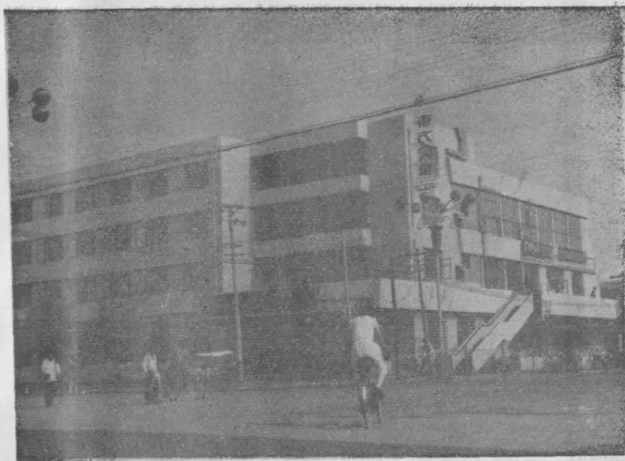
集贤县医药管理局综合服务、办公大楼外景