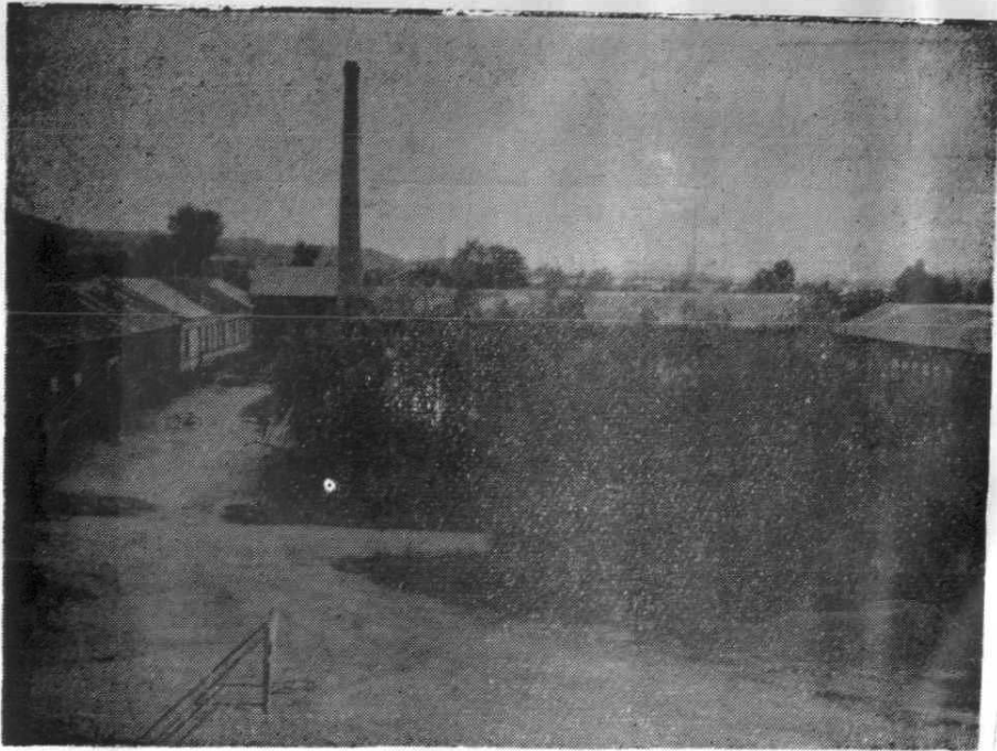
1985年集贤县医药药材公司院景