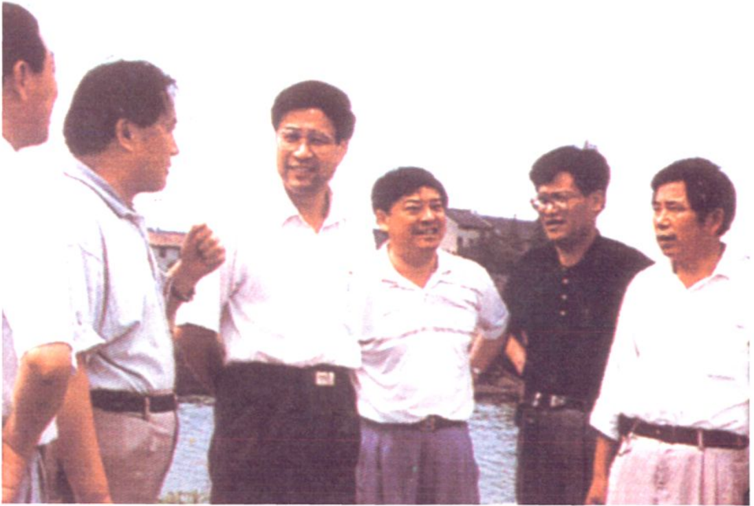
1997年，上海市副市长冯国勤（左三）视察新场镇农业生产。