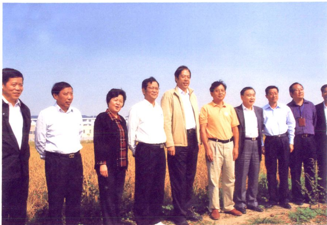
2009年，中共上海市委常委、上海市政法委书记吴志明（左五）视察南汇农业基地。