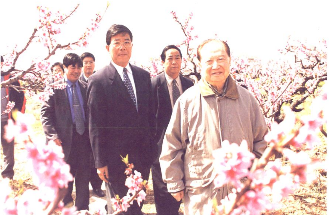
2001年3月20日，原上海市市长汪道涵（右一）视察芦潮港果园，中共南汇县委书记白文华陪同。