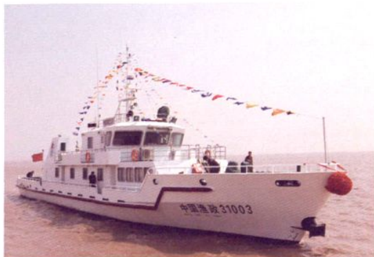
渔政 31003 号船