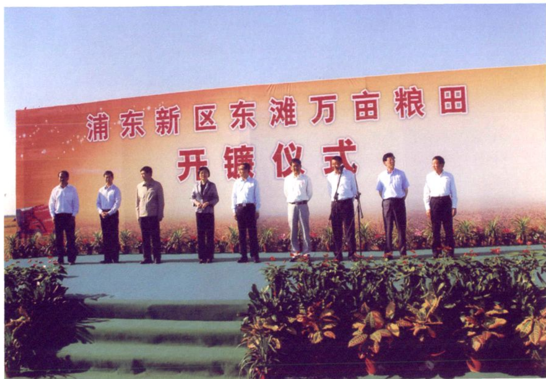
2009年10月15日，浦东新区东滩万亩粮田举行开镰仪式。