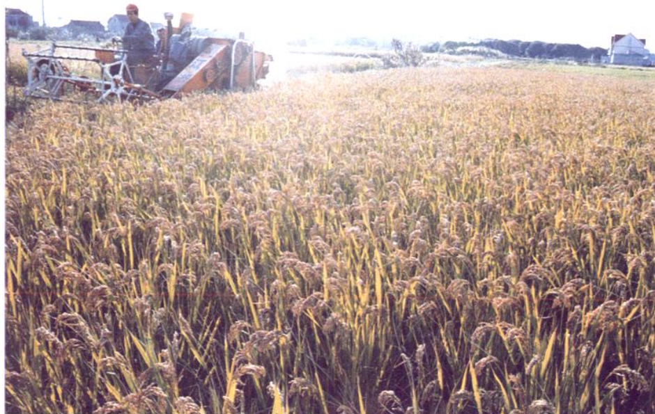
南汇优质水稻开镰收割