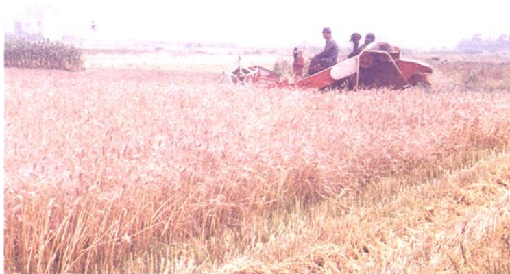
南汇传统小麦收割