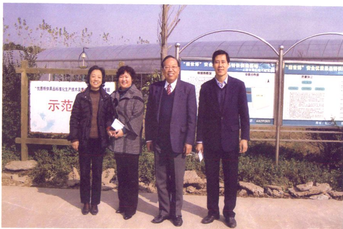
2009年11月25日，原上海市政协主席蒋以任（左三）视察南汇桃子研究所。