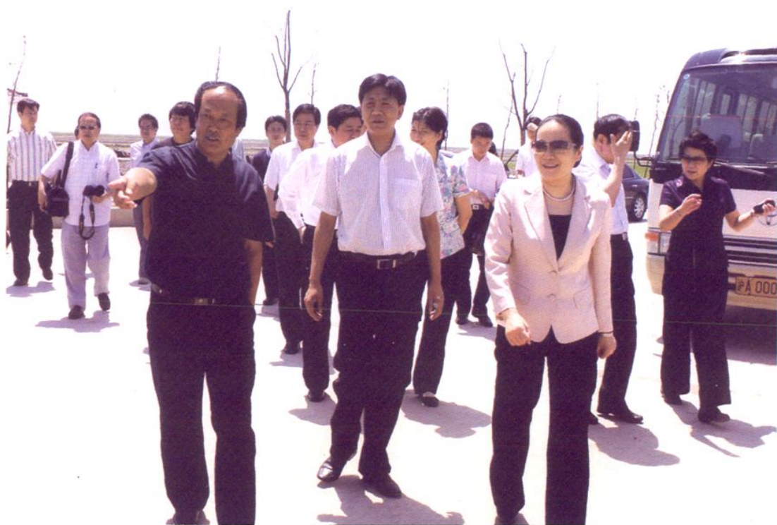
2009年6月25日，上海市副市长赵雯（右三）视察南汇东滩农业。