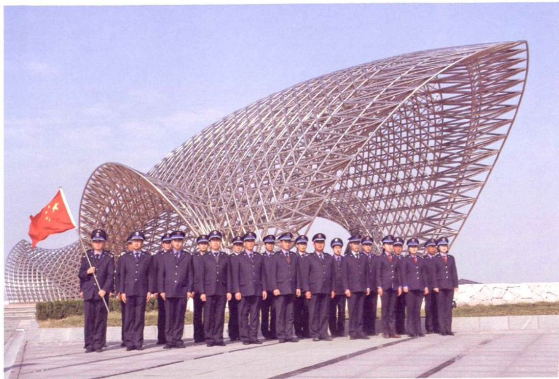
渔政执法队伍整装待发