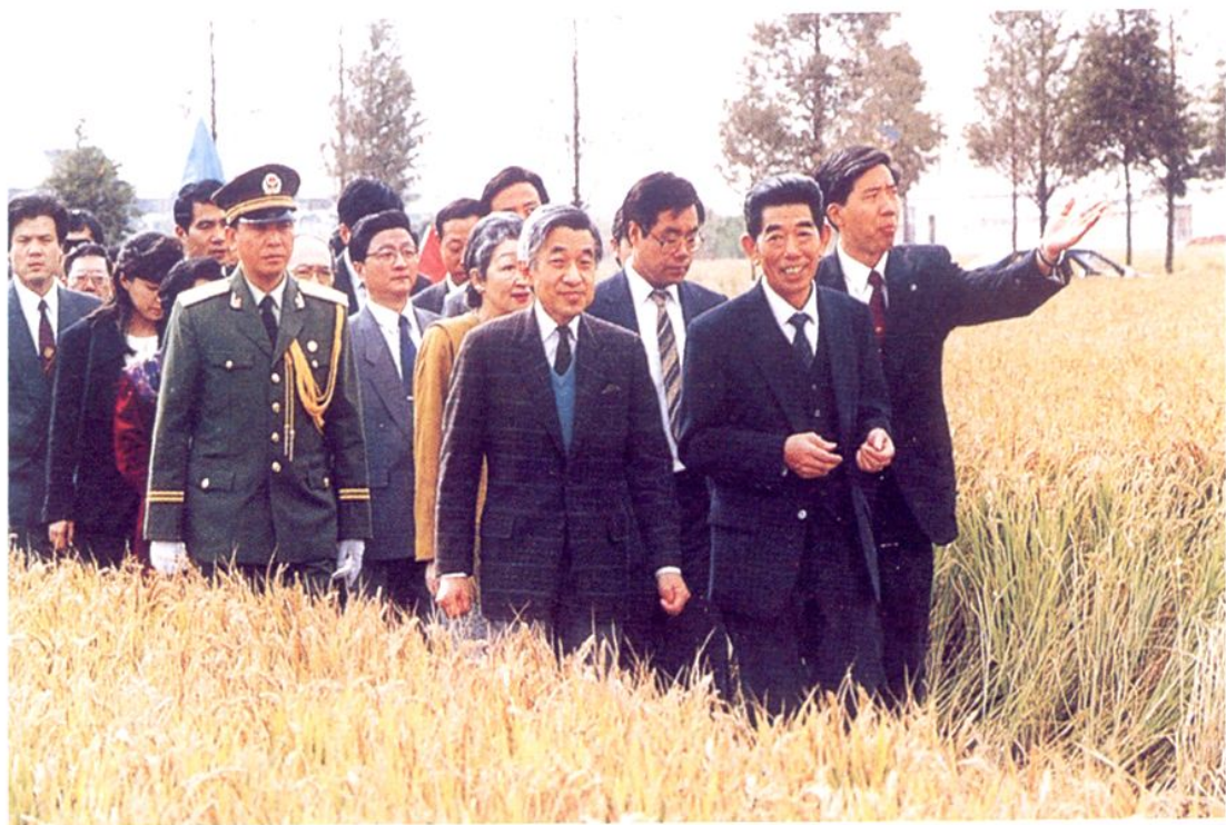
1992年11月28日，日本天皇明仁（前左一）参观周浦乡。