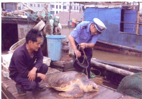
渔政人员救助野生动物——红海龟