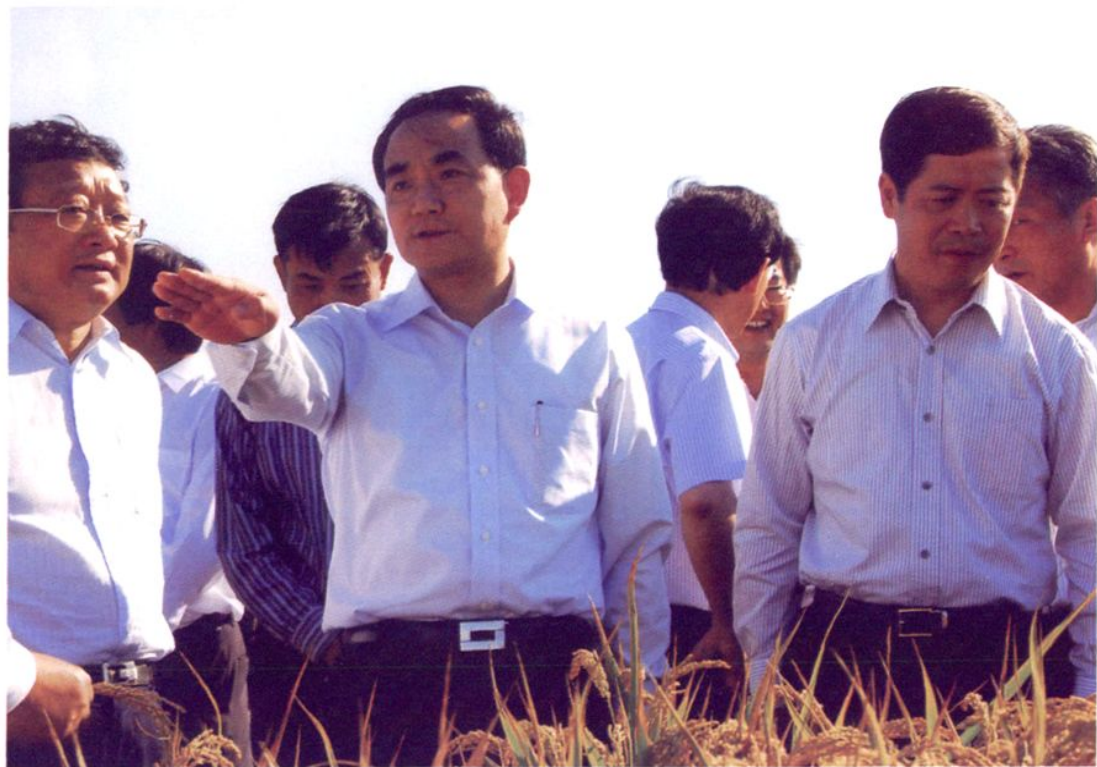
2009年，中共上海市委常委、浦东新区区委书记徐麟（左三）视察南汇农业。