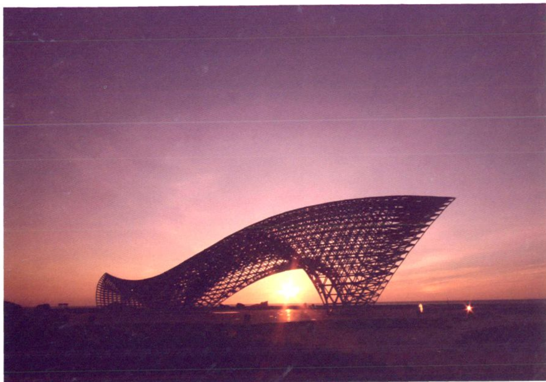
南汇嘴观海公园司南鱼雕塑