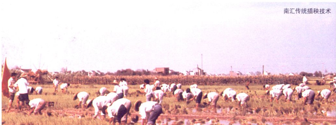
南汇传统插秧技术