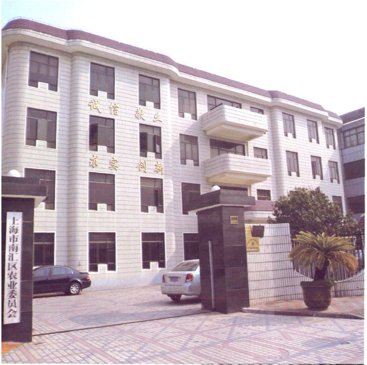
上海市南汇区农业委员会办公楼