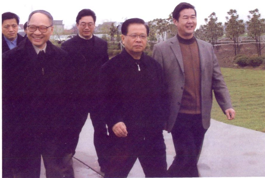
2004年3月25日，上海市人大常委会主任龚学平（左四）视察祥欣畜禽有限公司。