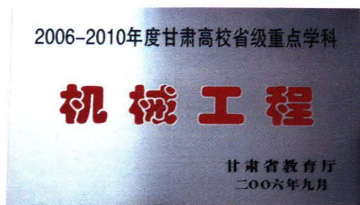
机械工程为省级重点学科