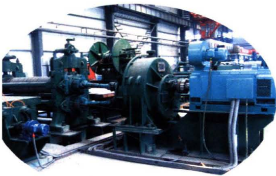
学院教师设计的螺旋焊管生产线