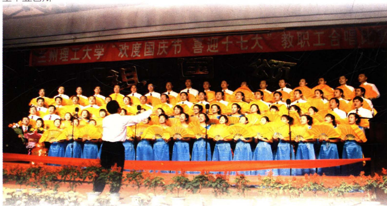
2007年9月，学院教师参加学校歌咏比赛