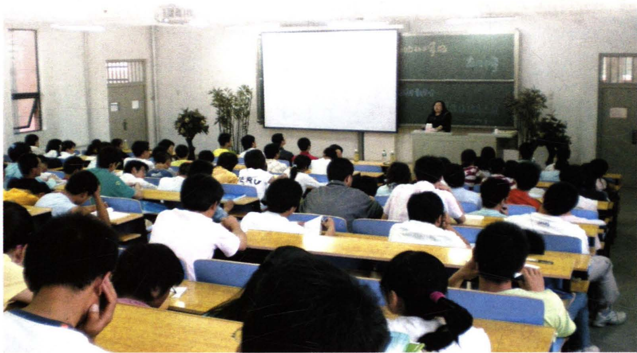
学院开展示范教学活动