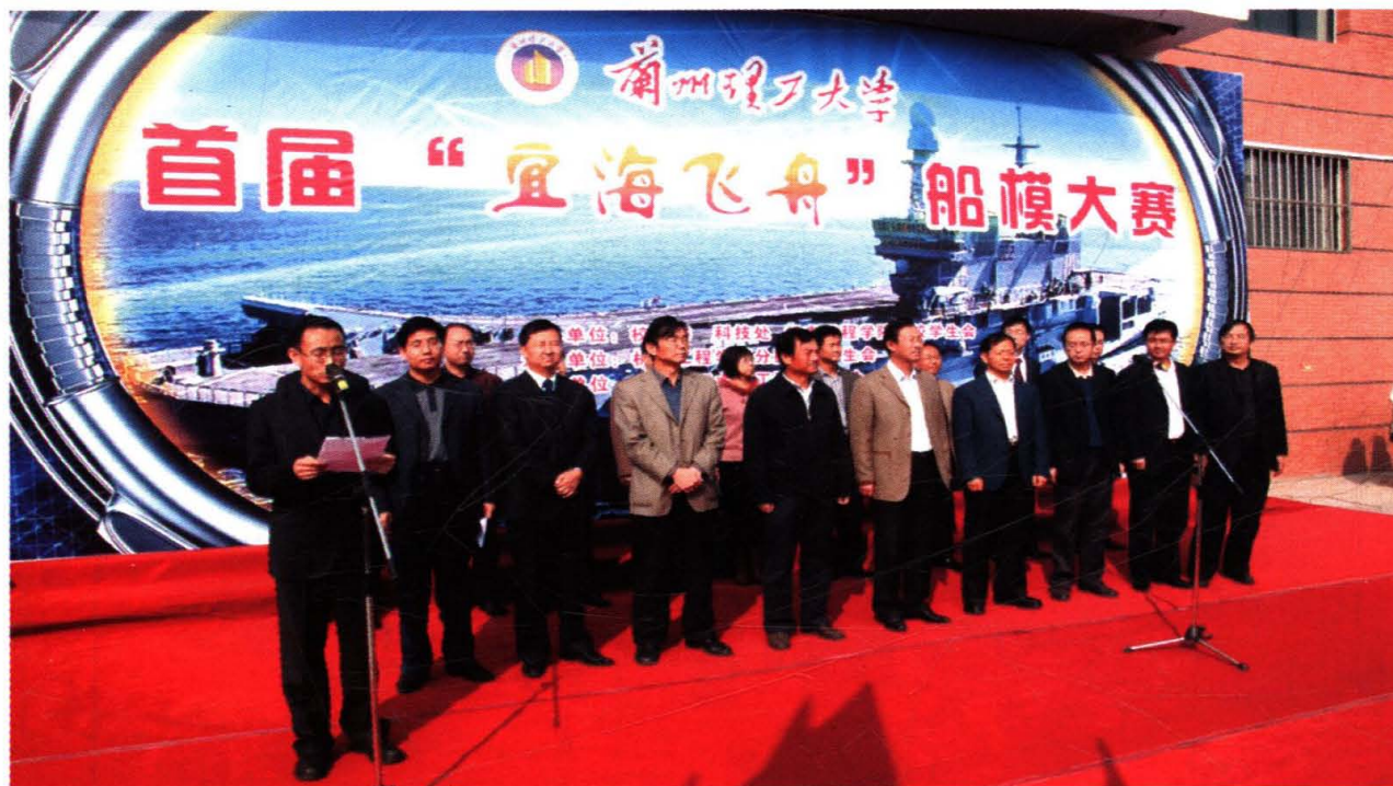
学校举办的“宜海飞舟”航模大赛