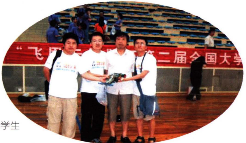
学院学生获得全国大学生 智能汽车竞赛二等奖