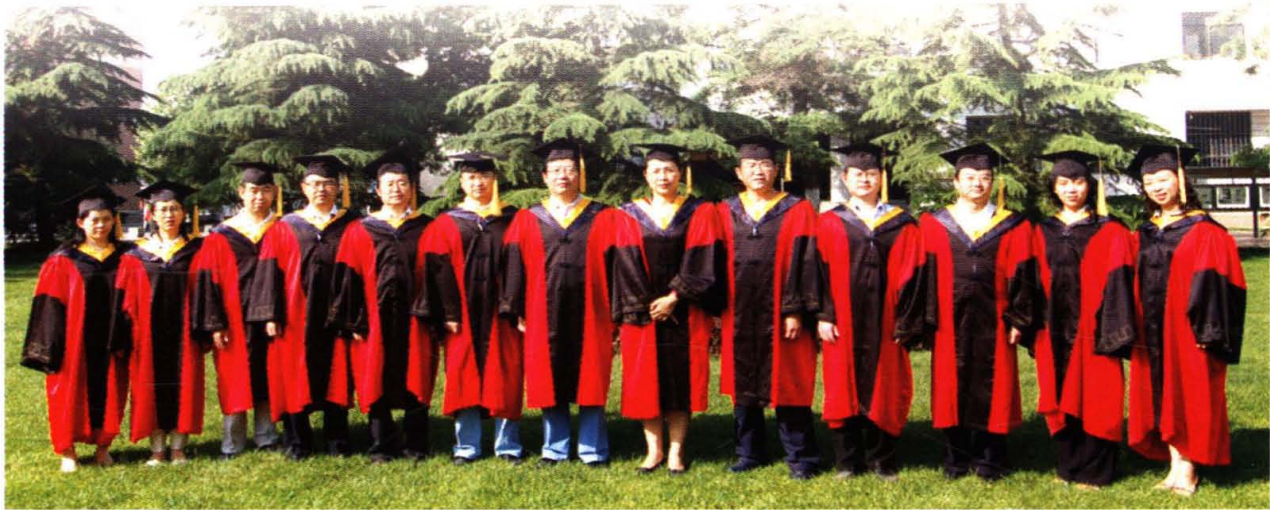
2009年6月，学院部分硕士生导师合影