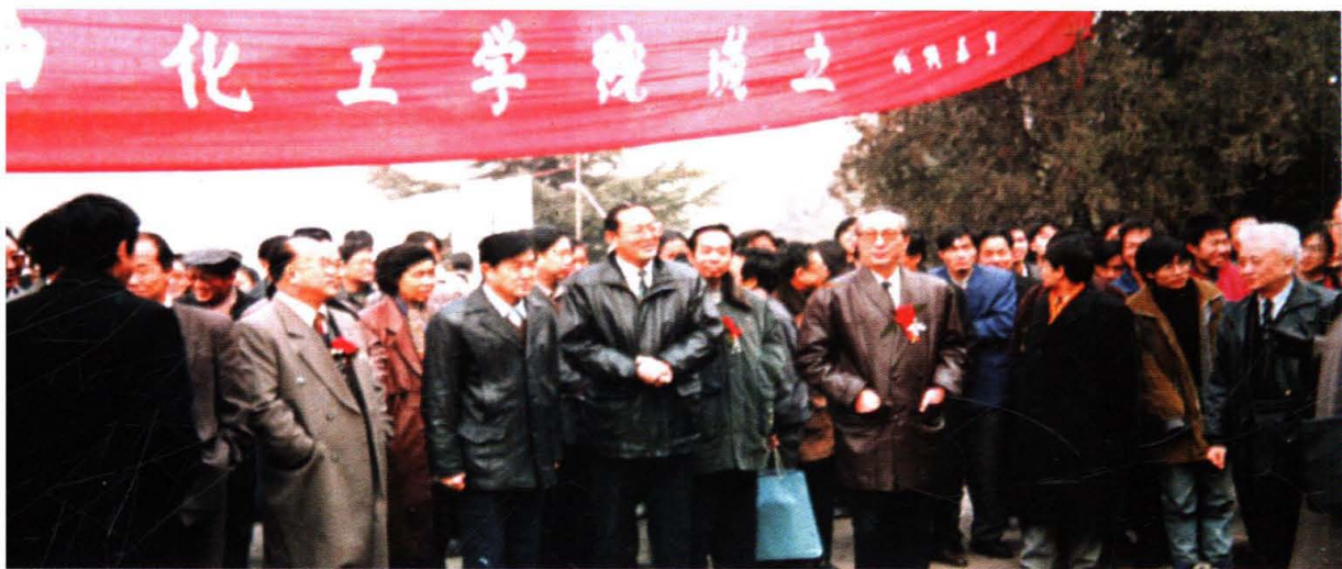
1996年4月，学院成立大会