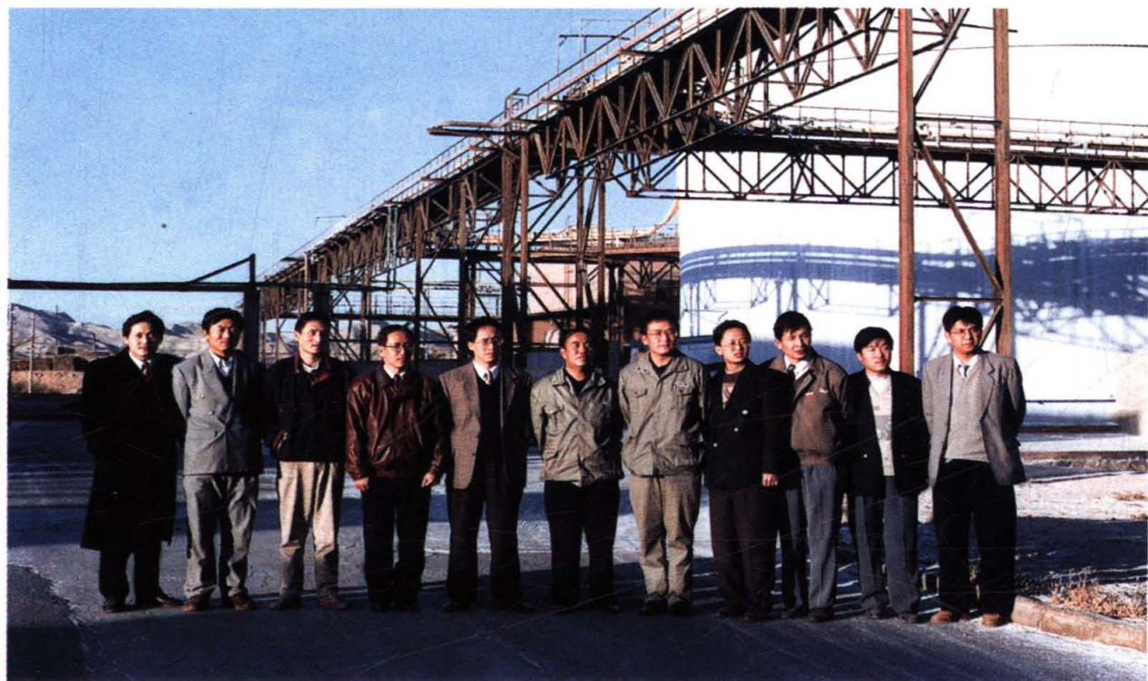
氧化铝储运项目现场