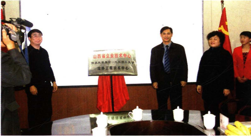
山西阳泉机械集团-兰州理工大学流体工程技术中心揭牌仪式