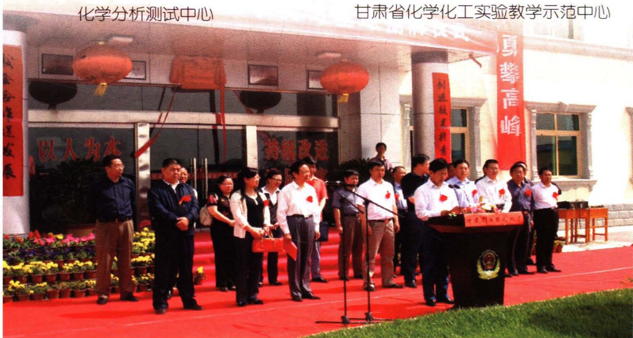
学院在甘肃省白银风机厂举行教学实习基地揭牌仪式