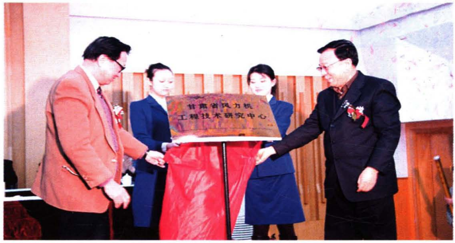
甘肃省风力机工程技术研究中心揭牌仪式