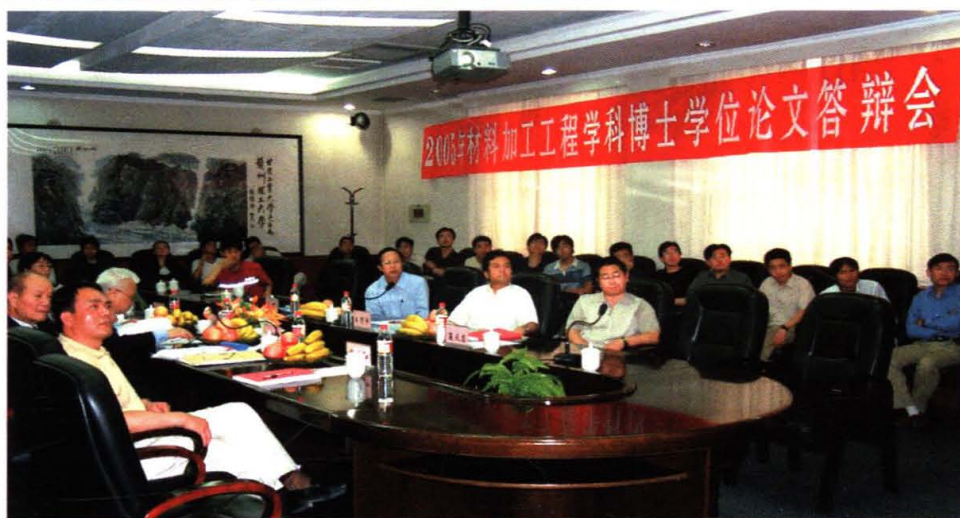
学院举行材料 加工工程学科博士 学位论文答辩会