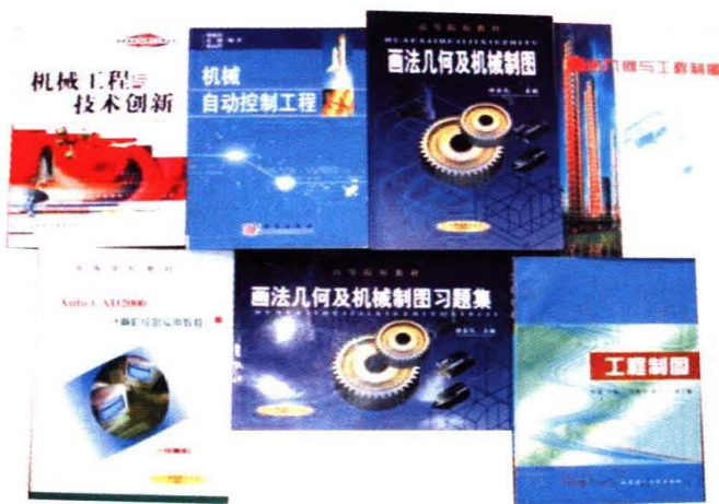
学院部分专著及教材