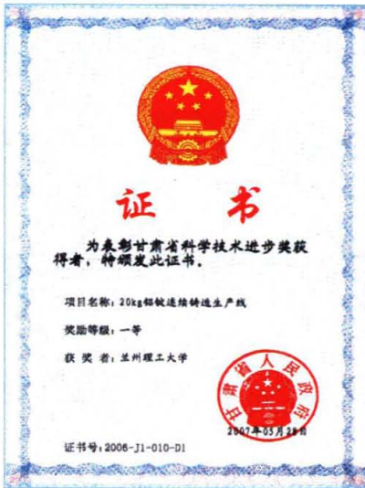
20kg 铝锭连续铸造生 产线项目获得甘肃省科技进 步一等奖