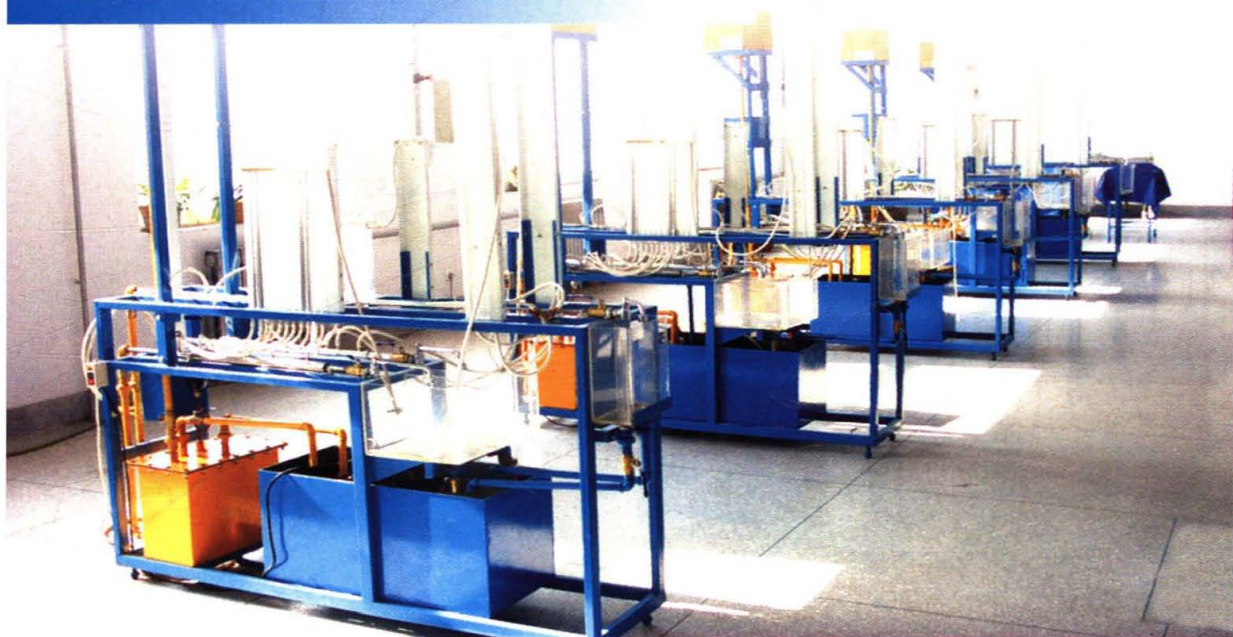
流体力学实验室实验仪器