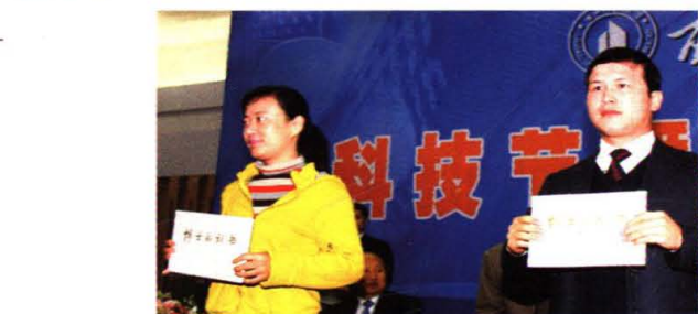
学校首批博士后出站