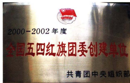
学院分团委被授予五四红旗团委创建单位