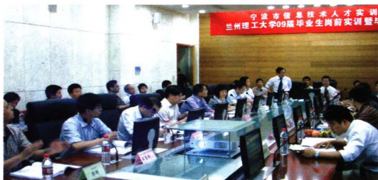
2009年5月，学院与宁波就业基地联合举行学生毕业答辩