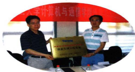
2009年5月，学院与达内科技(中国)有限公司签订就业基地合作协议