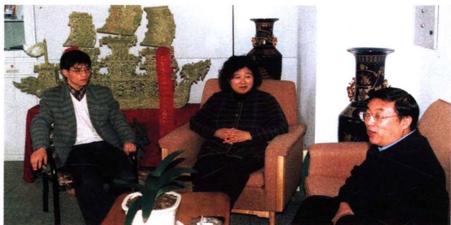
东北大学柴天佑 教授来学院访问交流