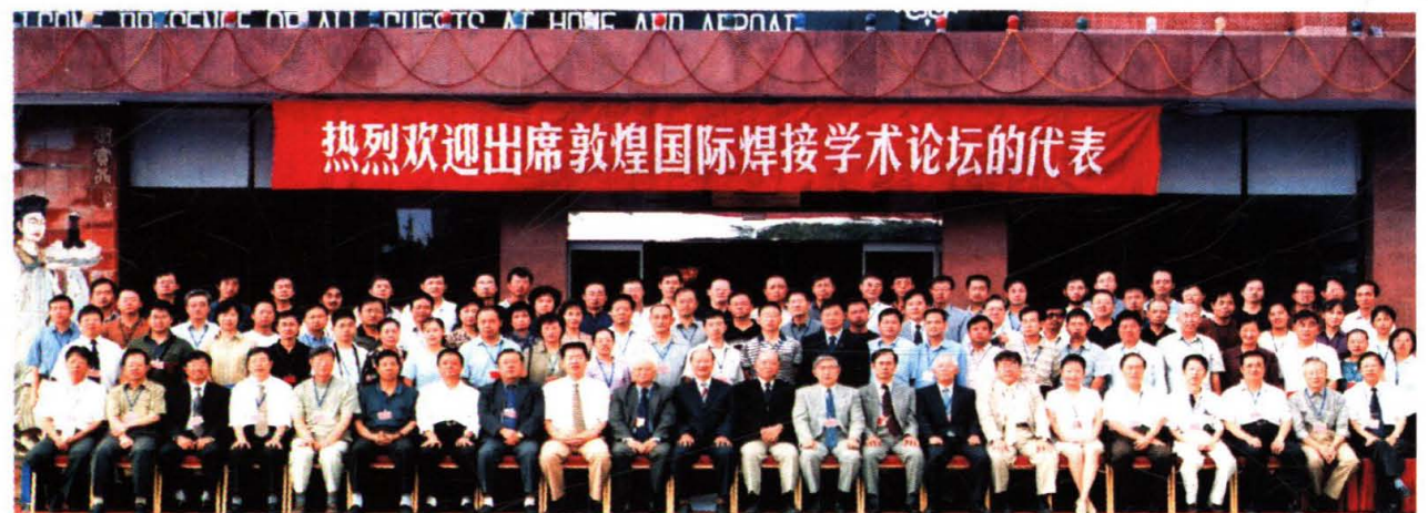
2004年8月，学院承办敦煌国际焊接学术会议