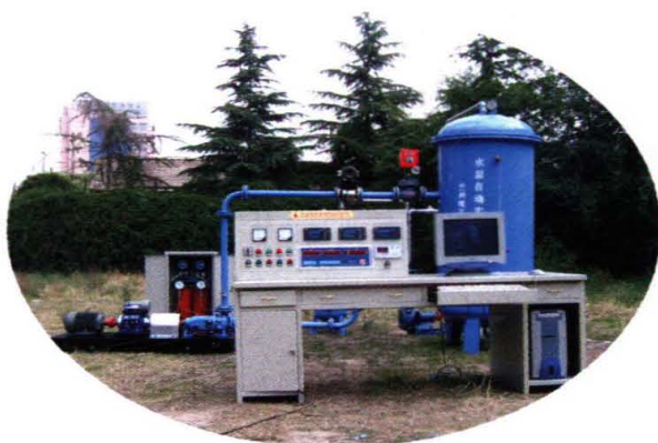
水泵综合测试系统