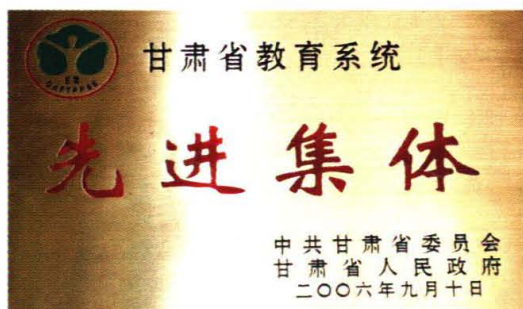
学院获得甘肃省教育系统先进集体