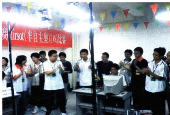
学院学生参加华煤杯全国大学生机器人竞赛