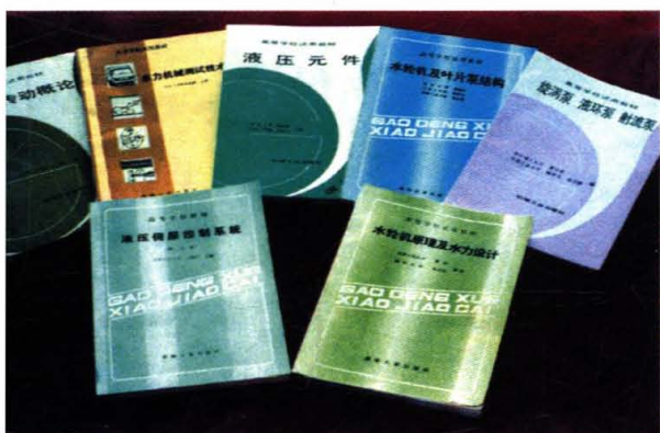
学院部分统编教材