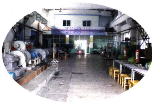
甘肃省化学化工实验教学示范中心