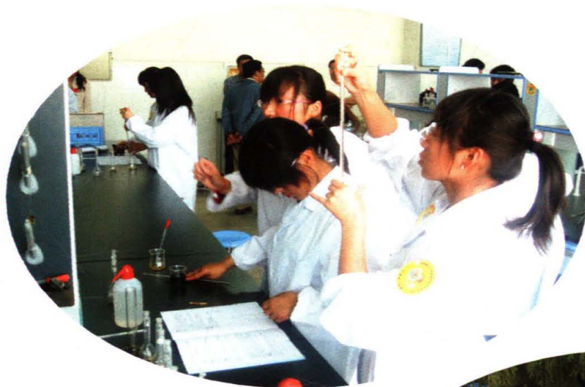
学院举办首届“绿色化学知识大赛”