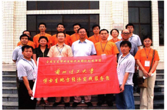
学院博士生地方经济实践服务团获得 全国社会实践优秀重点团队