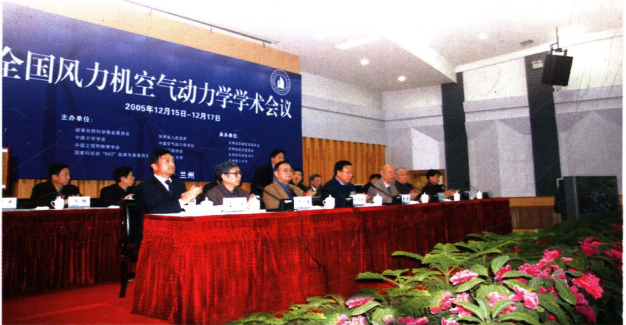
全国风力机空气动力学学术会议