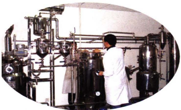
化学分析测试中心