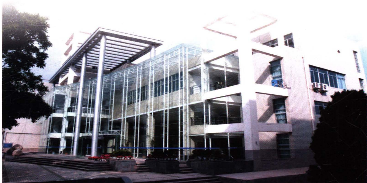
省部共建国家重点实验室培育基地—— 甘肃省有色金属新材料实验室