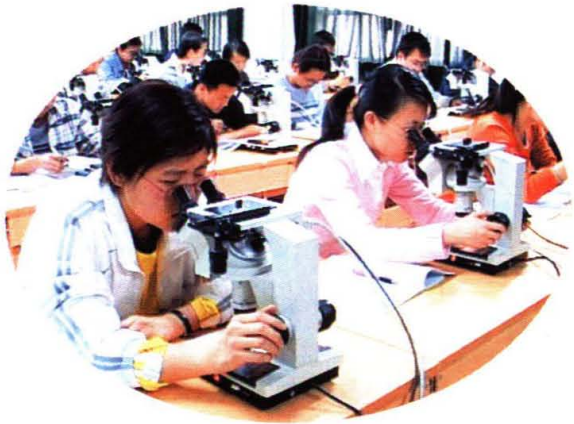
学生在金相实验室