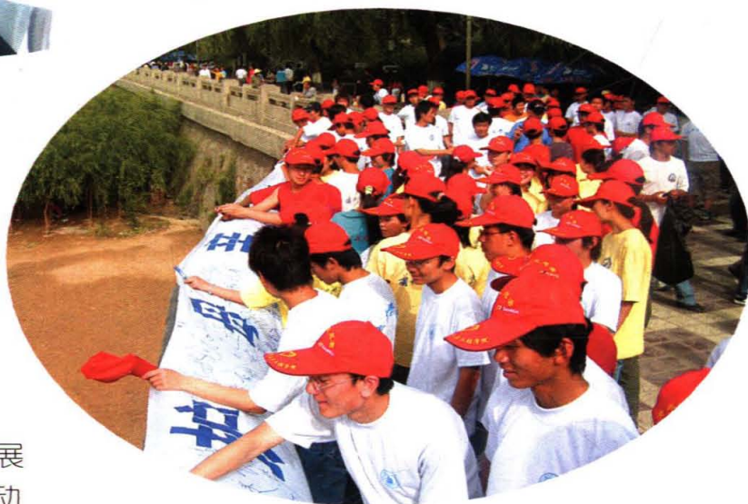
学院环保协会开展“保护母亲河”系列活动