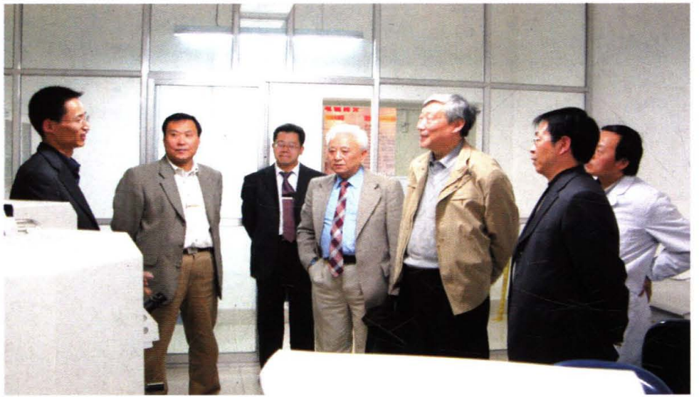
中国科学院陈国良院士来学院参观