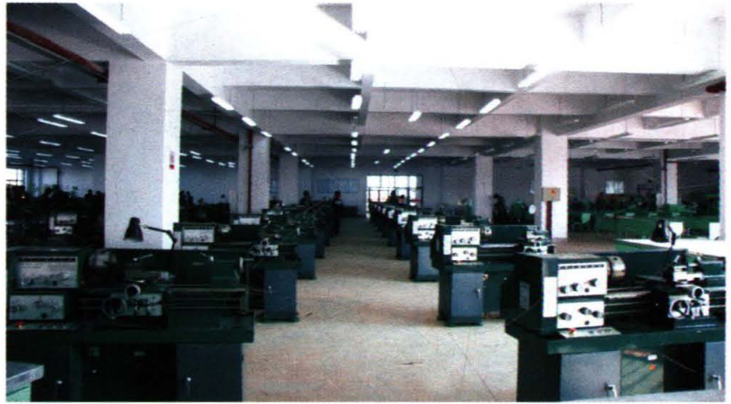
机械工程实践教学中心为教育部机械工程实验教学 示范中心