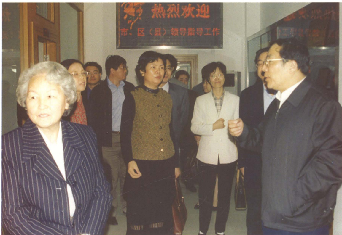
2003年10月13日，上海市副市长杨晓渡（右一）到南汇区红十字会视察工作。