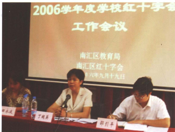
2006年9月19日，区红十字会与区教育局联合召开学校红十字会工作会议。