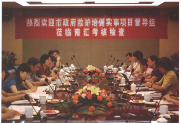
2008年9月9日，上海市救护培训实项目督导组到南汇检查。