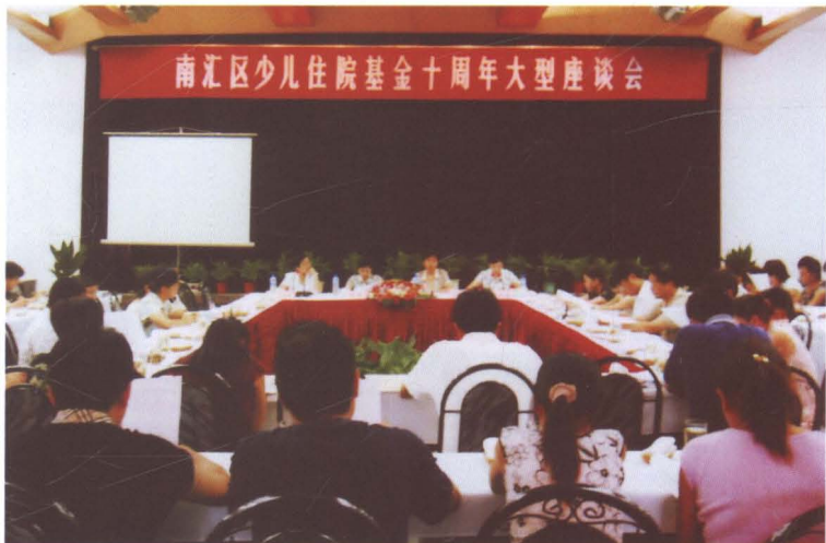
2006年8月，南汇区少儿住院基金10周年座谈会在南园宾馆召开。