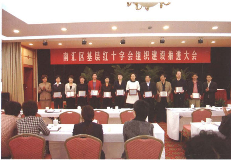
2008年4月23日，南汇区基层红十字会组织建设推进大会召开。