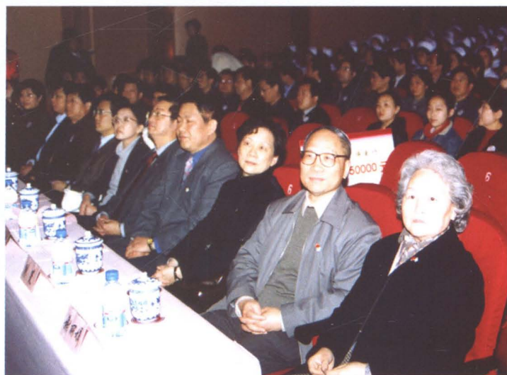
2004年3月31日，南汇区四套班子领导出席“庆百年、博爱行”庆祝中国红十字会100周年纪念大会。