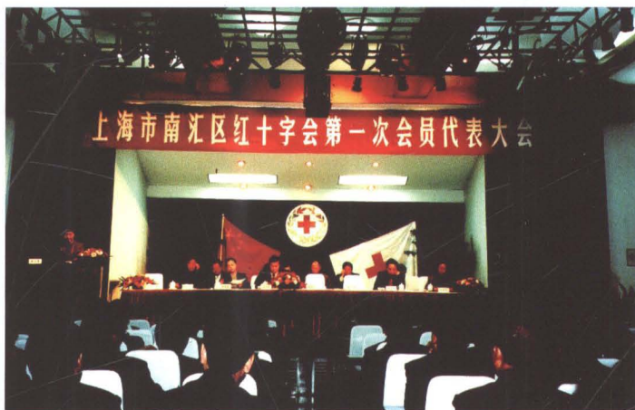
2002年3月13日，南汇区红十字会第一次会员代表大会召开。