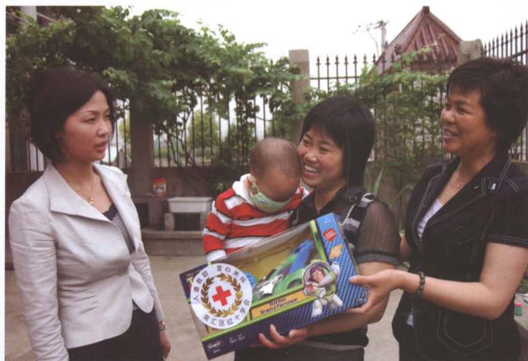
区、镇红十字会领导慰问白血病患儿。