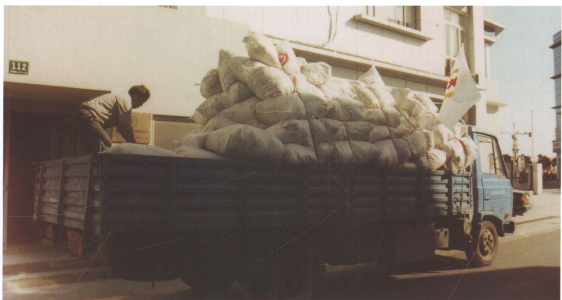
2008年6月12日，向四川汶川运送救援物资，物品价值275.53万元。