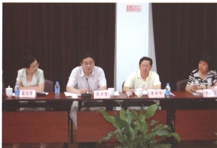
2008年8月14日，南汇区少儿基金管委会（扩大）会议召开。