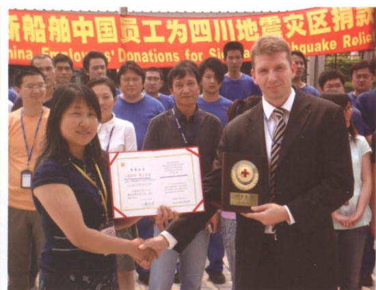
2005年5月20日，外资企业为5·12大地震灾区捐款。