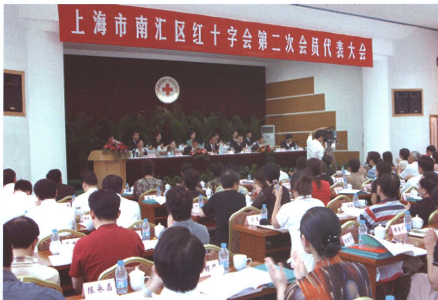
2007年5月30日，南汇区红十字会第二次会员代表大会召开。