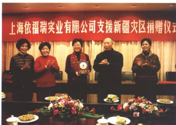
2003年3月1日，接受依福瑞公司捐赠。