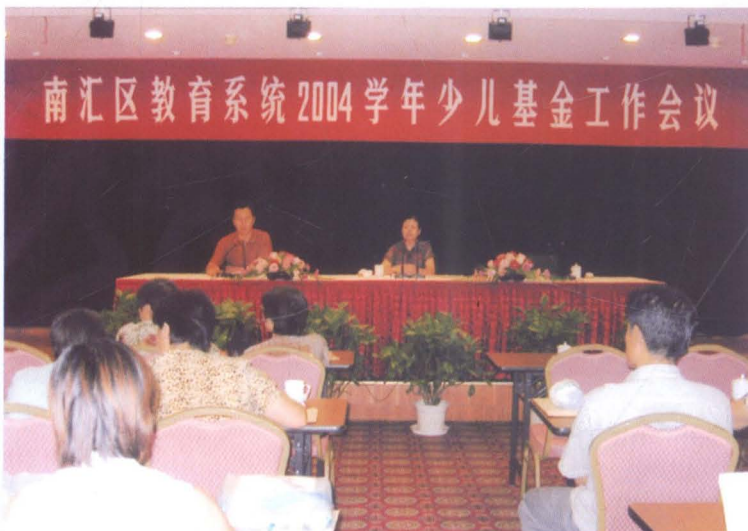
2004年8月27日，南汇区教育系统2004学年少儿住院基金工作会议召开。