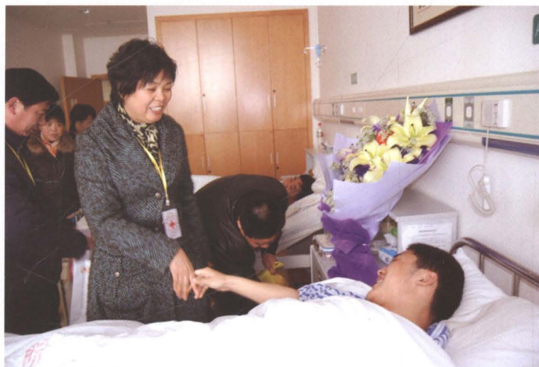
慰问患急病外来打工人员。