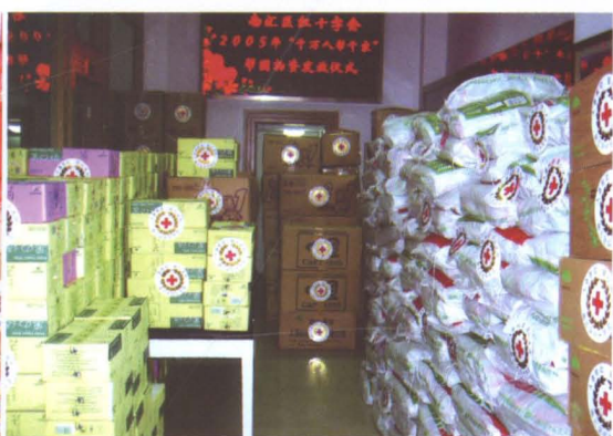
2005年1月15日，区红十字会进行“千万人帮千家”迎春帮困活动，向社区发放爱心物资。