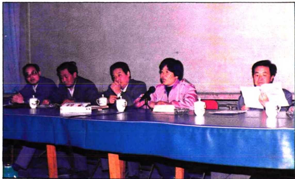
县领导出席计划生育工作会议。