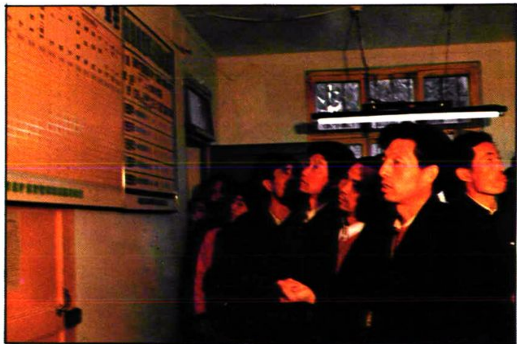
局组织乡镇领导和计生专干参观虢镇人口挂牌 管理。