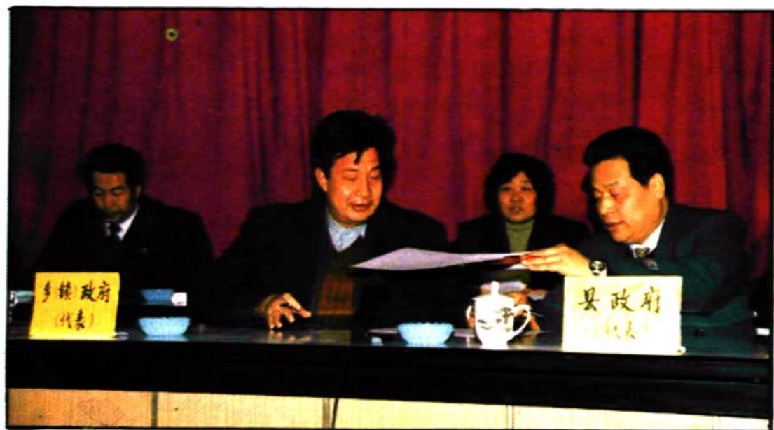
县、乡（镇）领导签订人口目标责任书。