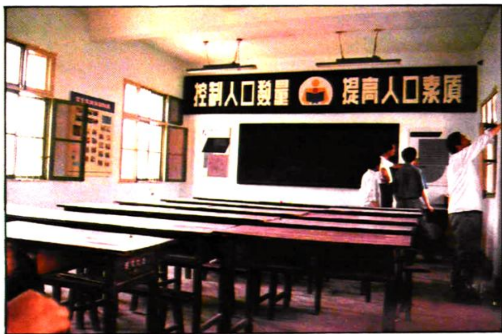
天王镇中心人口学校。