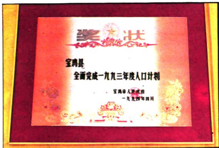
连续两年全面完成人口计划。