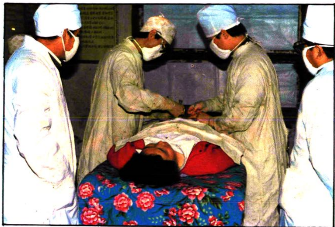
县、局领导查看节育手术情况。