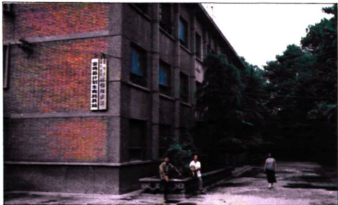
县计划生育宣传技术站综合门诊楼。