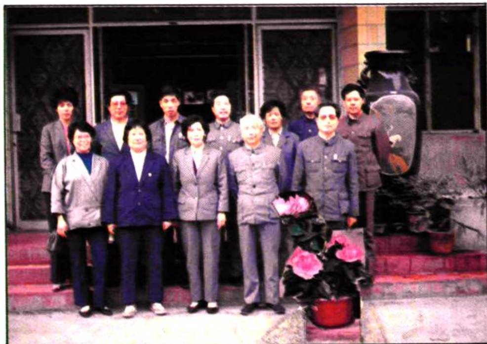
（前排中）国家计生委副主任吴景春 来县检查指导工作。