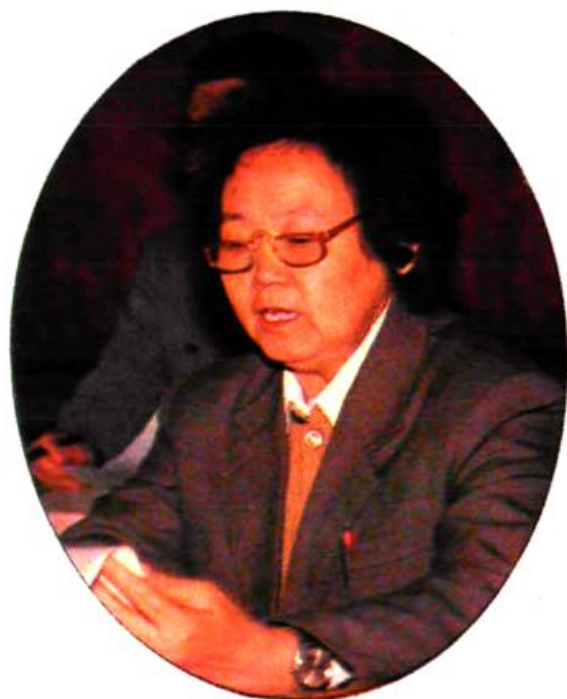
渭阳柴油机厂计生办介绍计划生育经验。