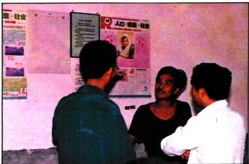
天王镇王家堡村中心户长。