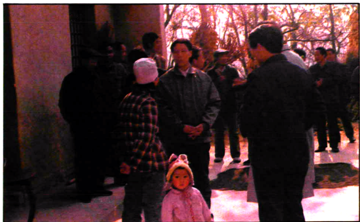
市、县领导深入西部山区看望慰问双女户。