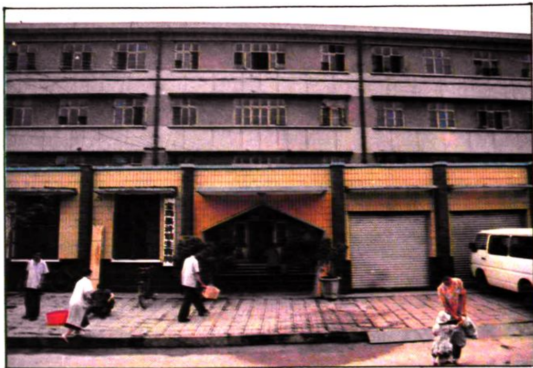
县计划生育局办公楼。