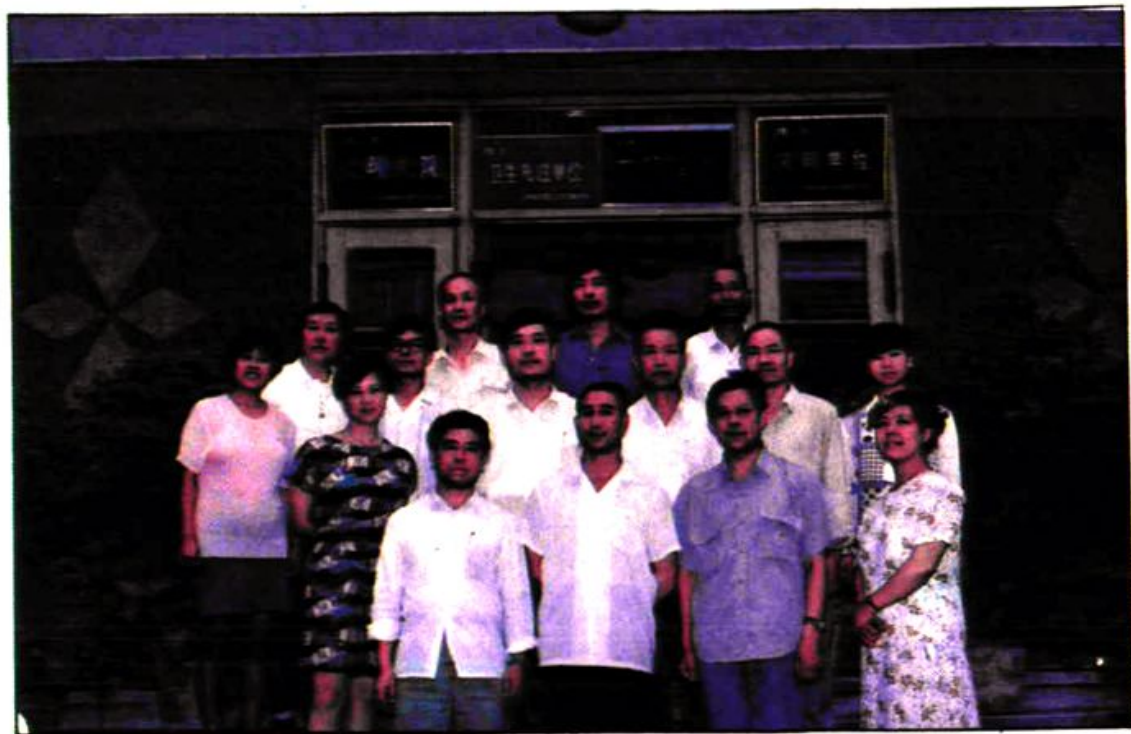
“光荣的使命” 县计划生育局全体工作人员。