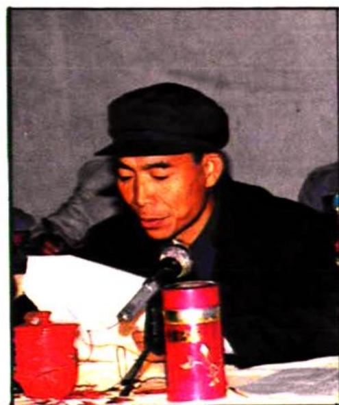
省级先进集体坪头镇领导介绍计生经验。