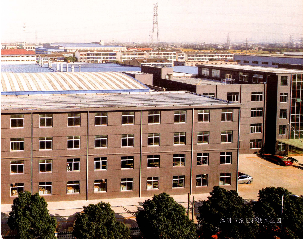
江阴市东盟科技工业园