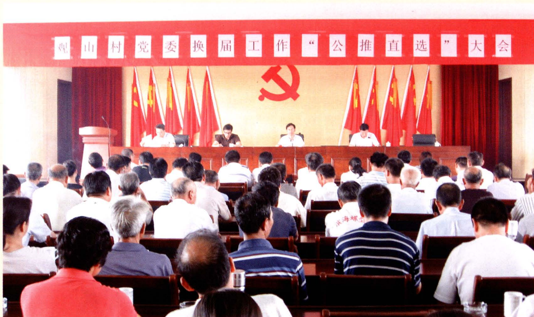
2008年6月,观山村党委换届工作“公推直选”大会