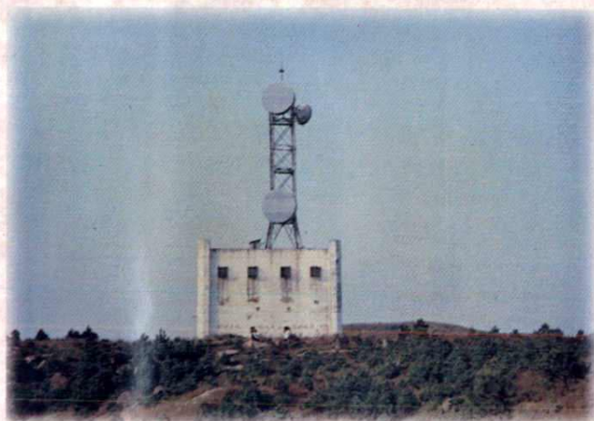
武山微波无人值守增音站