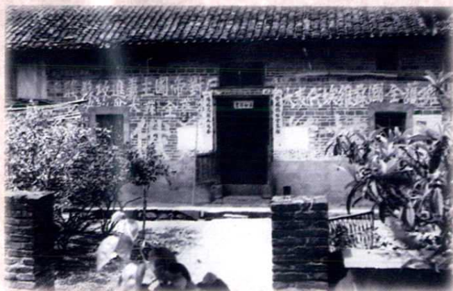
1930年苏维埃万(安)泰(和)邮政局旧址