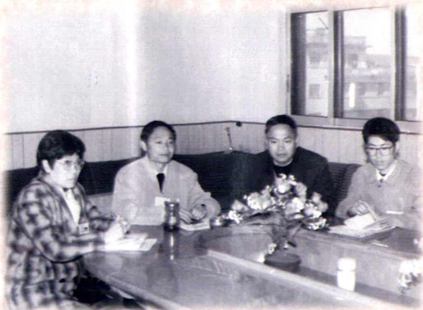
局领导班子正在研究工作