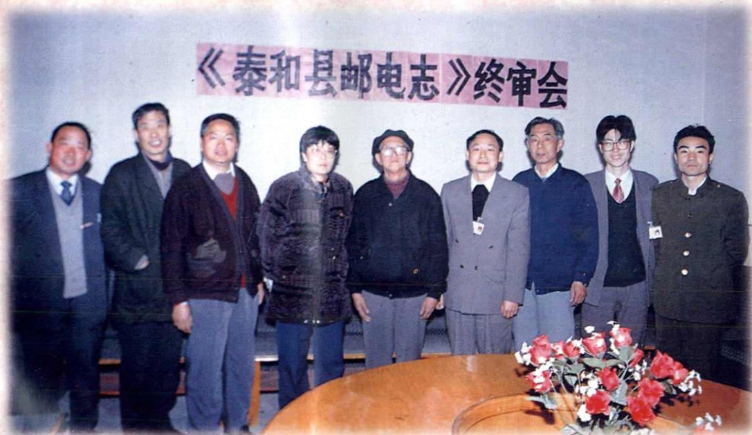
《泰和县邮电志》编纂领导小组成员合影