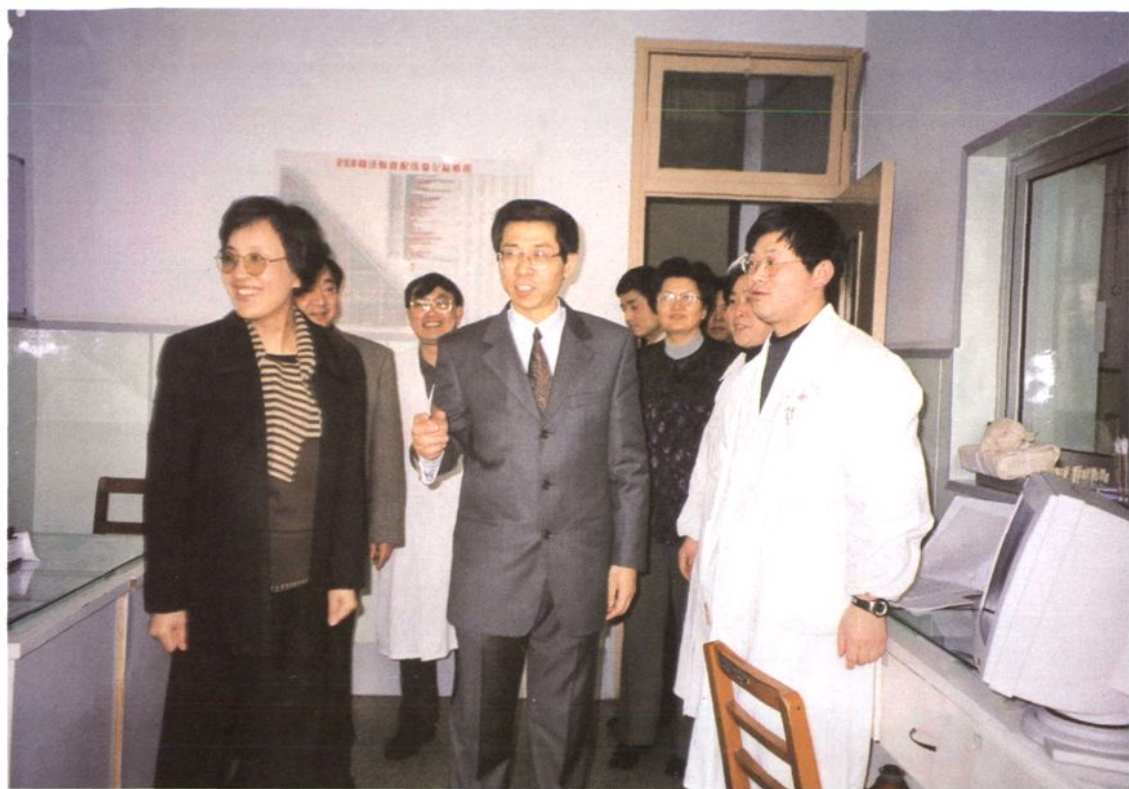
青浦区委书记钟燕群（左一）、区长巢卫林（中）等领导到医院调研工作