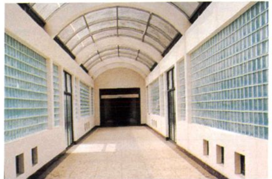
门诊大楼通向住院部的长廊