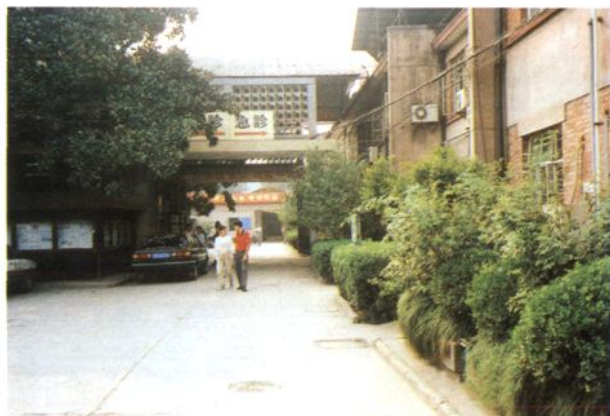
原县中心医院门诊急诊楼