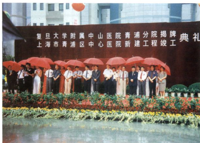
2002年6月28日，中山医院青浦分院（青浦区中心医院）新院揭牌典礼，市卫生局局长刘俊、区长巢卫林等领导出席