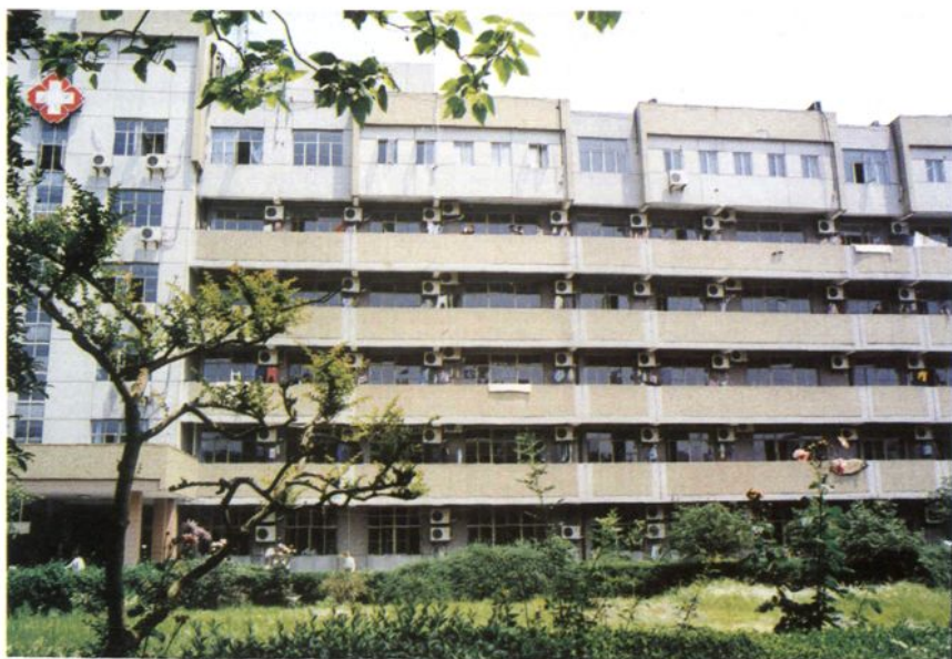
原县中心医院病房大楼