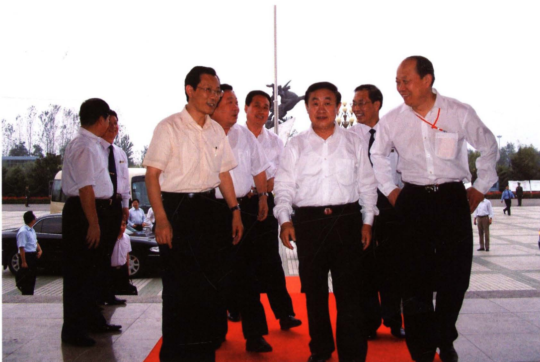
山东省省长韩寓群视察济三煤矿