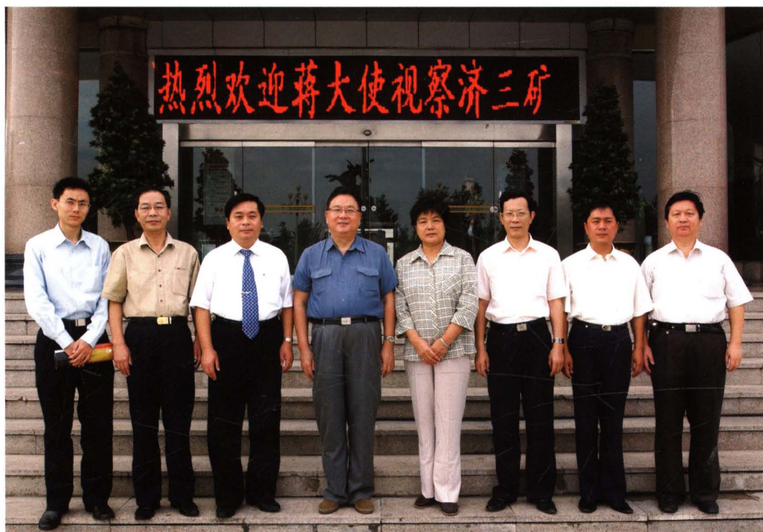
中国驻巴西大使蒋元德在济三煤矿考察