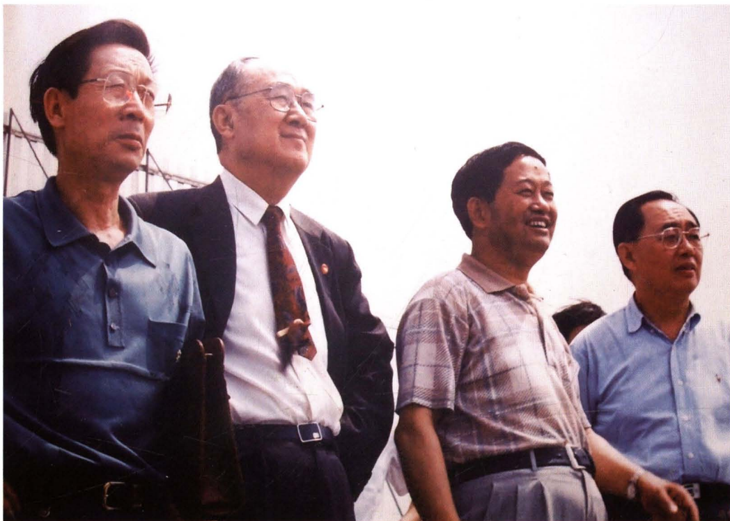
原能源部部长黄毅诚到矿视察