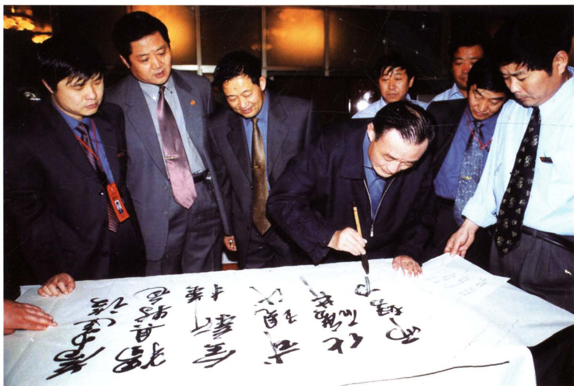
2001年10月17日，时任中共中央政治局委员、国务院副总理的吴邦国同志视察济三煤矿并现场题词