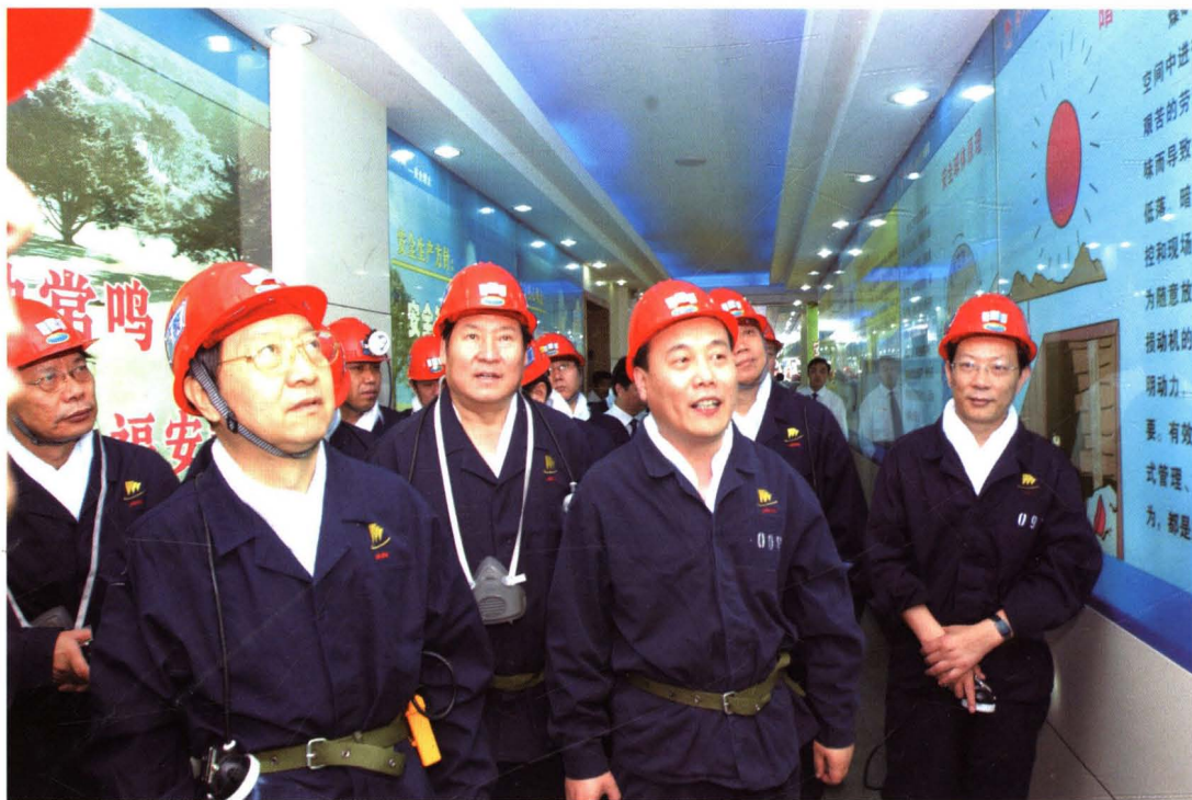
国家安监总局局长李毅中、煤矿安监局副局长赵铁锤参观矿安全文化长廊