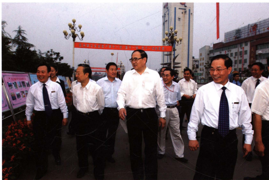
山东省副省长王仁元等领导视察济三煤矿