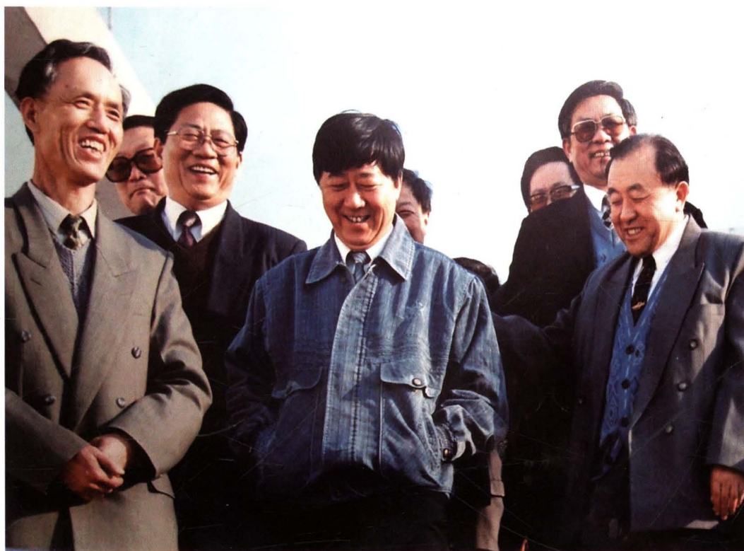
国家煤炭局局长王显政到矿视察