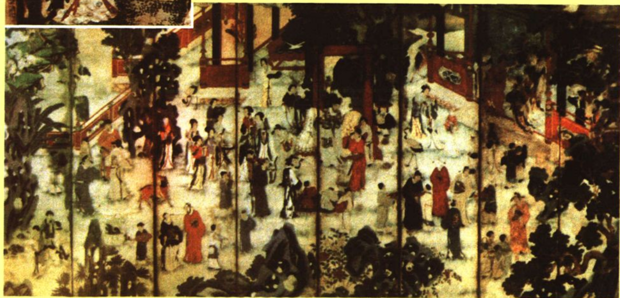
芮城县博物馆藏明代景堆锦《郭子仪诞辰祝拜图》