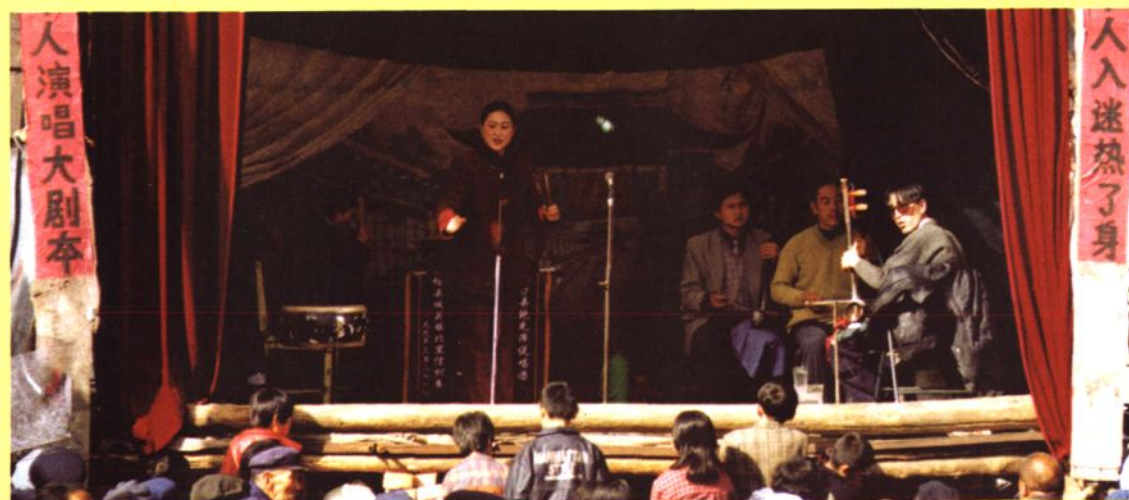
潞安鼓书 长治县曲艺队演出