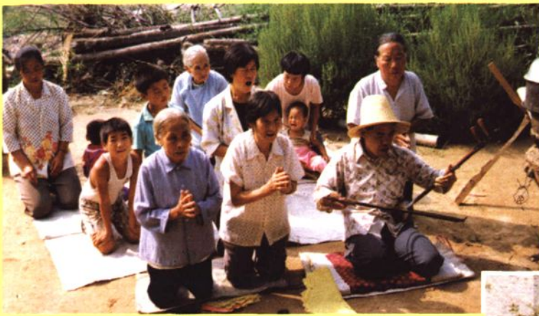
新绛说书为农家还愿演唱