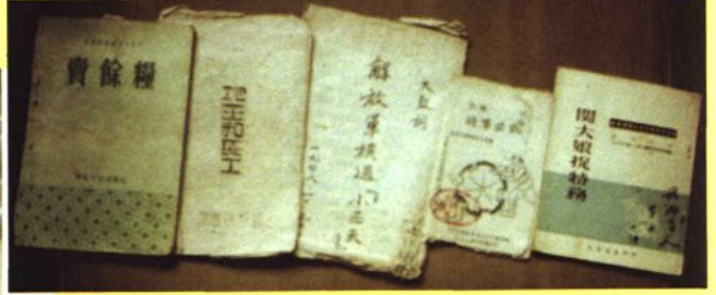
武乡县文化局保存的说唱唱本