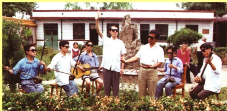
平遥艺人在庭院演唱汾州三弦书（平遥盲书）