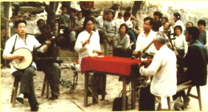
沁县艺人在村头演唱沁州三弦书