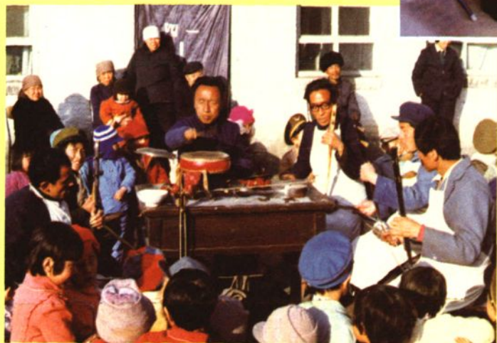
襄垣鼓书演唱形式