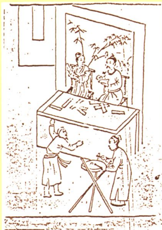
闻喜县下阳金墓壁画「说唱（堂会）图」局部临摹