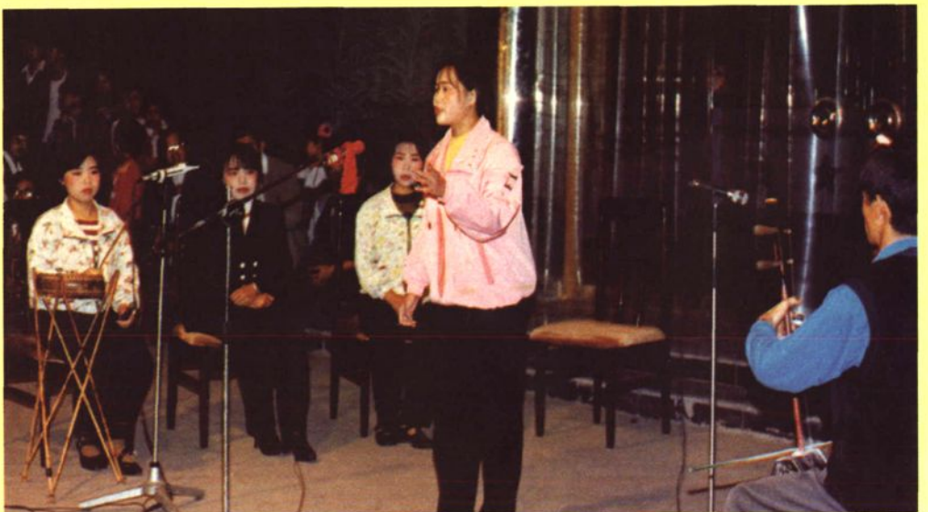
沁水鼓儿词现代曲目的演唱