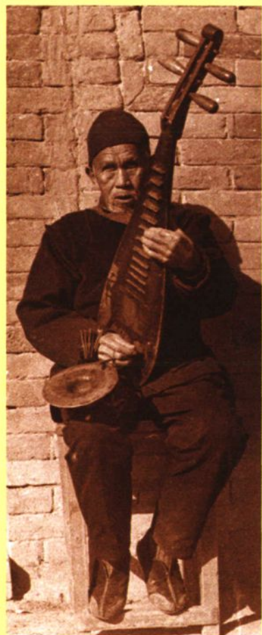
汾西弦子书（琵琶书）