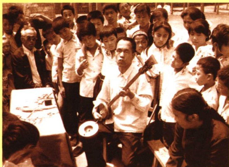
汾西弦子书艺人在演唱