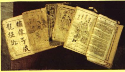
孝义艺人保存的说唱唱本