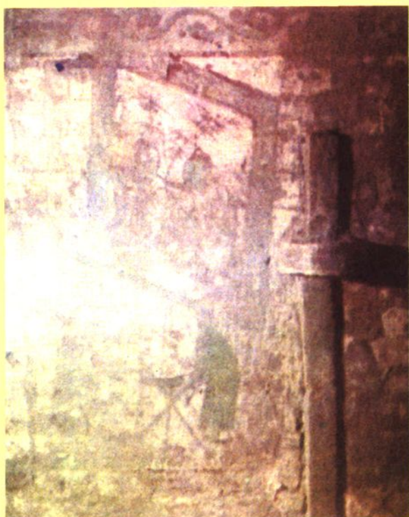
闻喜县下阳金墓壁画“说唱（堂会）图”