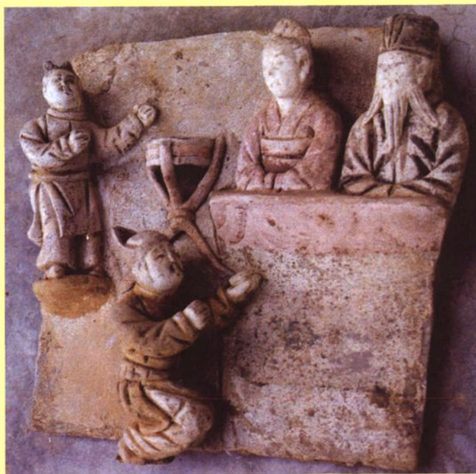
沁县南里乡东庄村金墓二十四孝砖雕之一