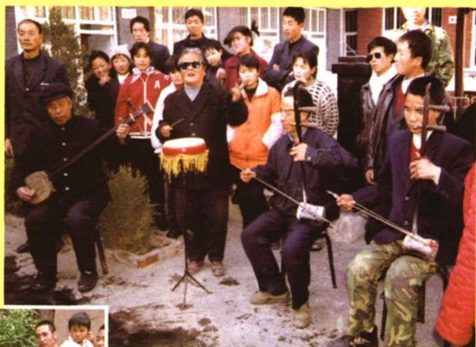
陵川钢板书演唱形式