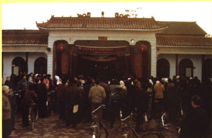
长治县韩店镇书台（演出场所）