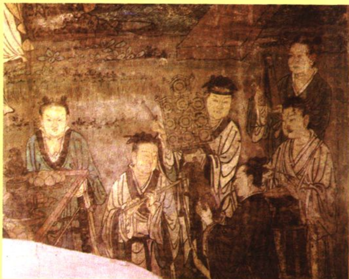
芮城县永乐宫元代壁画“道教乐队”