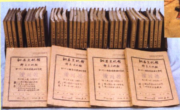
沁县文化馆收集整理说唱唱本