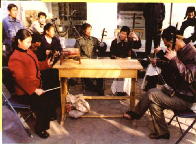
高平鼓书演唱形式