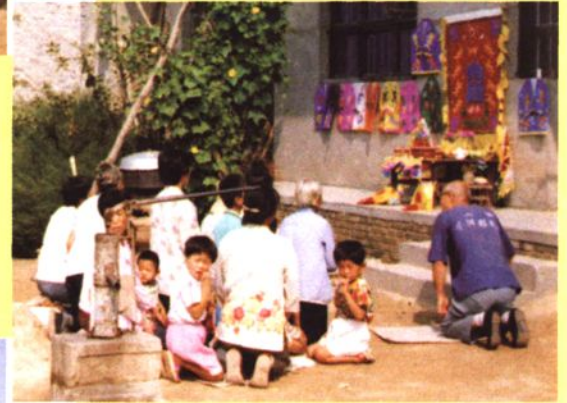
新绛说书为农家还愿演唱