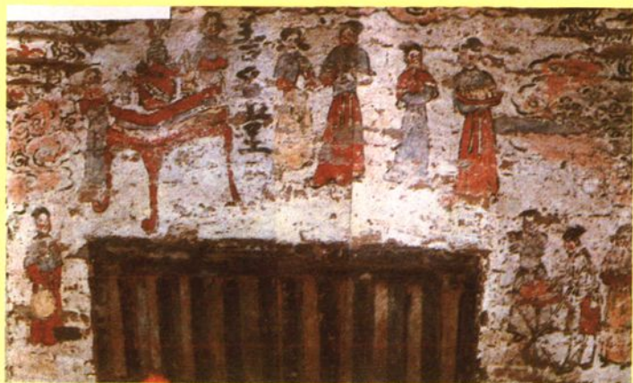
垣曲县西峰山元墓壁画“说唱图”