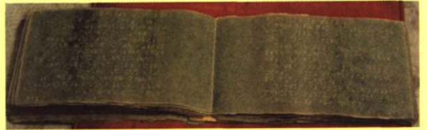
太原道情艺人保存的盲人说唱唱本