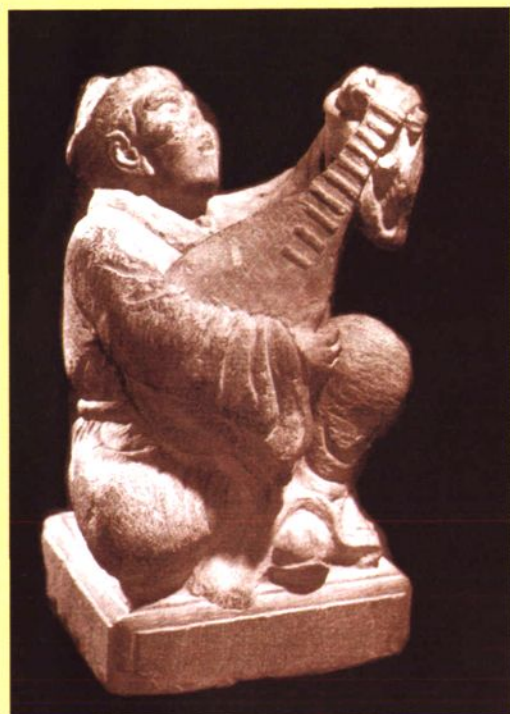
曲沃县博物馆藏元代（或金代）盲人谈唱石雕