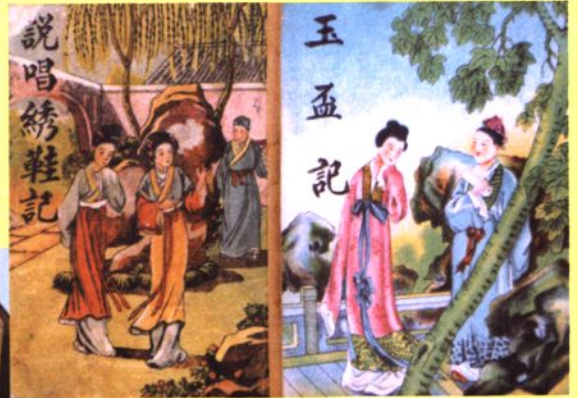
长治艺人保存的潞安鼓书说唱唱本