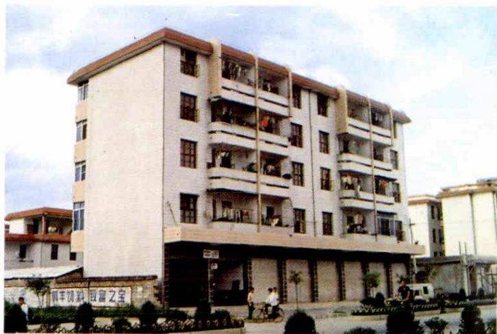
南安大道职工宿舍楼