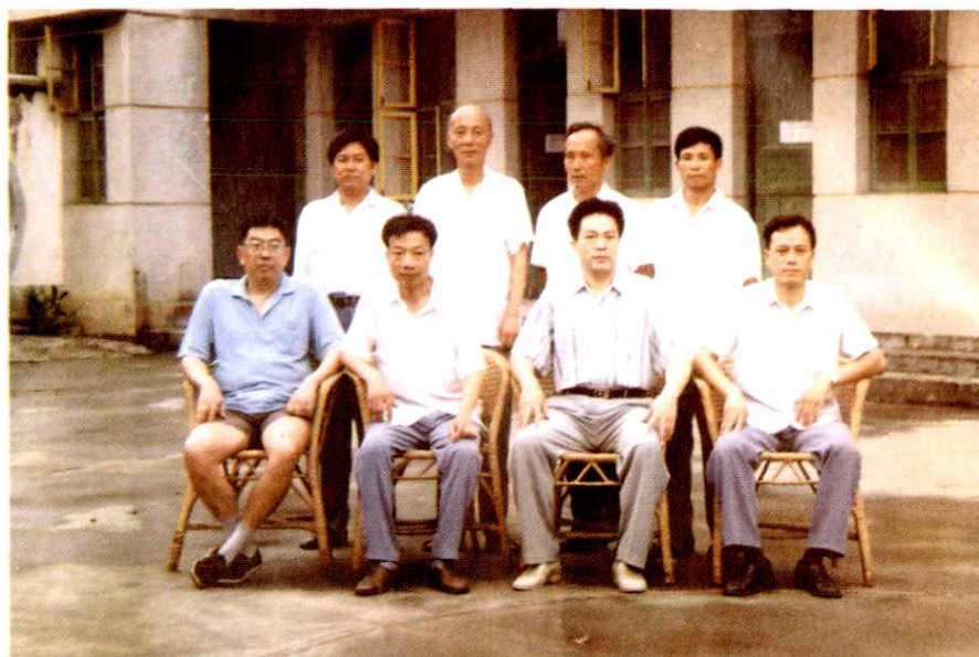
《大余邮电志》编纂领导小组合影