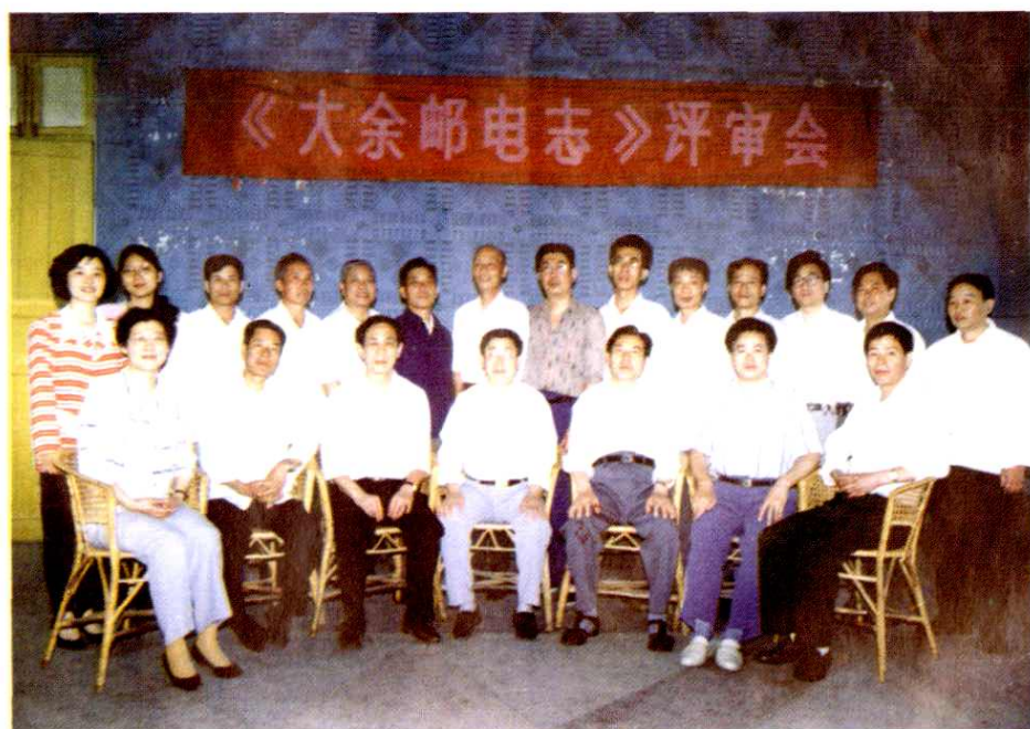
《大余邮电志》终审委员会合影