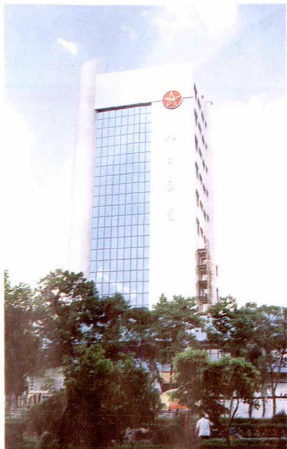
1995年竣工的邮电大楼