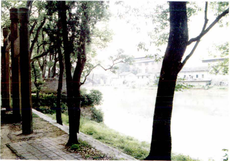
古驿道东山大码头遗址