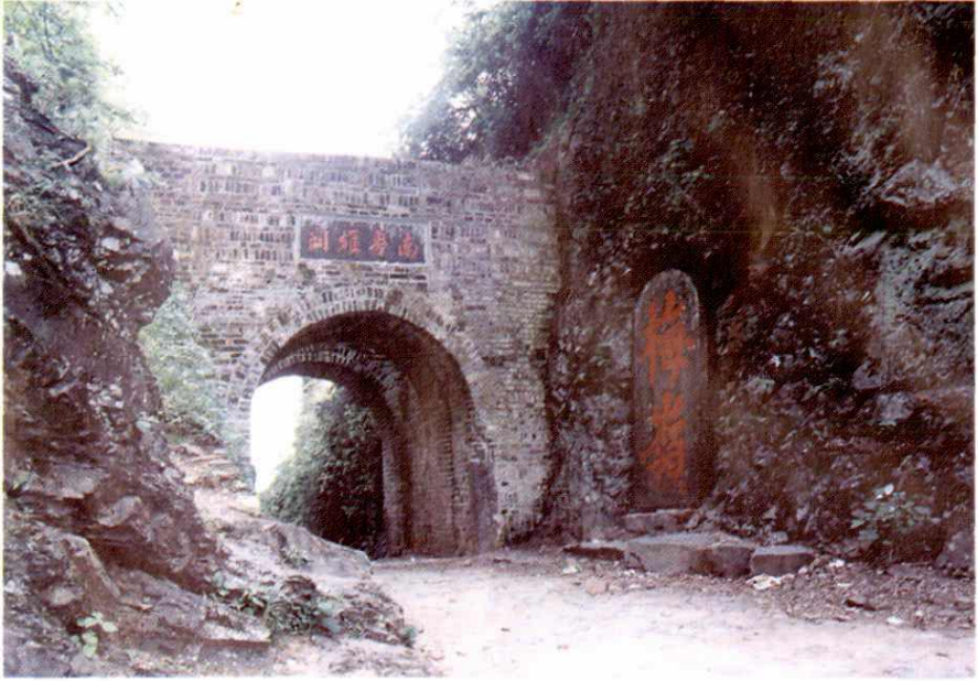
古驿道大庾岭梅关