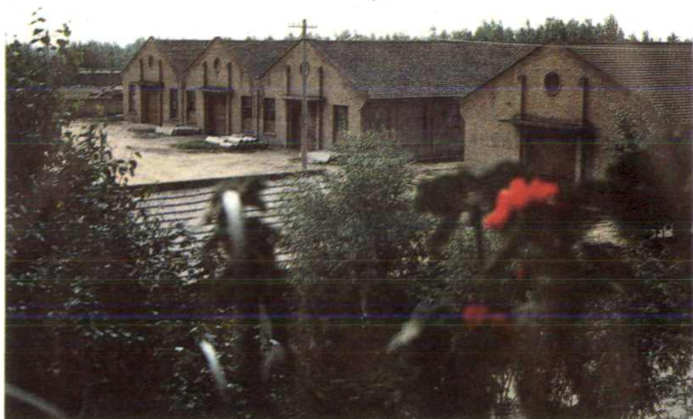
庆阳地区建化公司仓库