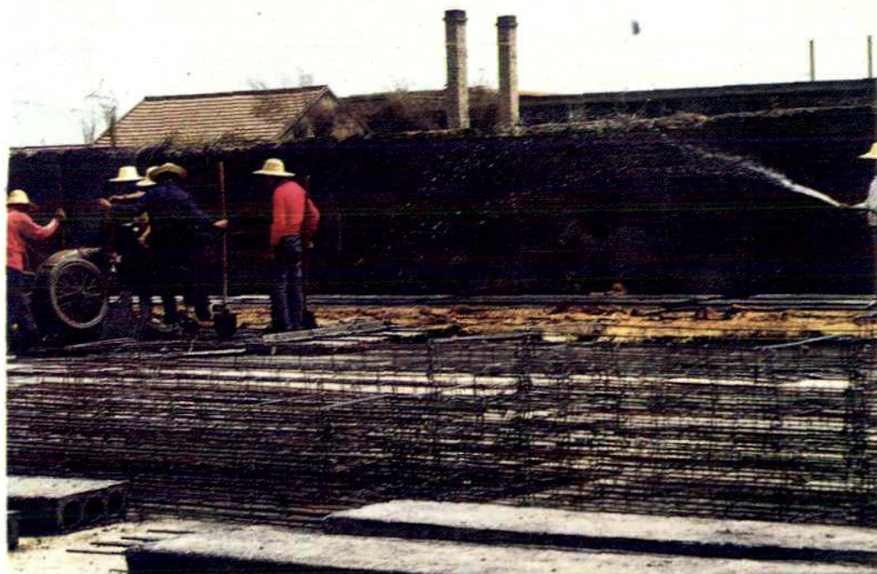
物资的深度加工——合水县物资局水泥预制品生产现场一角