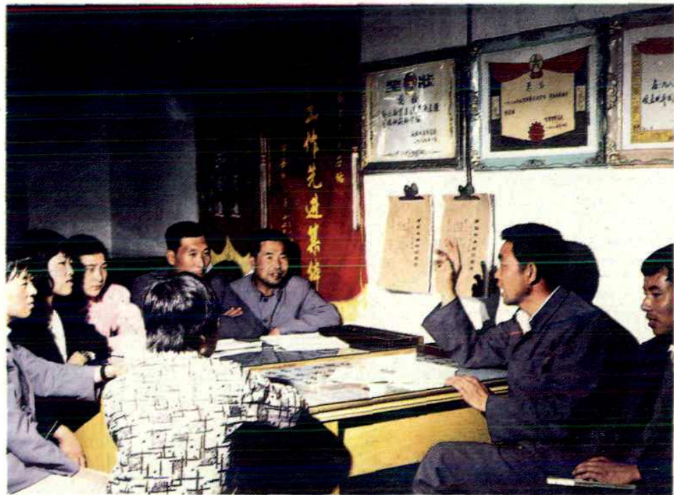
全区乡镇物资供应网点先进单位之一——宁县和盛物资供应站