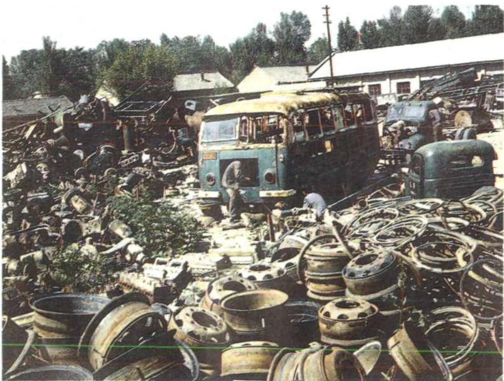
庆阳地区金属回收公司货场一角