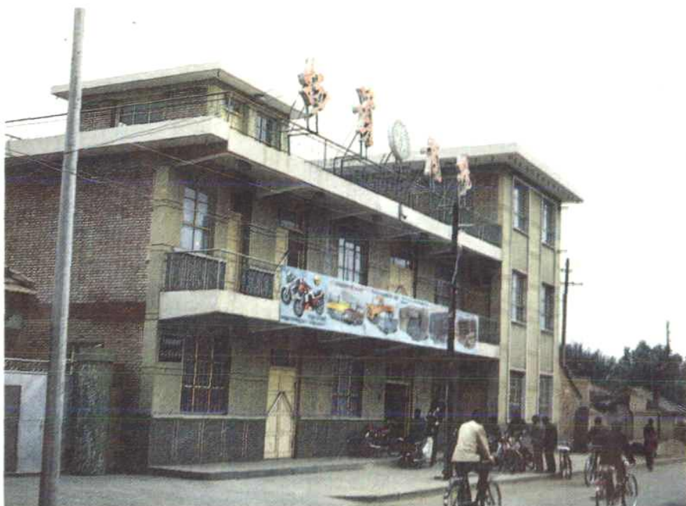
庆阳地区物资贸易中心办公楼