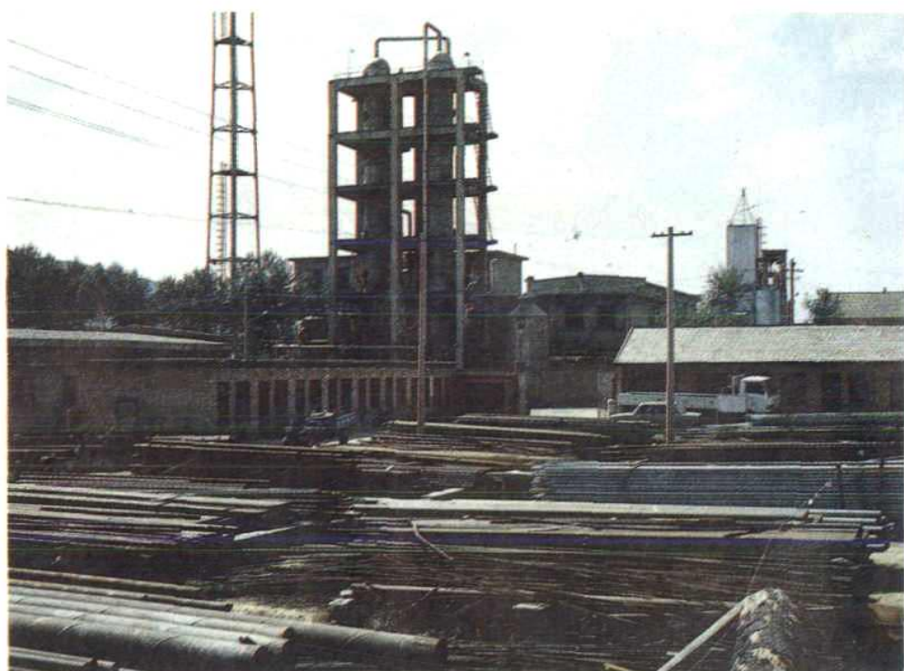
庆阳地区石油化工厂物资货场一角