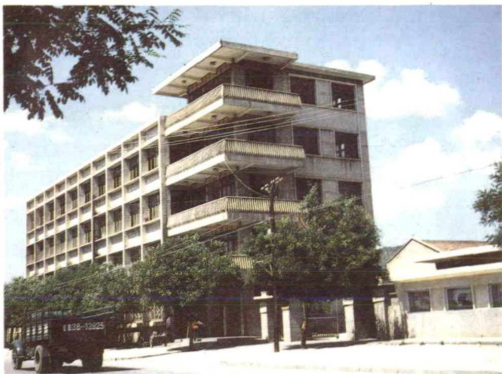
庆阳县物资局办公楼