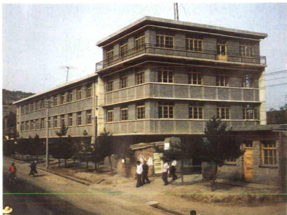
镇原县物资局办公楼