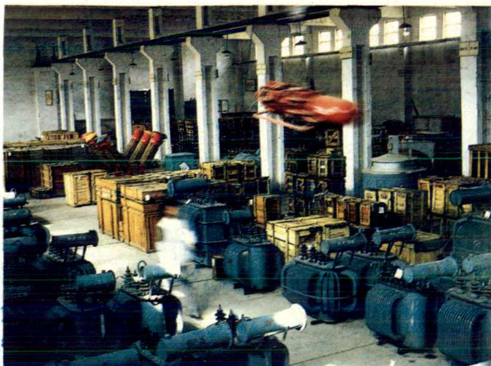
中央部属企业长庆石油勘探局机电设备仓库一角