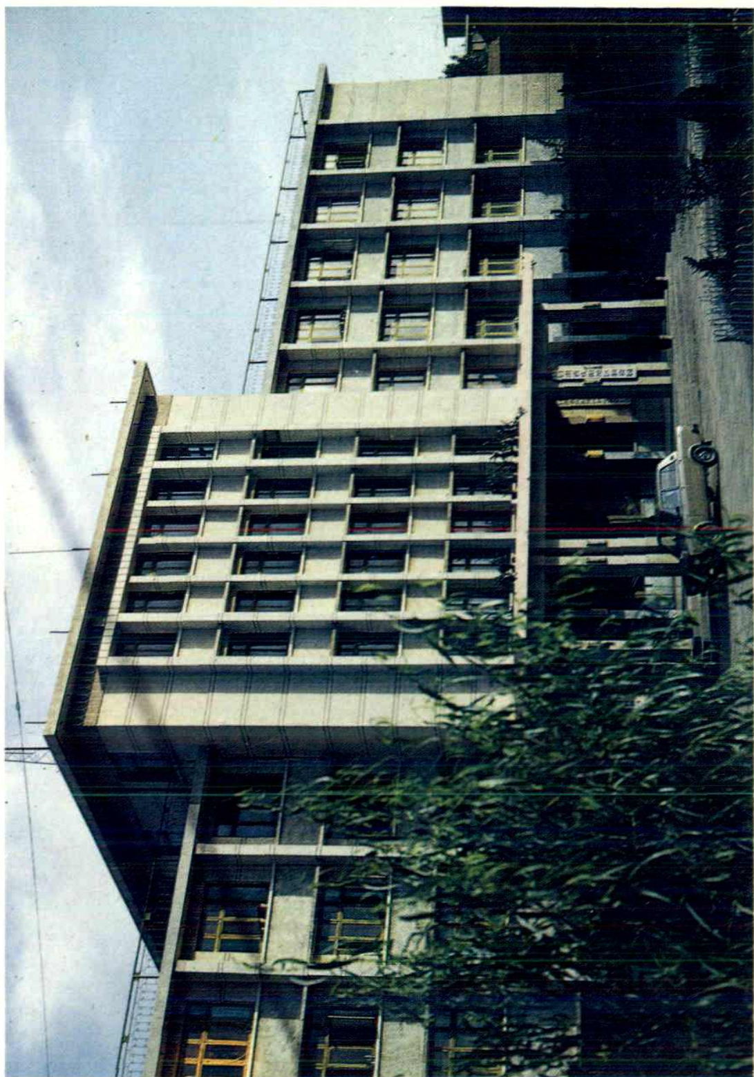
甘肃省庆阳地区物资局办公大楼