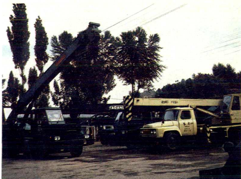
中央部属企业长庆石油勘探局部分物资仓储机械设备