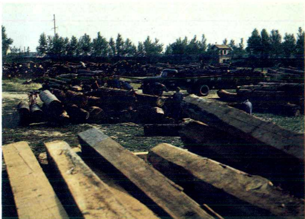
庆阳地区木材公司货场一角