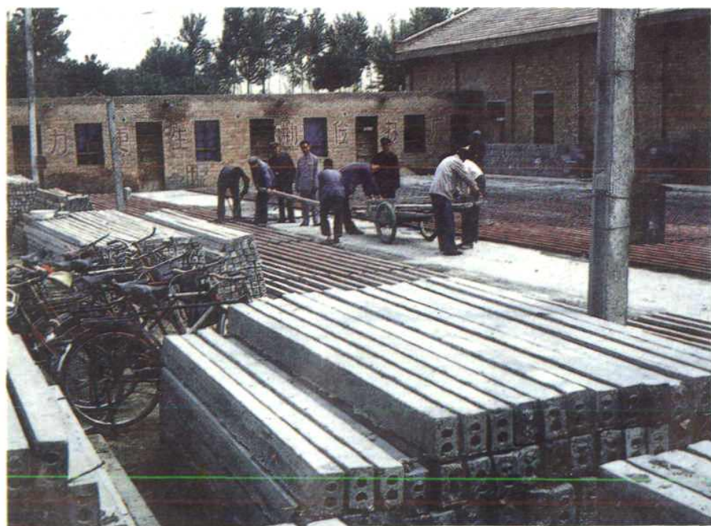
乡镇企业宁县和盛建筑公司水泥预制品生产现场一角