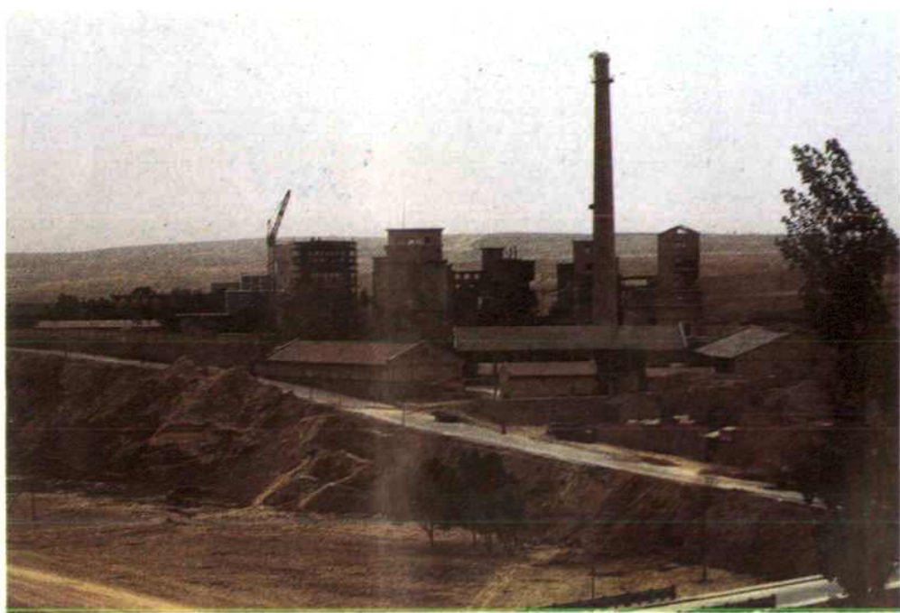
物资“三材”之一的建筑材料工业——庆阳地区水泥厂全貌