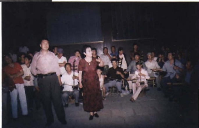
社 区 文 化