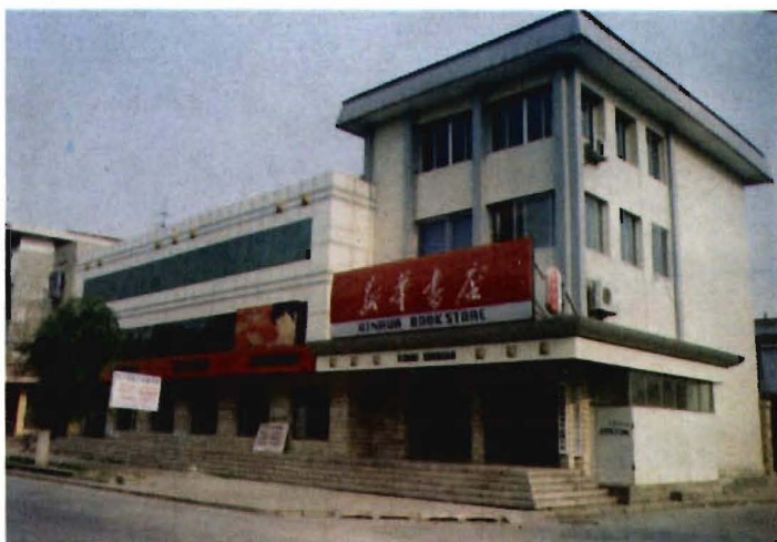
新 华 书 店 楼