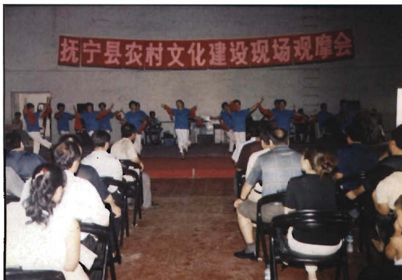
农村文化建 设现场观 摩会