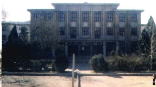
县 政 府 礼 堂 ( 抚 宁 剧 场 )