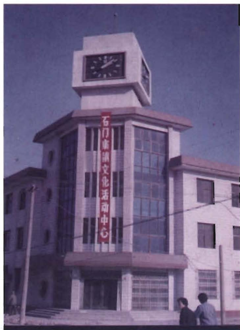
石门寨镇文化活动中心楼