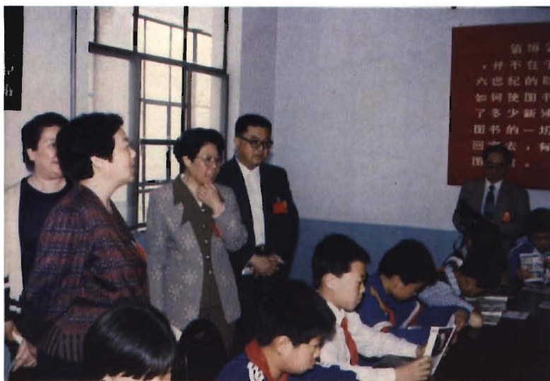
全国文化先进 县代表参观石 门寨镇文化 中心读书活动