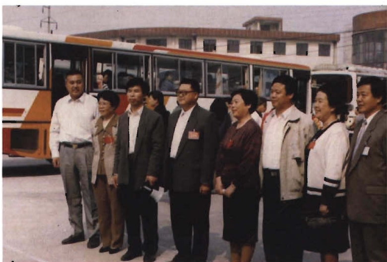
文化部、 省、市、县 领导考察 石门寨镇 文化活 动中心