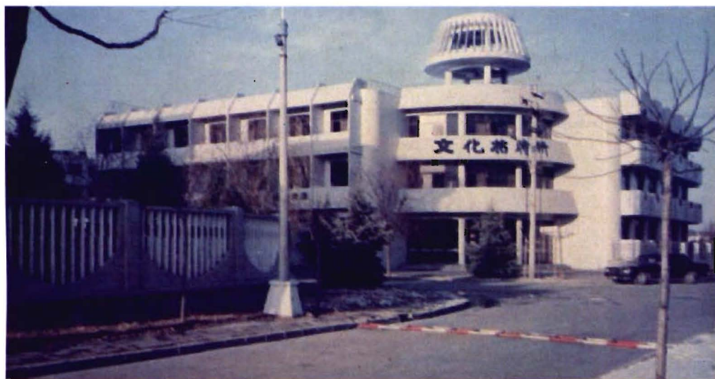
南 戴 河 文 化 中 心 (文 化 招 待 所)