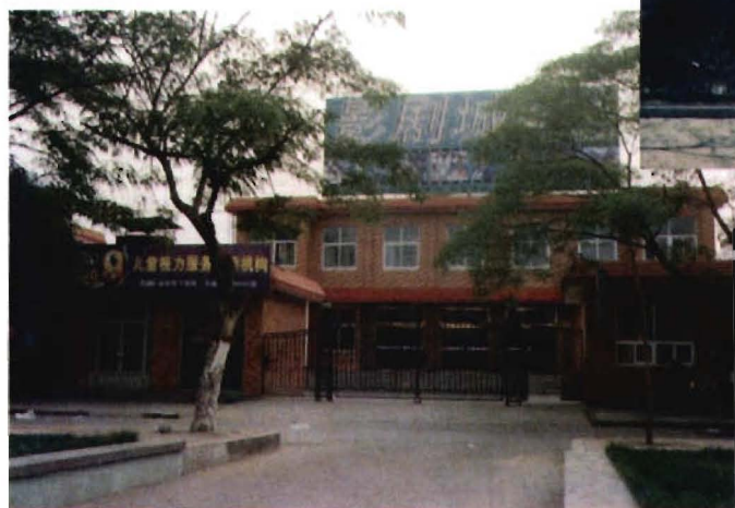
影 剧 城