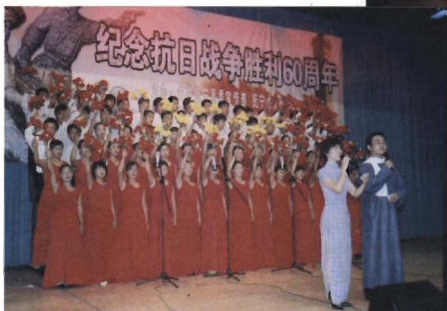
纪念抗战胜利 60周年演唱会