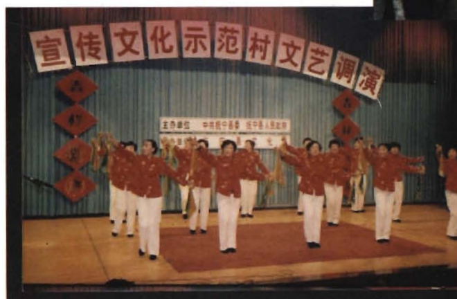
宣传文化示范村 文艺调演