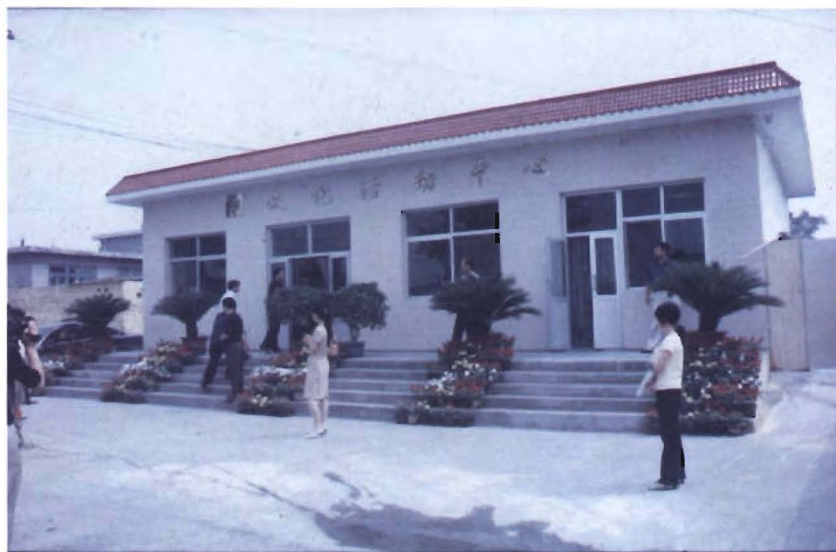
石门寨镇王木庄村文化活动中心