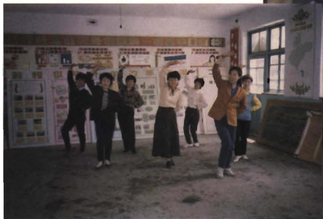
舞 蹈 培 训