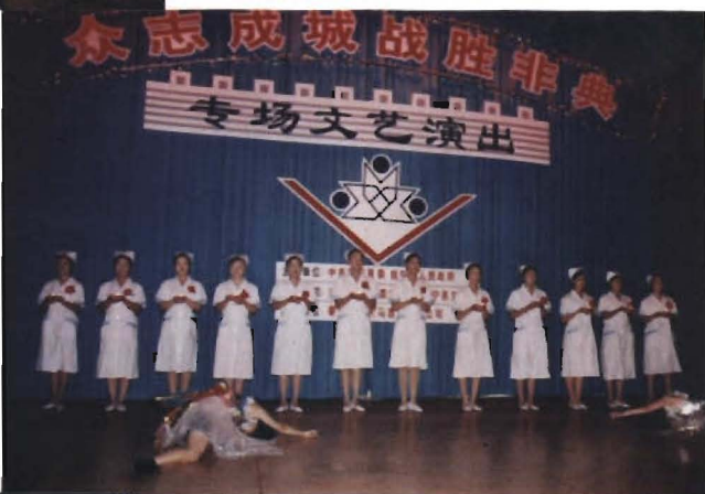
抗“非典”专场文艺演出