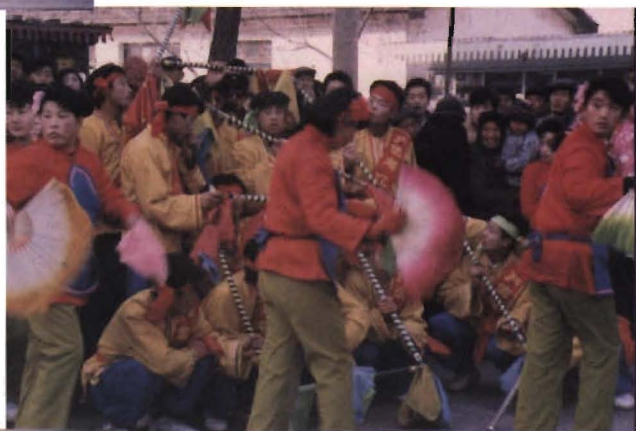
霸 王 鞭