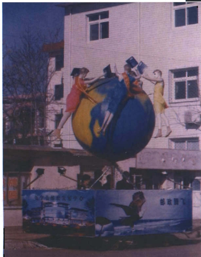
元 宵 灯 展