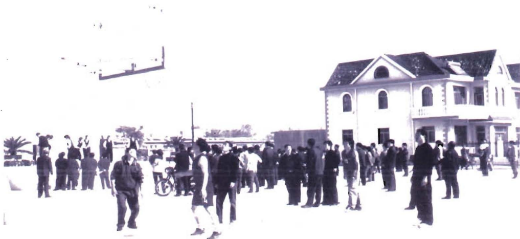
潘官营村文体广场