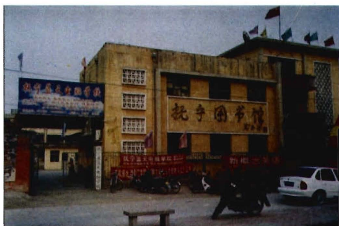
图 书 馆 楼