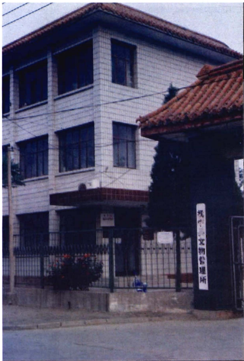
文 物 管 理 所