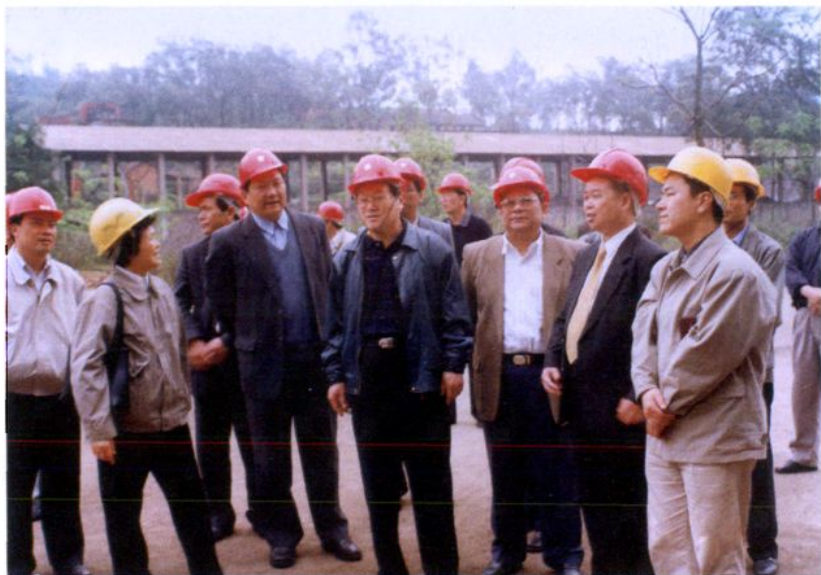
▶ 2001年3月26日，自治区人民政府副主席张文学（右四）到集团公司视察。