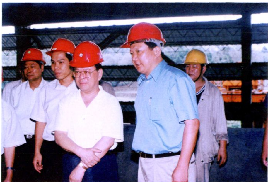
▲1997年8月4日、2002年6月14日，自治区党委书记曹伯纯（前排右二）两次到总厂（集团公司）视察。