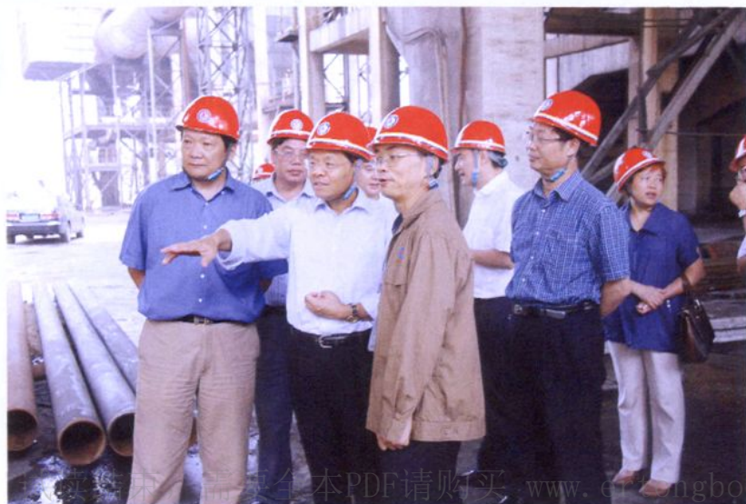
◀ 2008年10月7日，自治区人民政府副主席陈武（前排中）到集团公司调研。