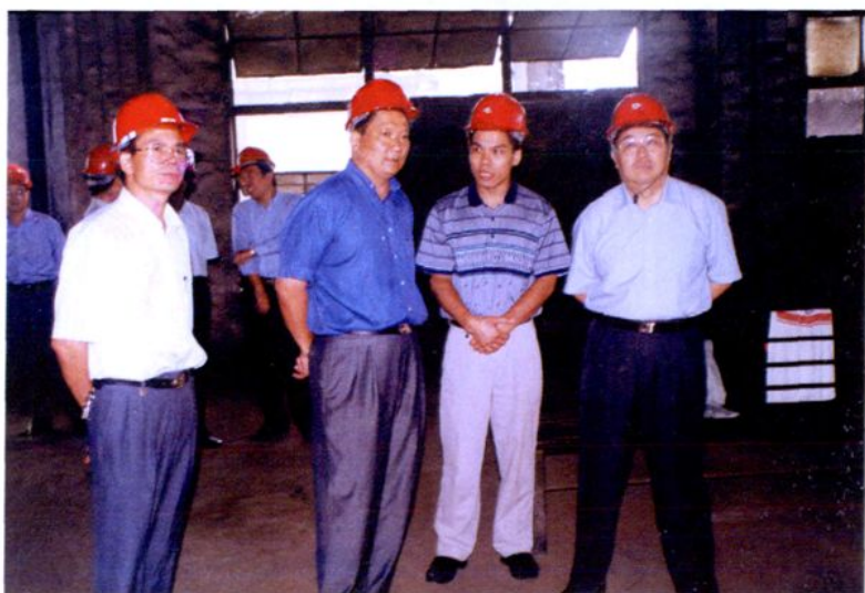
▶1999年10月12日，自治区副主席王汉民（右一）到总厂视察。