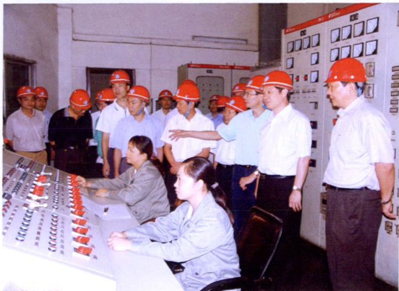
▶2007年8月21日，自治区党委书记刘奇葆（右二）到集团公司调研。