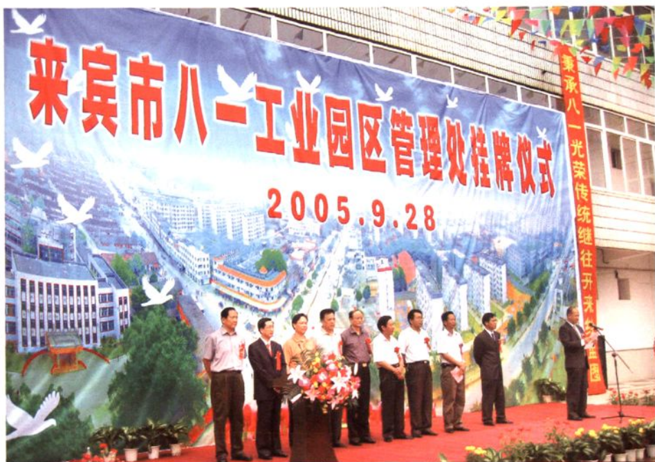
▲▶ 2005年9月28日，八一工业园区管理处挂牌。