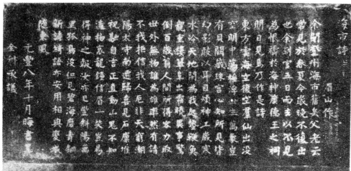
苏轼《海市诗》全文石刻