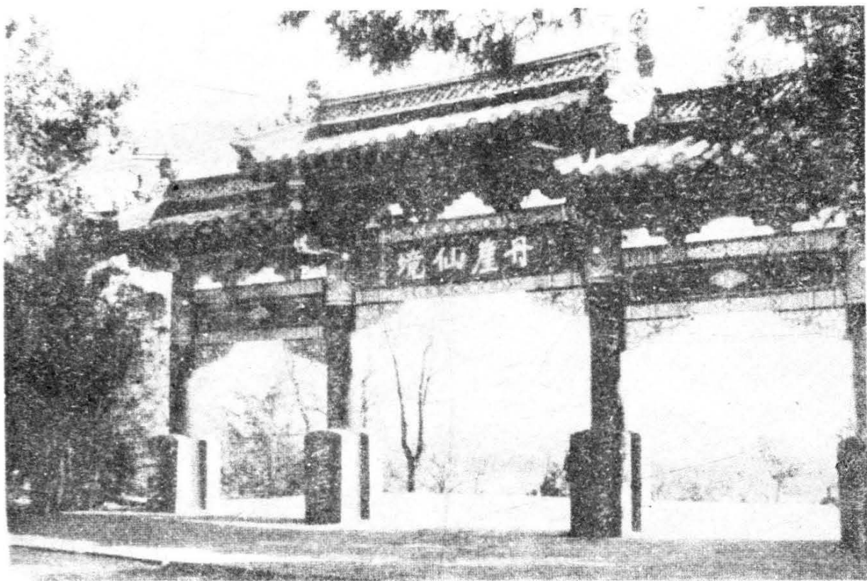
董必武同志题“丹崖仙境”