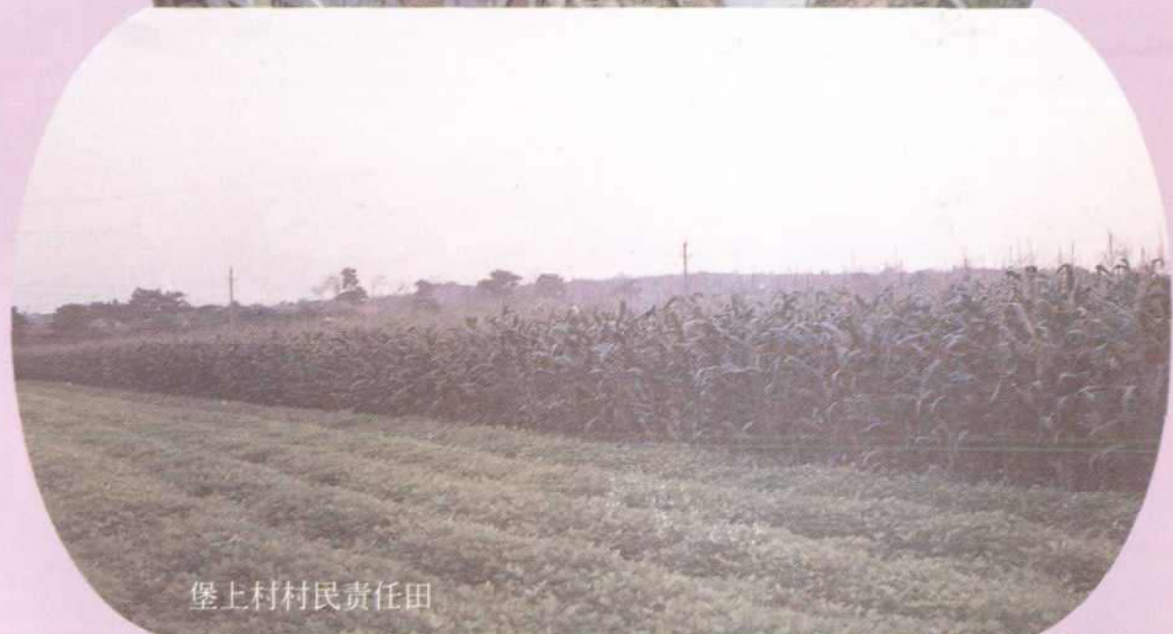
堡上村村民责任田