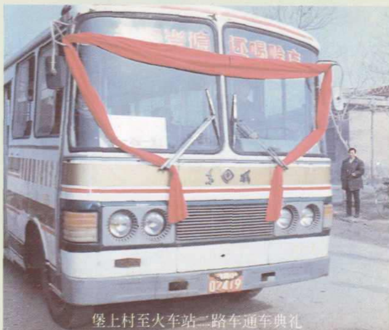
堡上村至火车站二路车通车典礼