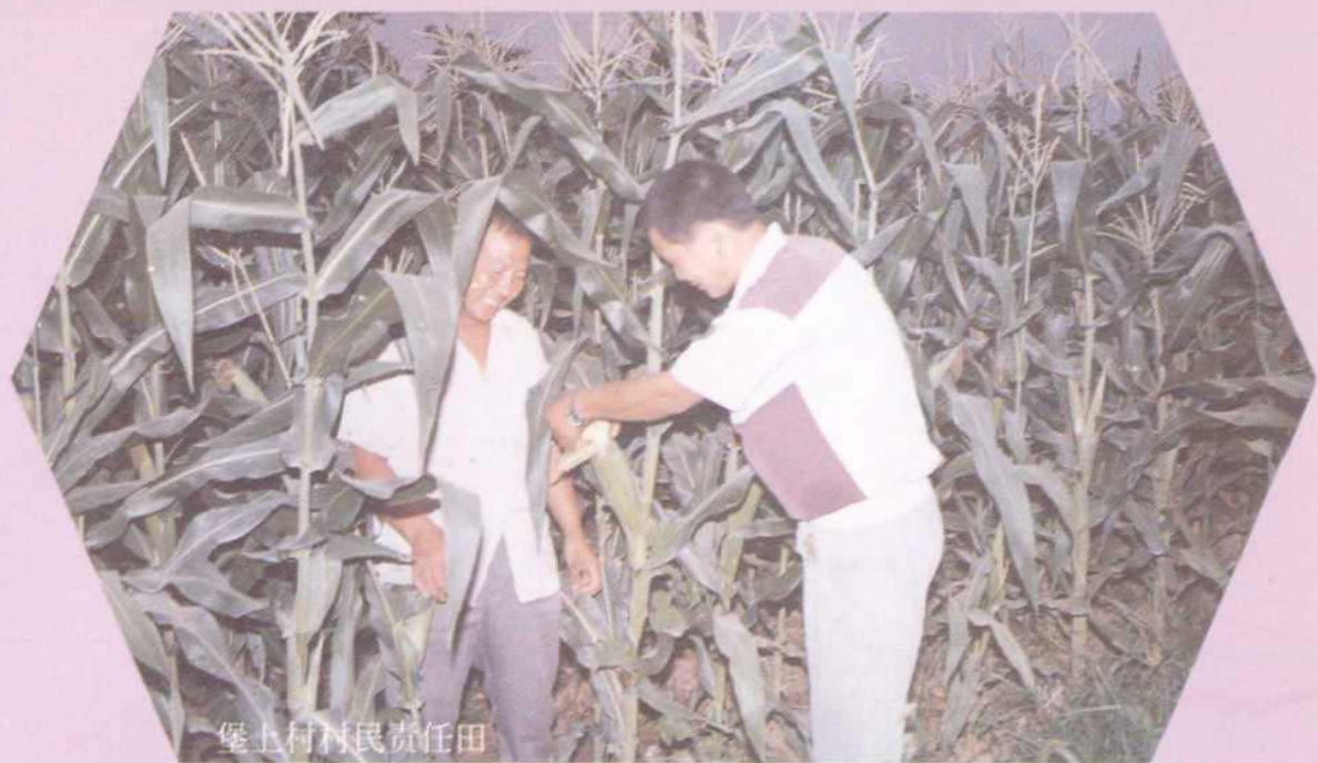
堡上村村民责任田