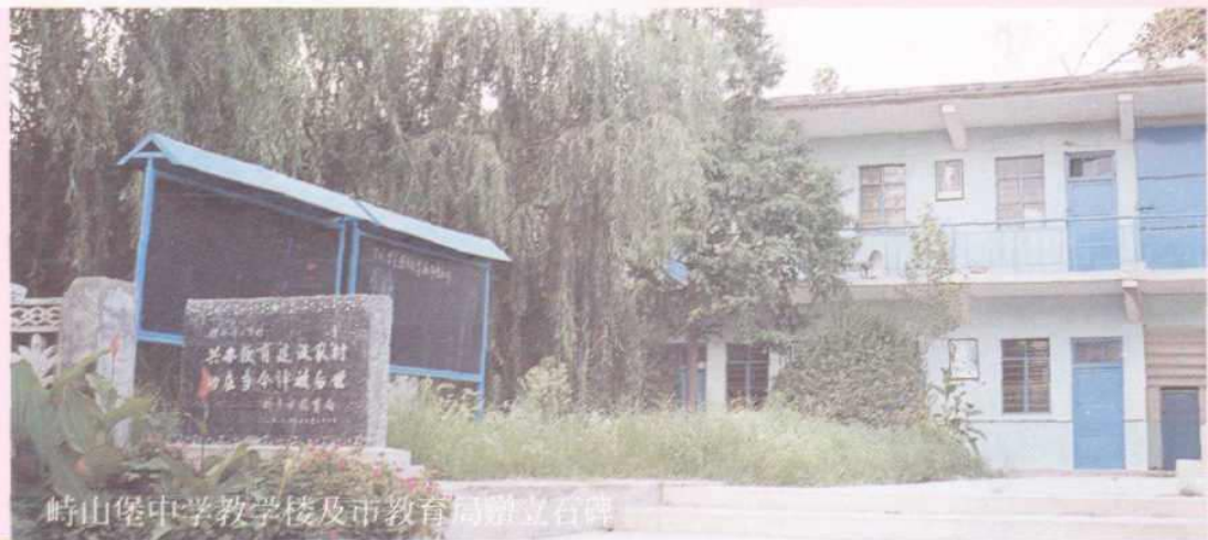
峙山堡中学教学楼及市教育局赠立石碑