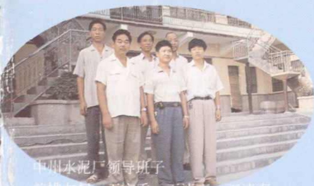
中州水泥厂领导班子