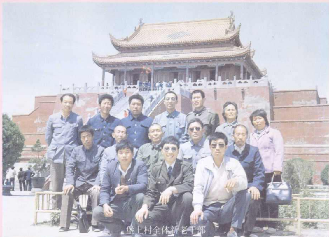
堡上村全体新老干部