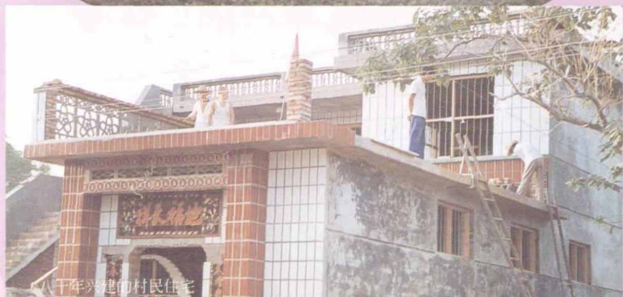
八十年兴建的村民住宅