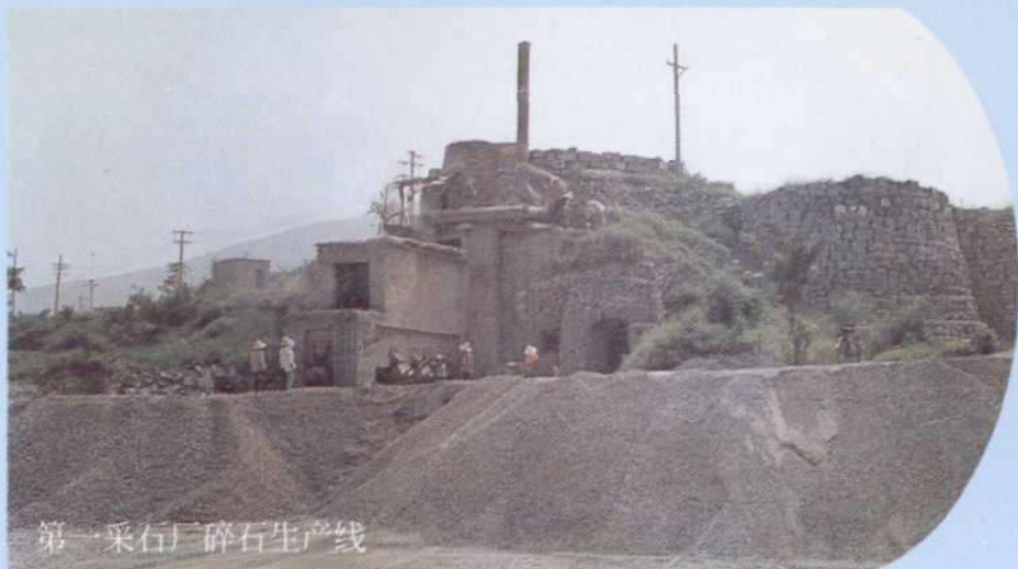
第一采石厂碎石生产线