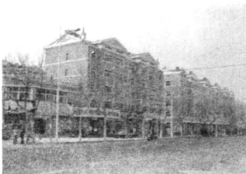
图 1—2 戴家庄村五层楼房一瞥 (2004 年摄)

房地产开发 进入 21 世纪,随着二、三产业的快速发展和城市建设,土地面积锐减。村两委研究并报上级批准,开始搞房地产开发。2001 年,拆除旧房 81 间,占地 4920 平方米,建成居民楼 2 座,建筑面积 14548 万平方米。2002 年,拆除旧房 48 间,占地 11340 平方米,建成居民楼 5 座,建筑面积 21128 万平方米。2003 年至 2004 年,拆除旧房 270 间,占地 5000 平方米,建成居民楼 3 座,建筑面积 10859 万平方米