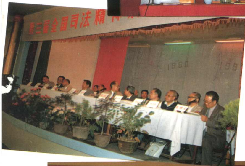
第三届全国司法精神病学学术会议在院召开。