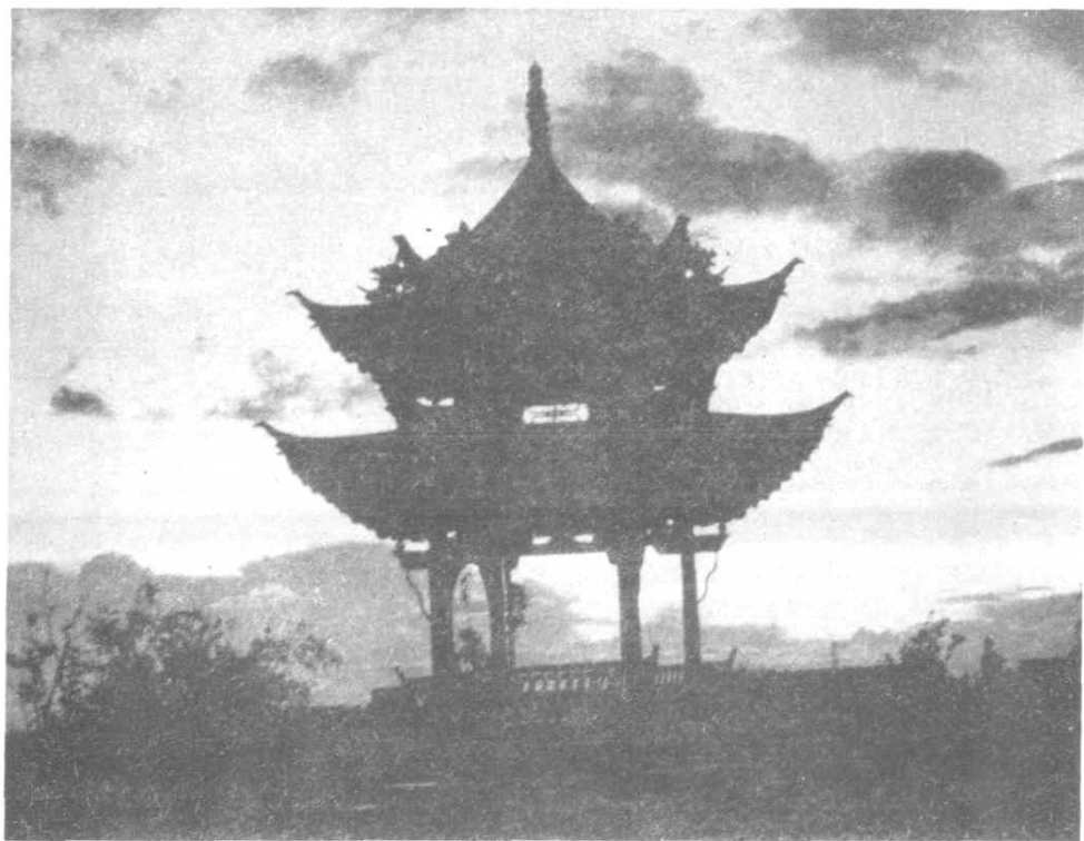
森湖公园——凉亭之一