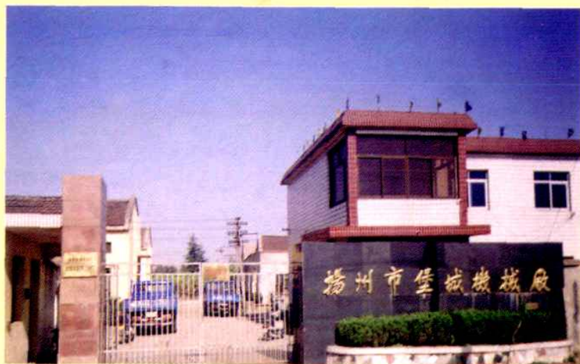
村重点骨干企业之一——扬州堡城机械厂