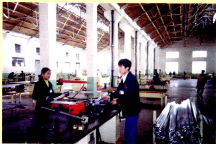
堡城汽车装饰配件厂窗框 车间一角