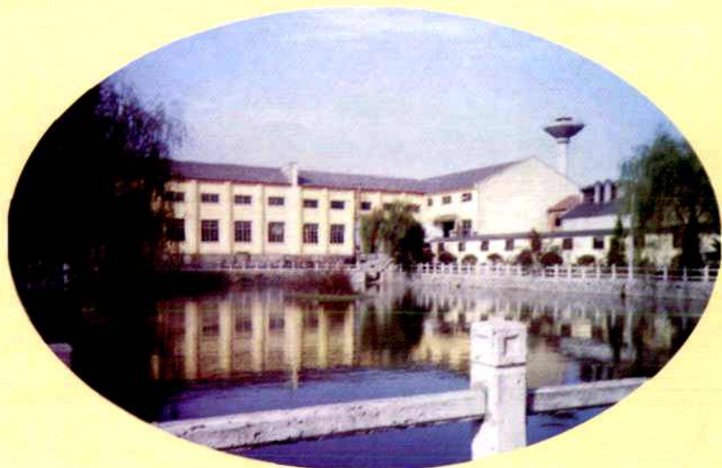
村龙头企业——堡城汽车装 饰配件厂美丽的厂景