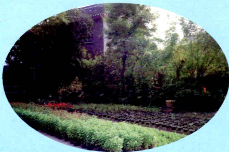
村民家庭花木苗圃