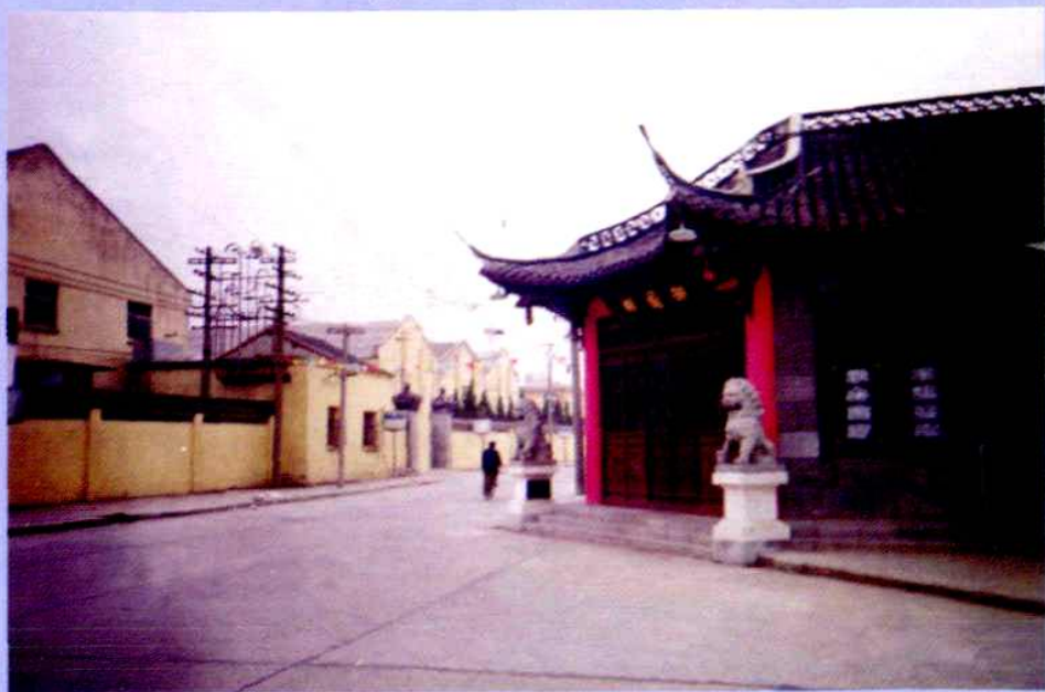
村中心街道测字街——古唐城十字街遗址