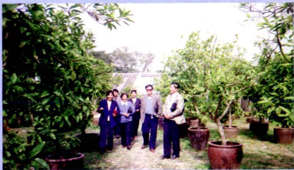
区、乡领导视察该村花木基地