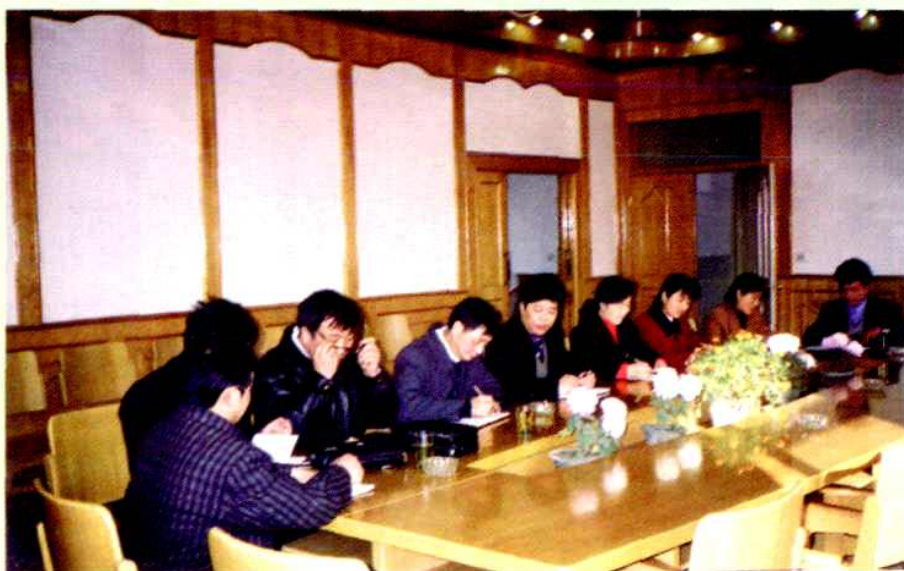
村党总支、村委会领导研究工作思路