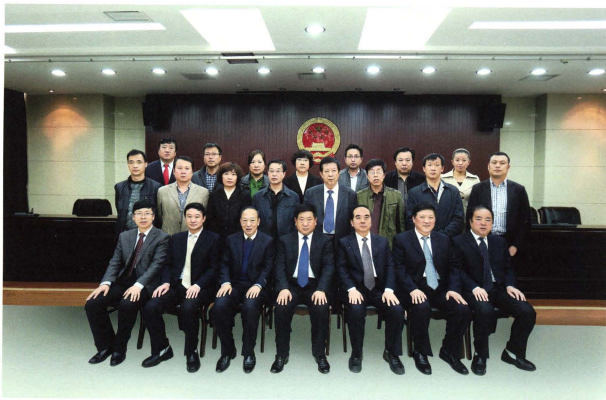
《祁县人大志》编纂委员会合影