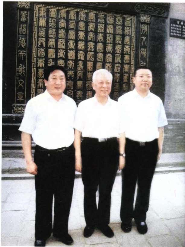
县人大主任张俊慧、县长张鹏陪同全国人大副委员长周铁农来祁县考察