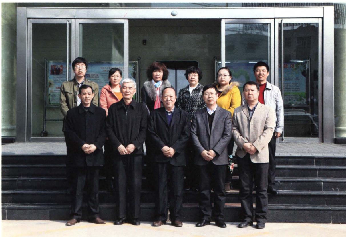
《祁县人大志》编辑人员合影