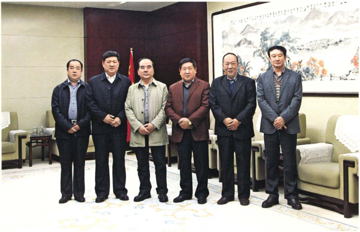
祁县第十五届人大常委会主任、副主任合影