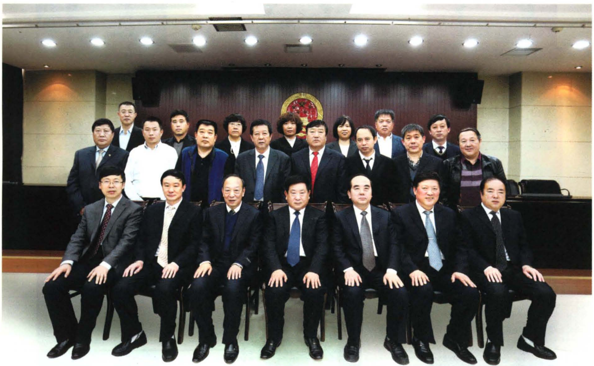
祁县第十五届人大常委会组成人员合影