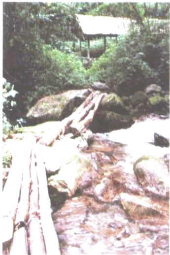
武陵源国家森林公园中的红杉溪水