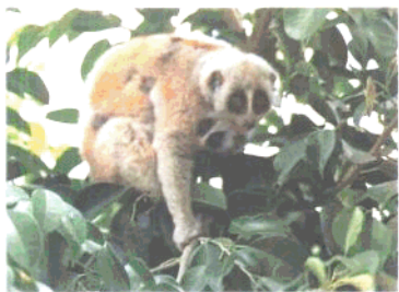
国家一级保护动物叶猴