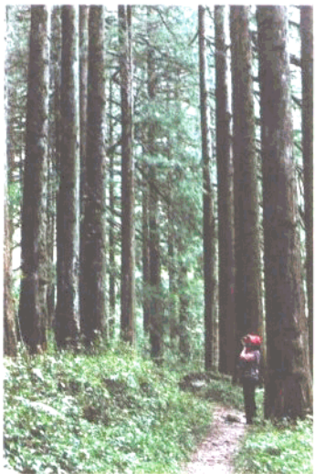
国家一级保护植物珙桐