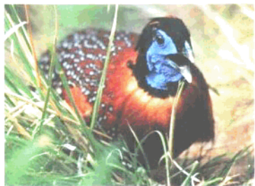
国家二级保护动物红腹角雉