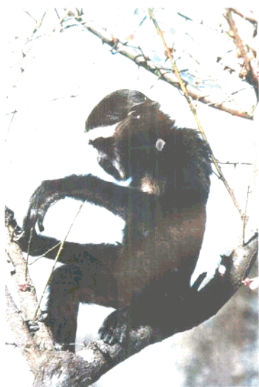
国家一级保护动物黑川猕猴