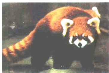
国家二级保护动物小熊猫