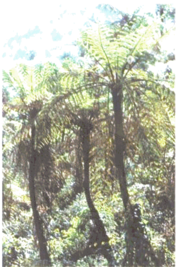
国家一级保护植物桫欏