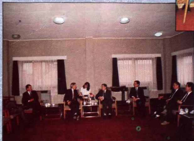
1992年5月21日，审计署审计长吕培俭在沪会见法国审计院法官、第七庭庭长约翰·帕达