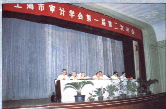
上海市审计学会第一届第二次年会