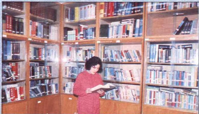
上海市审计局为提高干部队伍的政治水平和业务水平，建立了存有政治、经济、法律等方面的图书4000多册