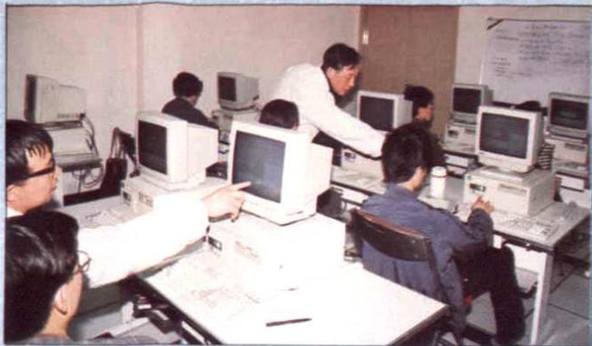
1993年10月上海市审计局利用日本政府贷款，建立了上海市审计信息中心，培养了一批又一批电脑操作人员