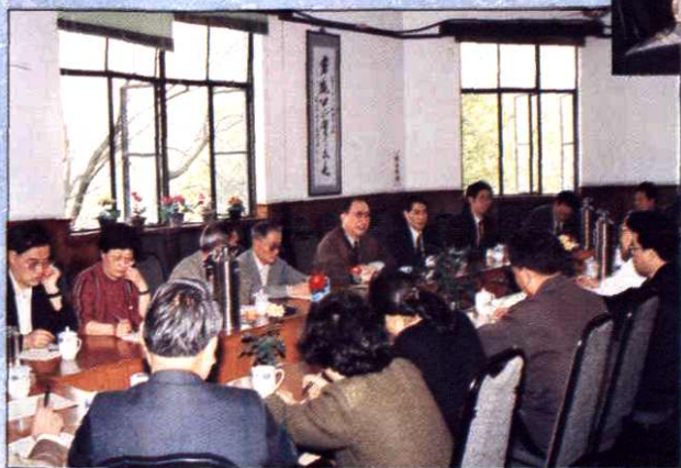
1993年4月22日，副市长徐匡迪来市局听取工作汇报