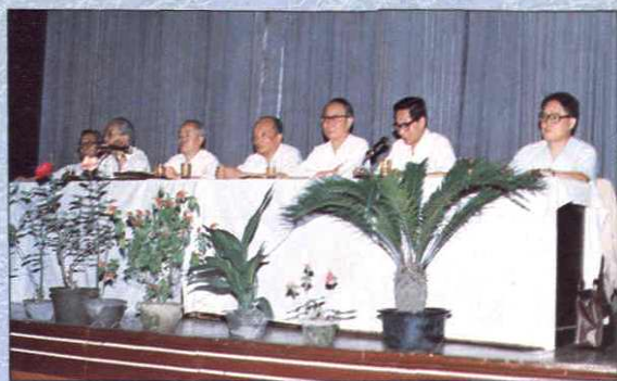
1988年1月11 ~ 14日,上海市审计工作会议在上海县莘庄举行。副市长黄菊出席了会议,并作了重要讲话