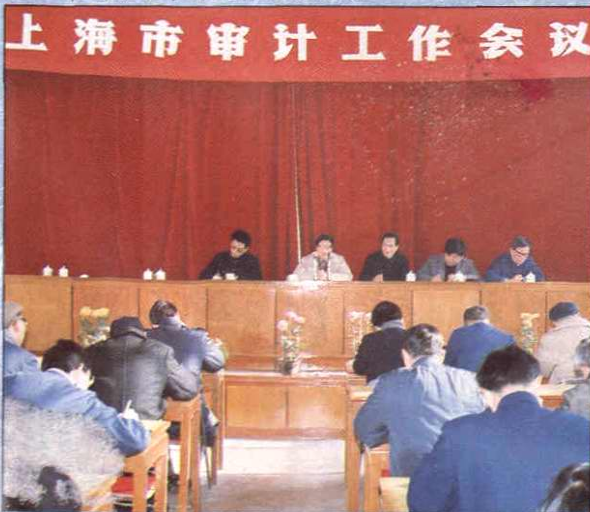
1988年上海市审计工作会议会场