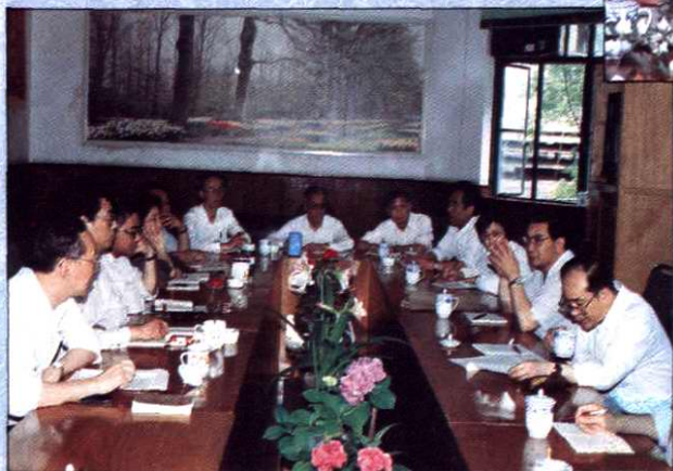
1993年6月，副审计长李金华、刘鹤章在上海作调查研究工作