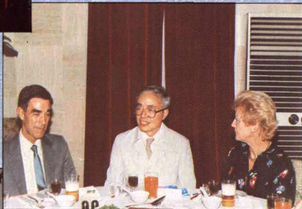
1985年9月6日晚，副市长叶公琦在锦江宾馆会见英国审计长戈登·道尼及夫人