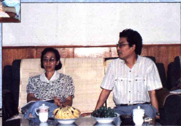
1993年8月，副审计长郑力在上海作调查研究工作