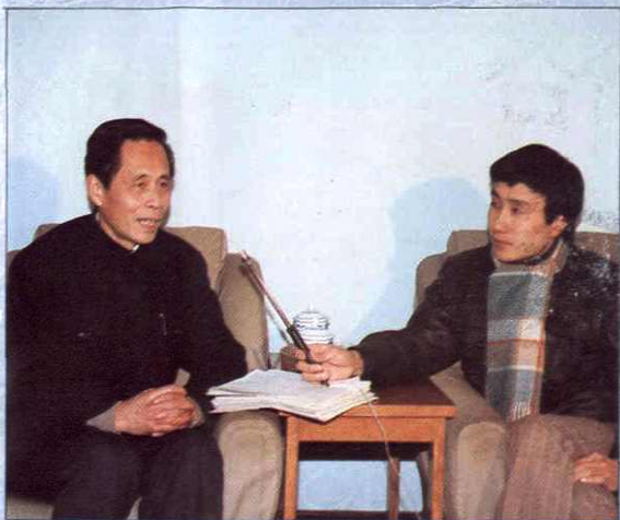
会议期间局长赵洪元接受记者采访