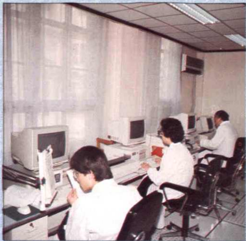
审计信息工作人员正在搜集、整理信息