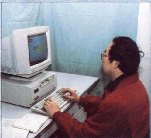
人事、统计、法规、财务信息等工作初步实现用计算机管理