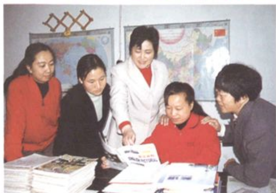
英语组全英文教研活动