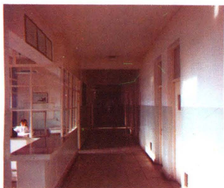
医院病房、手术室走廊