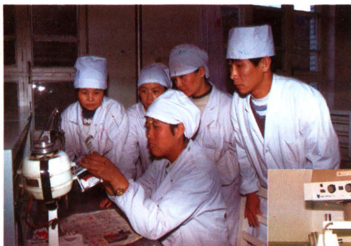
修复科带教老师给实习生做示范