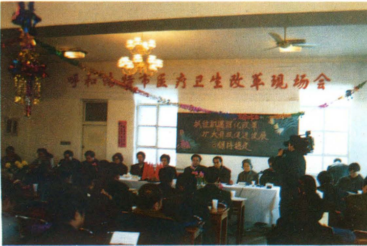
1994 年全卫生系统医疗卫生改革现场会在我院召开