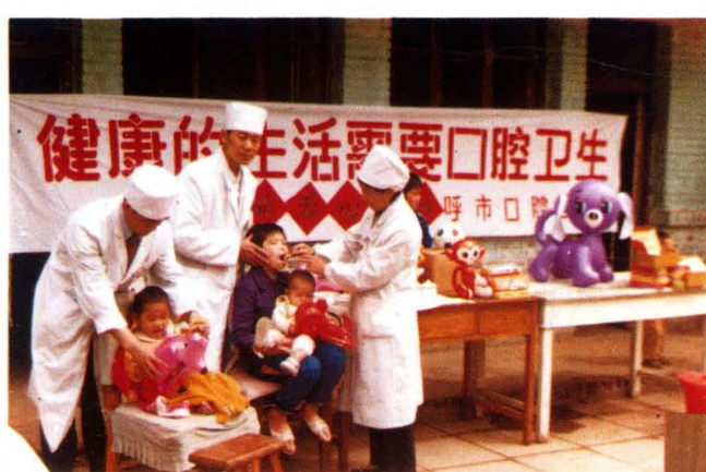
助残日活动中在福利院给孤残儿童检查口腔疾病