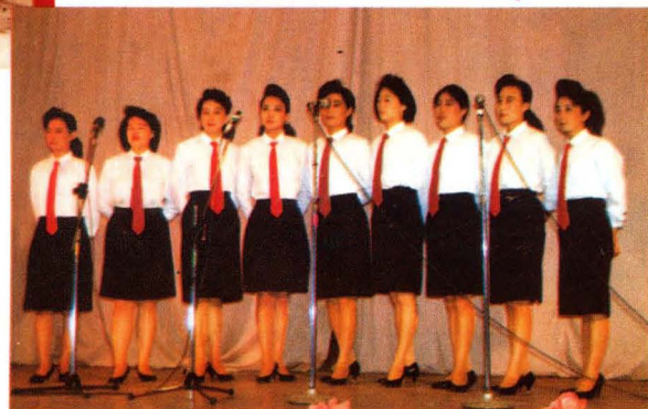
在卫生局系统文艺演出中