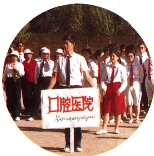
在卫生系统召开的体育运动会上