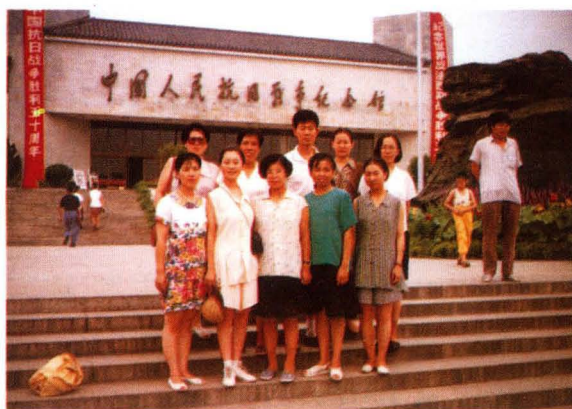
革命历史教育留影