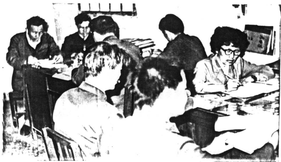
全体干部学习有关《党建工作文件》