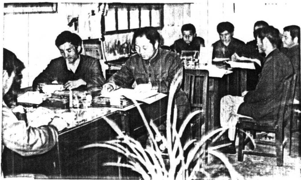
全体干部讨论审查《组织志》初稿