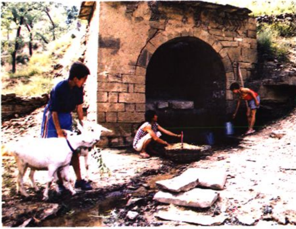
左图：西贺家石人赖以生存的井泉（2002年摄）