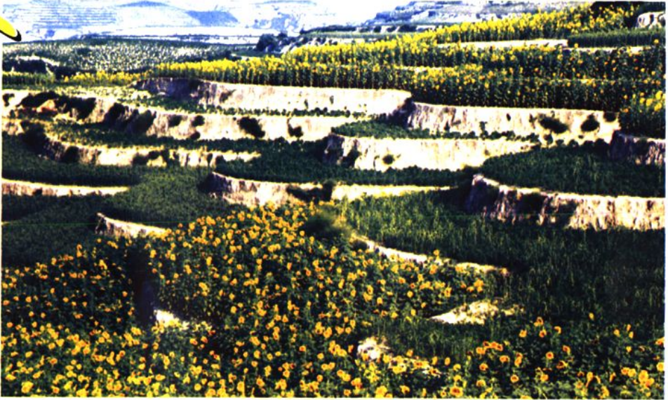
▲ 风调雨顺 丰收在望