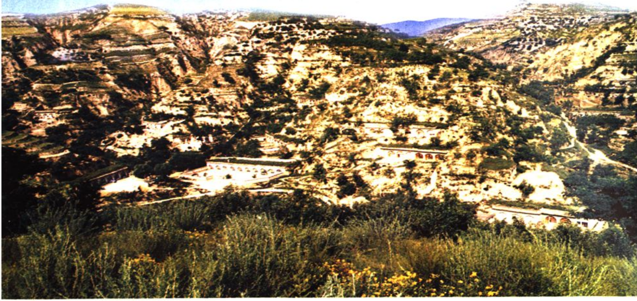
上图：西贺家石村貌一览（2002年于猫卧咀摄）