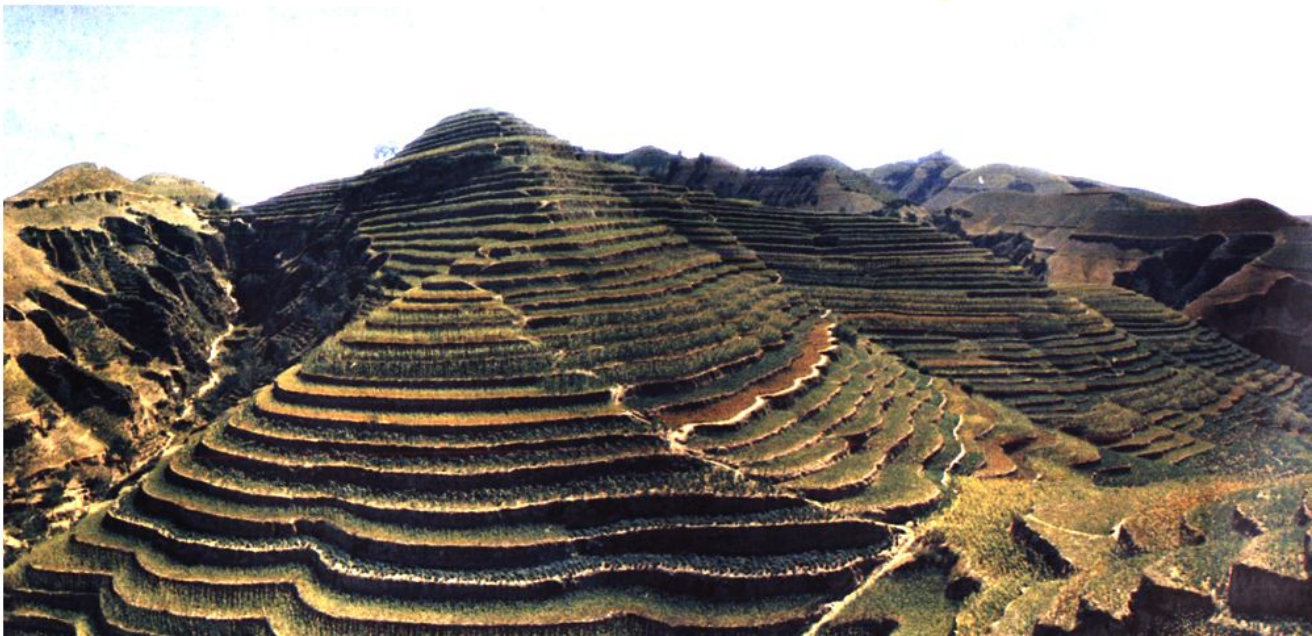
▼ 远眺文家山 梯田如画