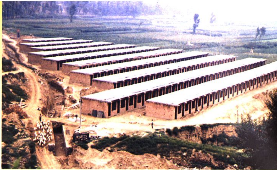
▲ 西贺家石新村住宅区 初具规模