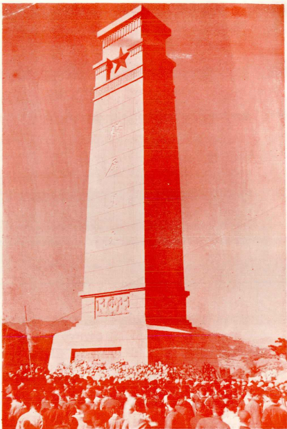
金寨县革命烈士紀念塔（側面）