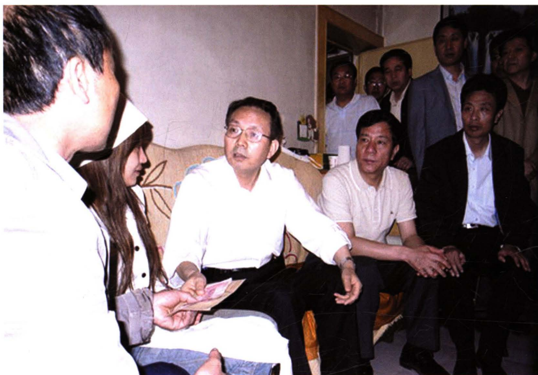
2008年5月13日，省委常委、纪委书记郭永平（左三）在市委书记唐俊昌（左四），市长戴征社（左五）陪同下到陈仓区视察地震灾情，看望慰问受灾群众。