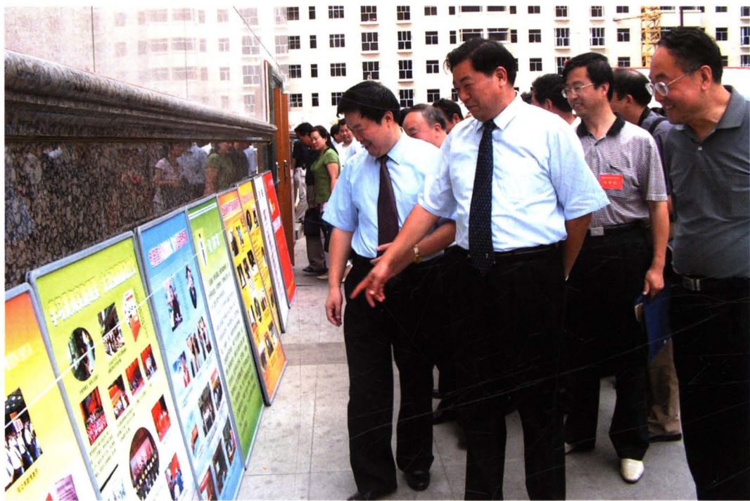
2005年7月21日，省委副书记、纪委书记董雷（左二）与市委书记姚引良（左一），市委副书记、纪委书记黄龙（左四），市纪委副书记、监察局长倪宝生（左三）一同观看宝鸡市反腐成果展。