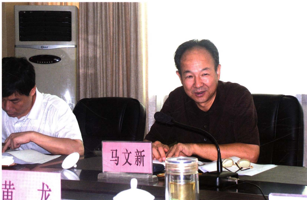
2006年7月26~27日，省纪委副书记马文新来宝鸡，就大力推进农村基层党风建设和加强纪律监督，确保换届工作进行顺利调研。