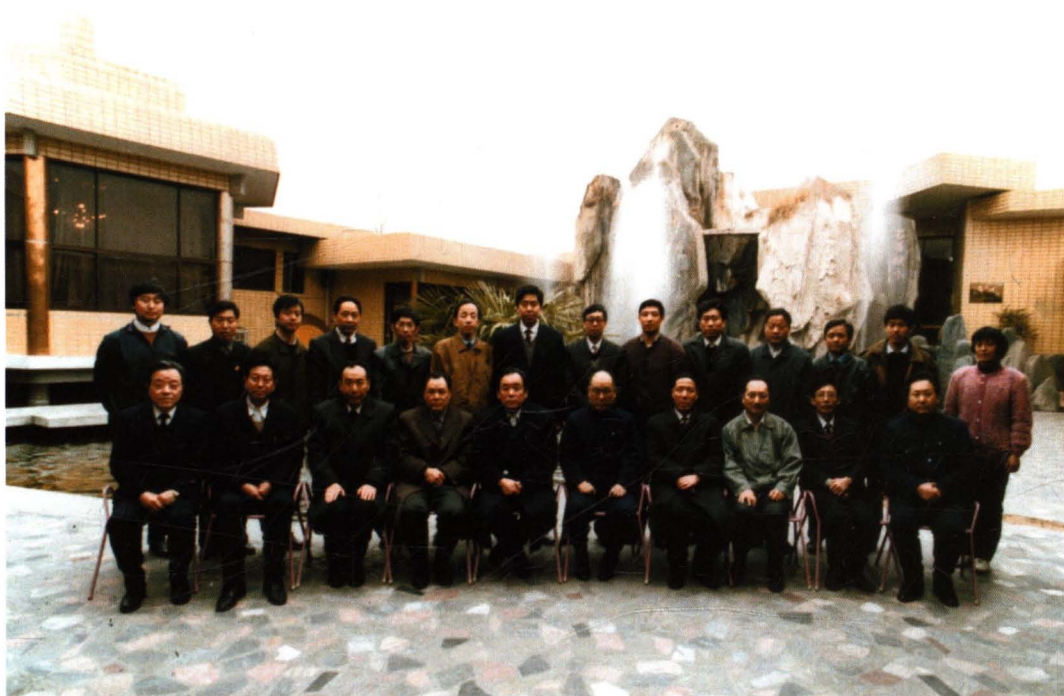
1993年2月6日，中央纪委书记侯宗宾（前排左六），省委常委、纪委书记李焕政（左五）来宝鸡视察工作时与市委、纪委领导合影。