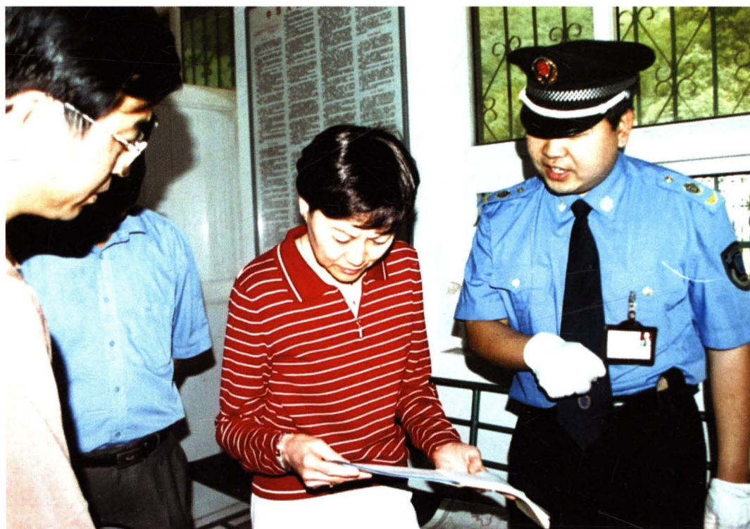
2004年6月，国务院纠风办监察专员白岩凌（中）来宝鸡调研纠风工作。