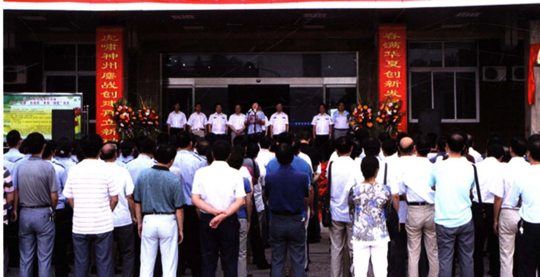
2010年8月11日，市纪委在宝鸡监狱举行宝鸡市反腐倡廉警示教育基地揭牌仪式暨市级部门岗位廉政教育活动。市委常委、常务副市长上官吉庆，省监狱管理局党委委员、纪委书记王敏为基地揭牌，市委常委、纪委书记田筱虎主持揭牌仪式并讲话。