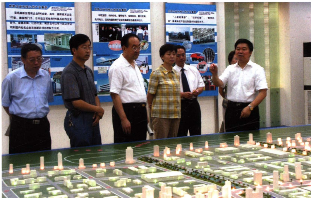
2006年7月11日，省委常委、纪委书记王侠（左四）来宝调研纪检监察工作，市委书记姚引良（右一），市委副书记、纪委书记黄龙（左三），市纪委副书记、监察局长倪宝生（左二）陪同。