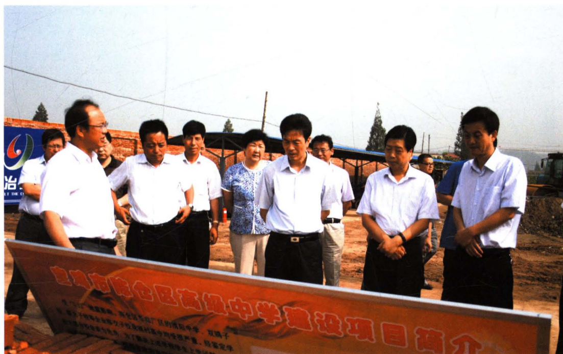
图为2010年8月2日市委副书记、市长戴征社（中）带队在陈仓区检查党风廉政建设责任制和反腐倡廉制度创新工作。