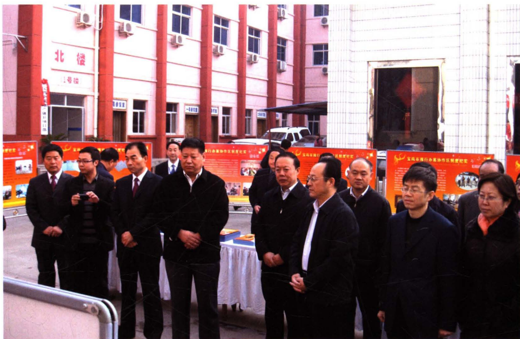
2011年10月28日，全省纪检监察机关乡镇纪委办案协作区制度现场推进会在陇县召开。图为省纪委副书记张毅民（左四），市委常委、纪委书记田筱虎（右三）同与会人员一同观看制度创新成果展览。