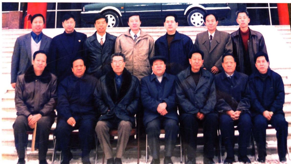
2000年1月，首届纪检监察学会常务理事与省、市纪委领导合影。