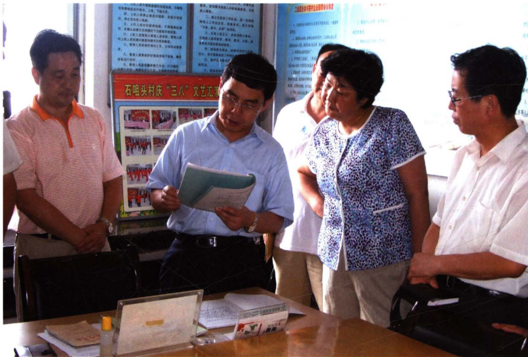
图为2010年7月30日市委常委、常务副市长上官吉庆在渭滨区检查党风廉政建设责任制和反腐倡廉制度创新工作。