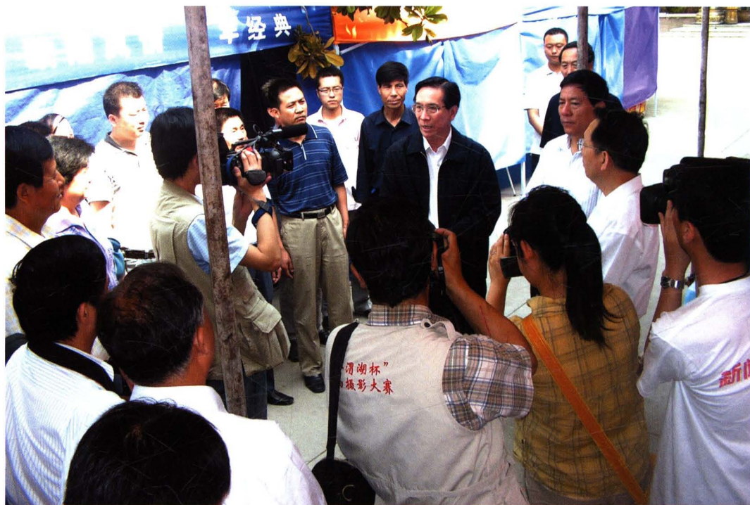
2008年6月5日，中央纪委书记李玉赋（中）在省纪委领导陪同下赴陈仓区检查指导抗震救灾工作。