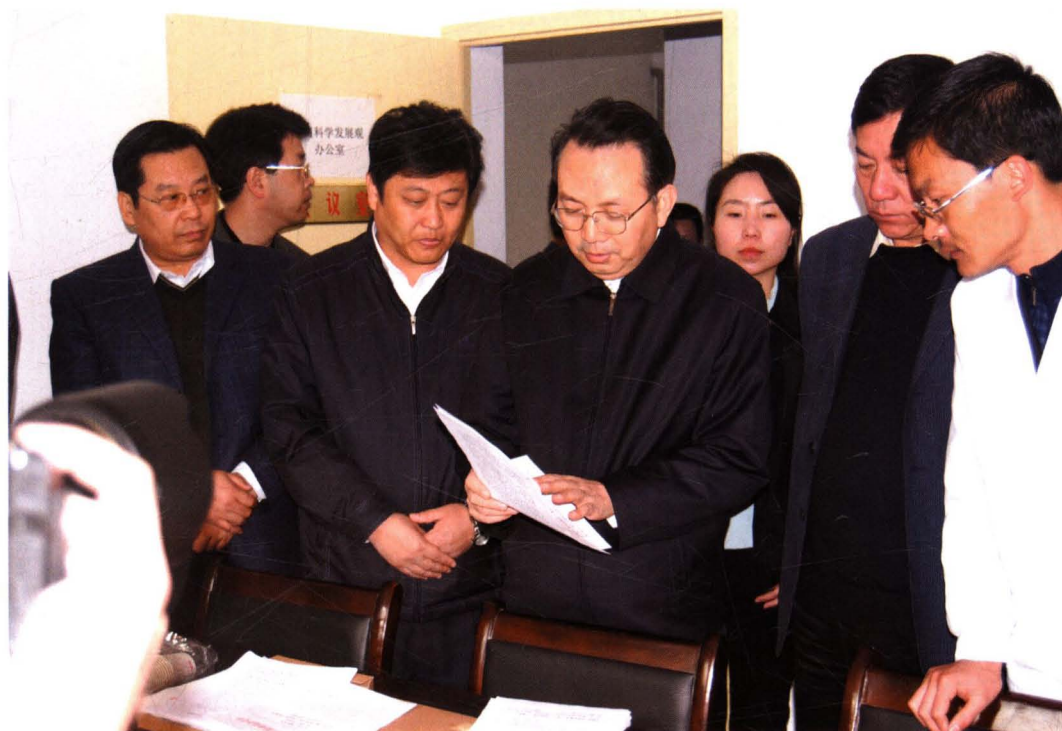
2009年12月，省委常委、省纪委书记郭永平（左四）在市委书记唐俊昌（右二）陪同下到太白县检查指导开展科学发展观教育活动。