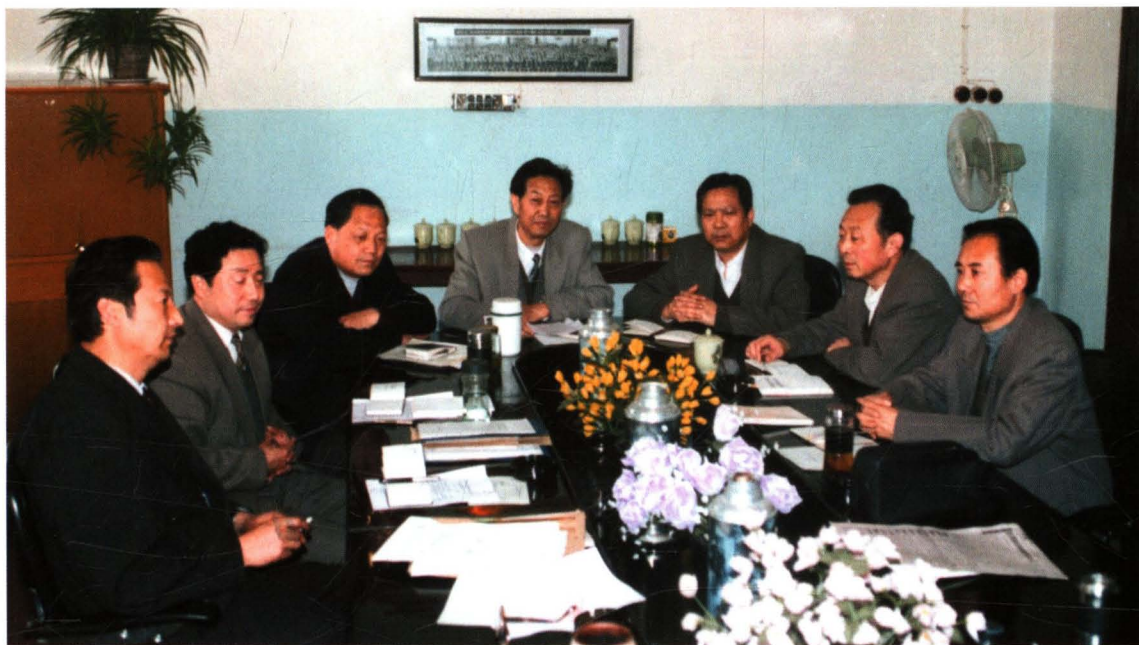
1997年3月18日，中共宝鸡市第七届纪委常委在一起研究工作。