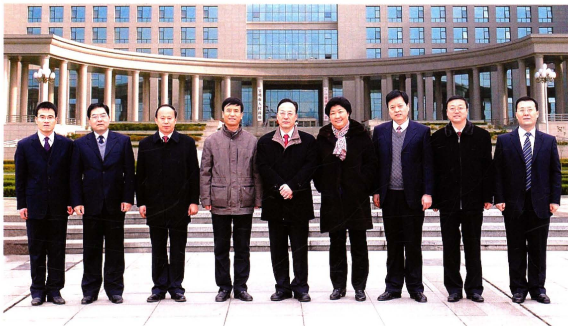
2011年12月，中共宝鸡市第十一届纪委常委合影。