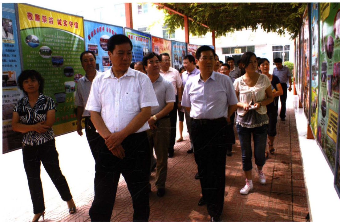
2010年，市委决定由市委常委带队，对全市党风廉政建设责任制、反腐倡廉制度创新、贯彻《廉政准则》情况进行检查。图为7月28日市委书记唐俊昌（前）带队在凤翔县检查党风廉政建设责任制和反腐倡廉制度创新工作。