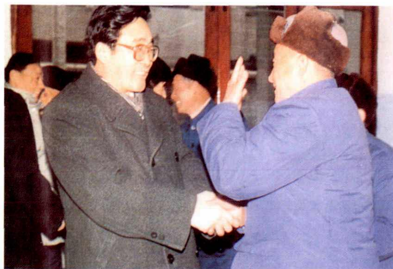
民政部范宝俊副部长看望萧山市光荣院烈属