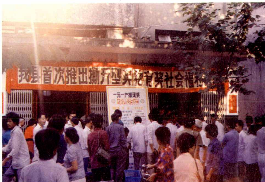
社会福利有奖募捐售券现场