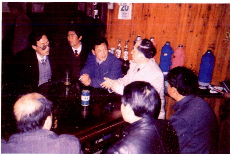
民政部陈虹副部长考察富阳农村社会养老保险