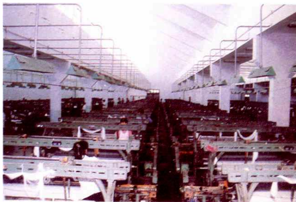
蓬勃发展的社会福利企业