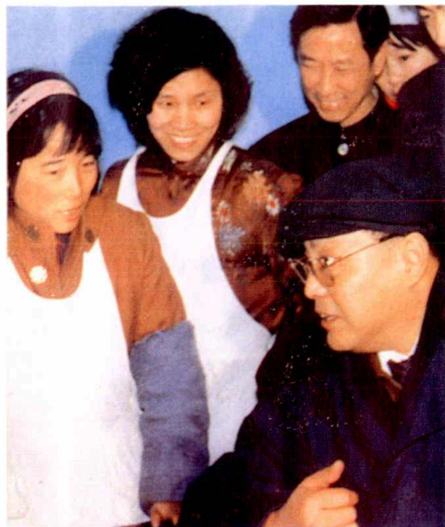
中残联主席邓朴方指导杭州市艮山街道工疗站工作