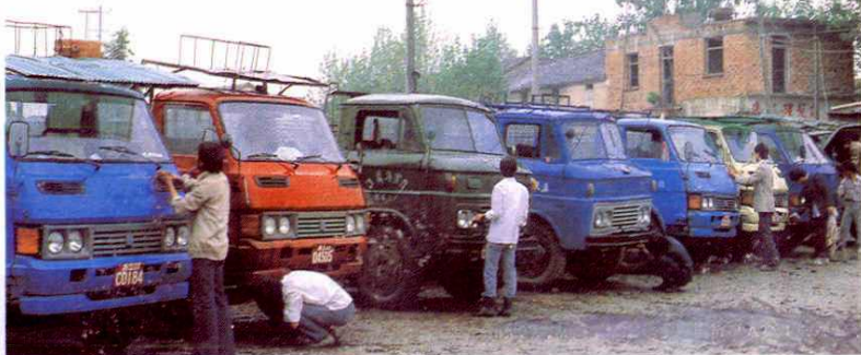
以退伍军人为骨干的运输站