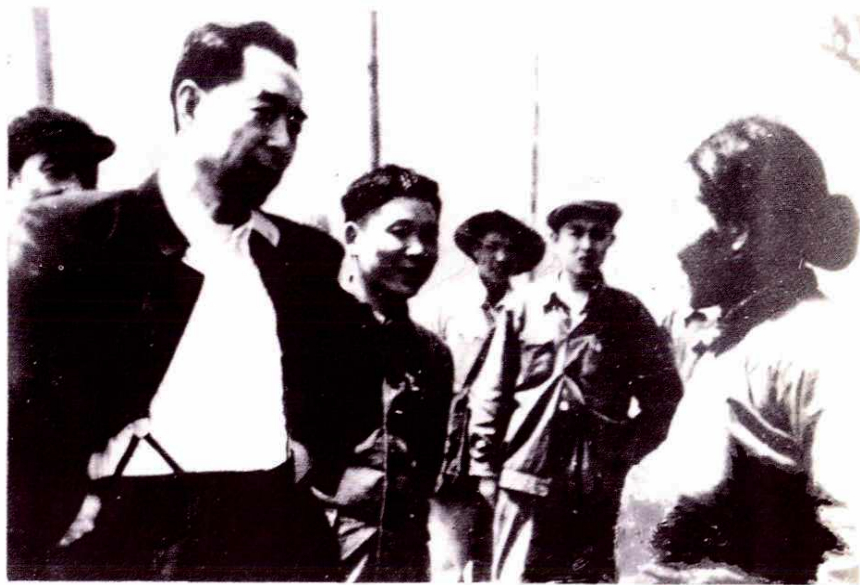
江泽民总书记、田纪云 副委员长察看嘉善县灾情