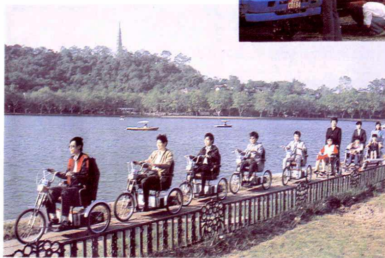
浙江省假肢工厂推出新型轮椅车