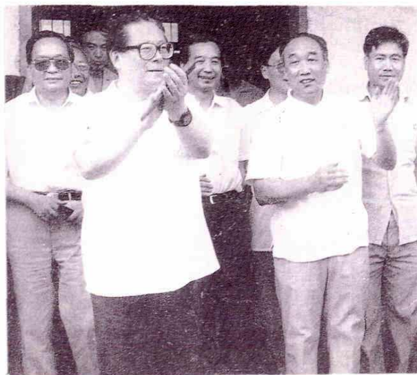
李鹏总理察看嘉兴市郊 灾情（右下图）