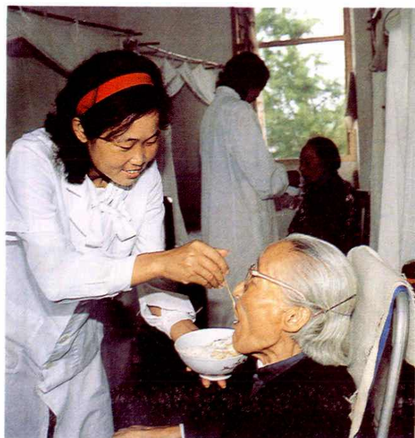
福利院老人受到悉心照料