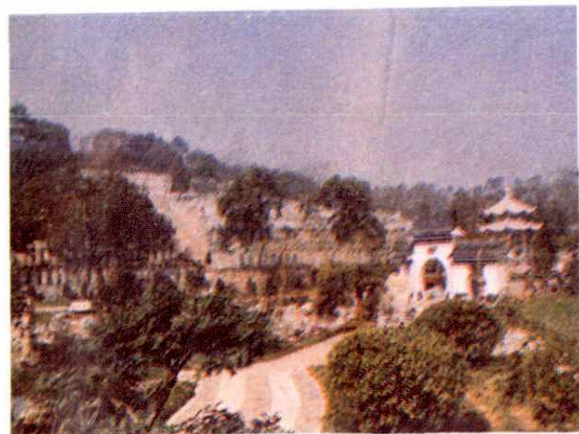
园林式的南山公墓远景