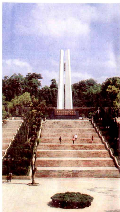
浙江革命烈士纪念碑