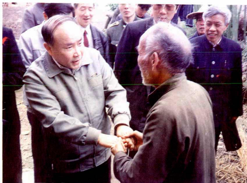
省委书记李泽民慰问革命老区 老复员军人