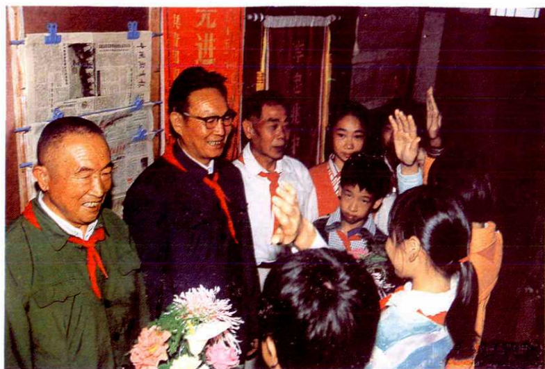
军队离退休干部关心下一代