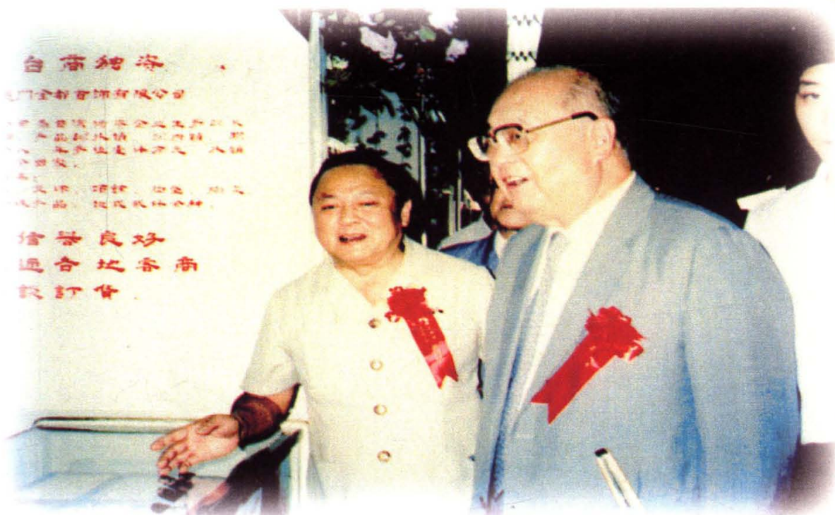
1996年廈門總商會(工商聯)組織會員參加桂林展銷會，圖為全國人大副主任王光英參觀廈門展區。