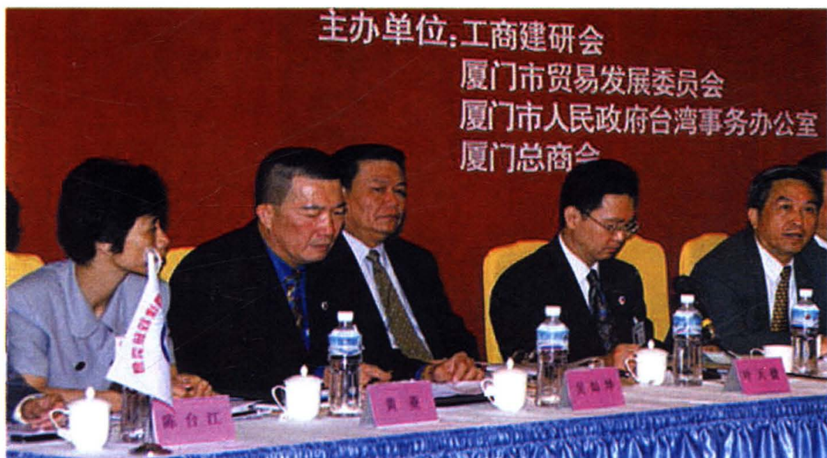
1998年5月28日，厦门总商会（工商联）与市台办、市贸发委、台湾工商建研会联合举办促进两岸经贸交流与合作座谈会。