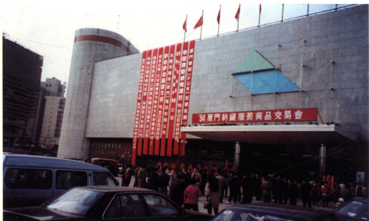
改革开放后成立的第一个行业组织——厦门市纺织服装同业商会于1993—1995年连续举办厦门纺织服装商品交易会。