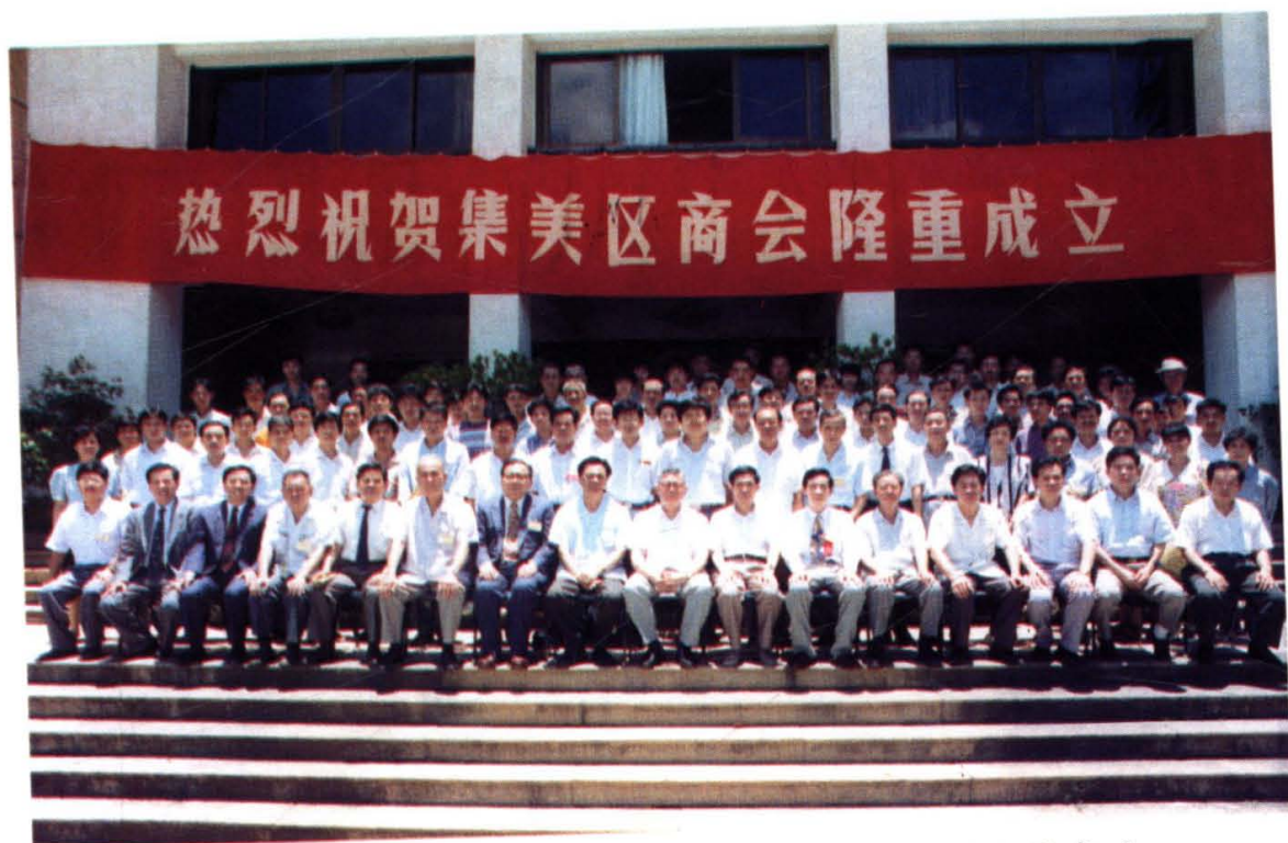
厦门第一个区商会——集美区商会于1994年6月成立。