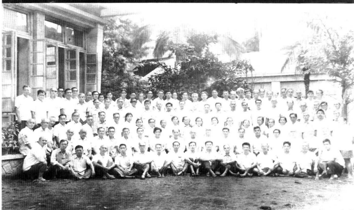
工商聯恢復活動後市工商聯第五屆會員代表大會、民建第三次代表大會全體代表合影。