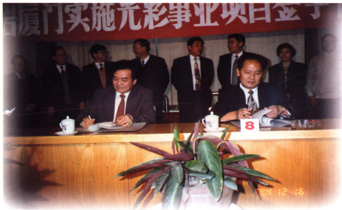
1994年12月，厦门总商会“光彩事业”考察团首次赴龙岩地区考察，图为项目签字仪式。