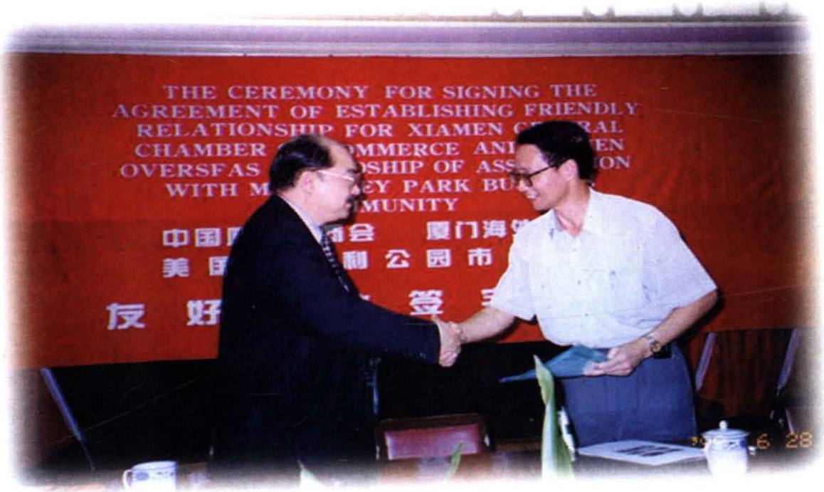
1999年6月厦门总商会与美国蒙特利公园市商会缔结友好商会，图为双方签字仪式。