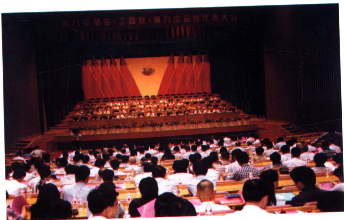
1997年5月，厦门总商会（工商联）第九次会员代表大会在厦门人民会堂隆重召开。