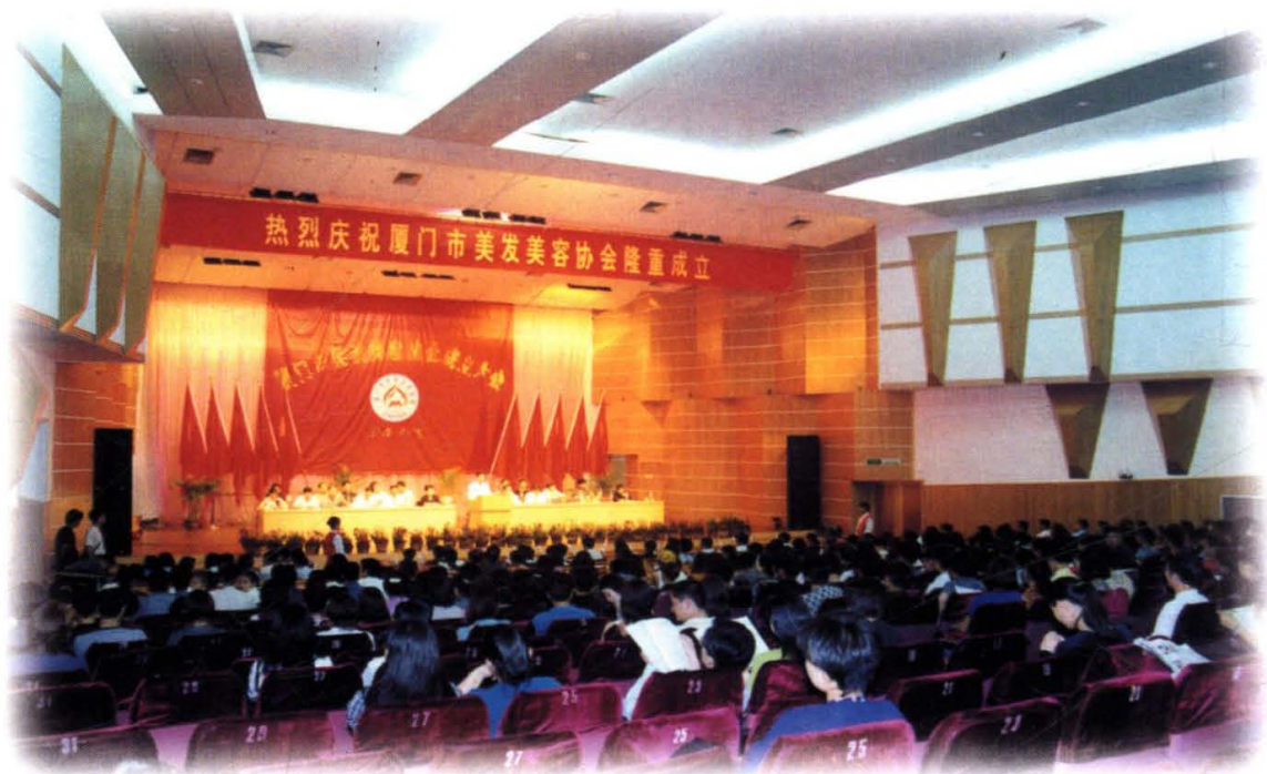
1999年4月厦门市美发美容协会成立。