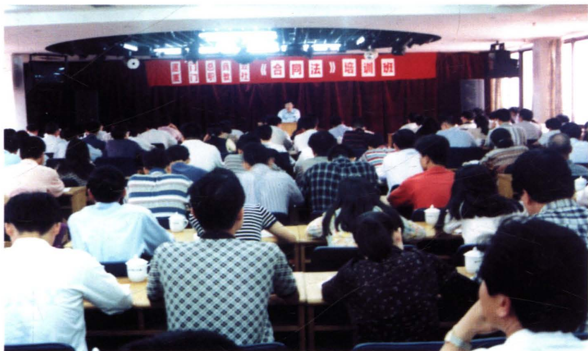
1999年5月,厦门总商会(工商联)与中华职教社举办新《合同法》培训。