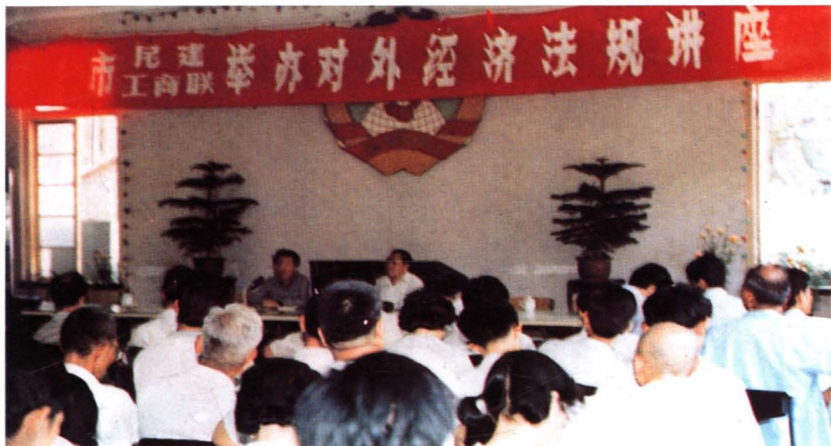
1986年,厦门市工商联与民建厦门市委会举办的经济法规讲座在特区初创阶段起到积极的作用。