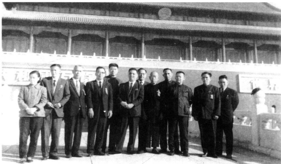
1963年10月，厦门工商联代表参加国庆观礼，图为参加观礼的代表和有关人员在天安门前合影留念。