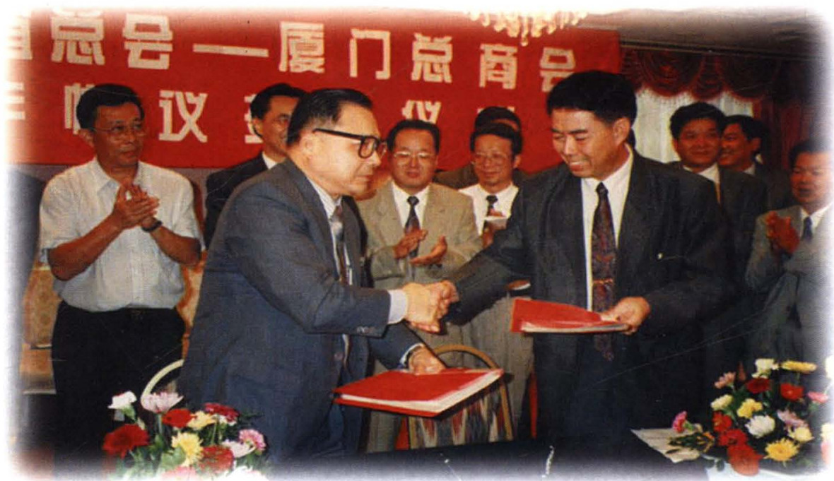
1994年9月，香港厦门联谊总会与厦门总商会友好合作协议签字仪式。