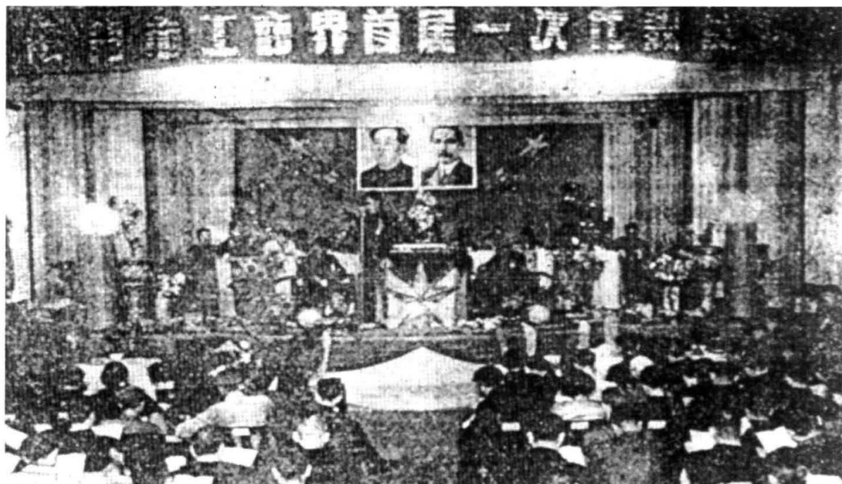
1953年1月廈門工商聯成立，圖為“一大”會場。