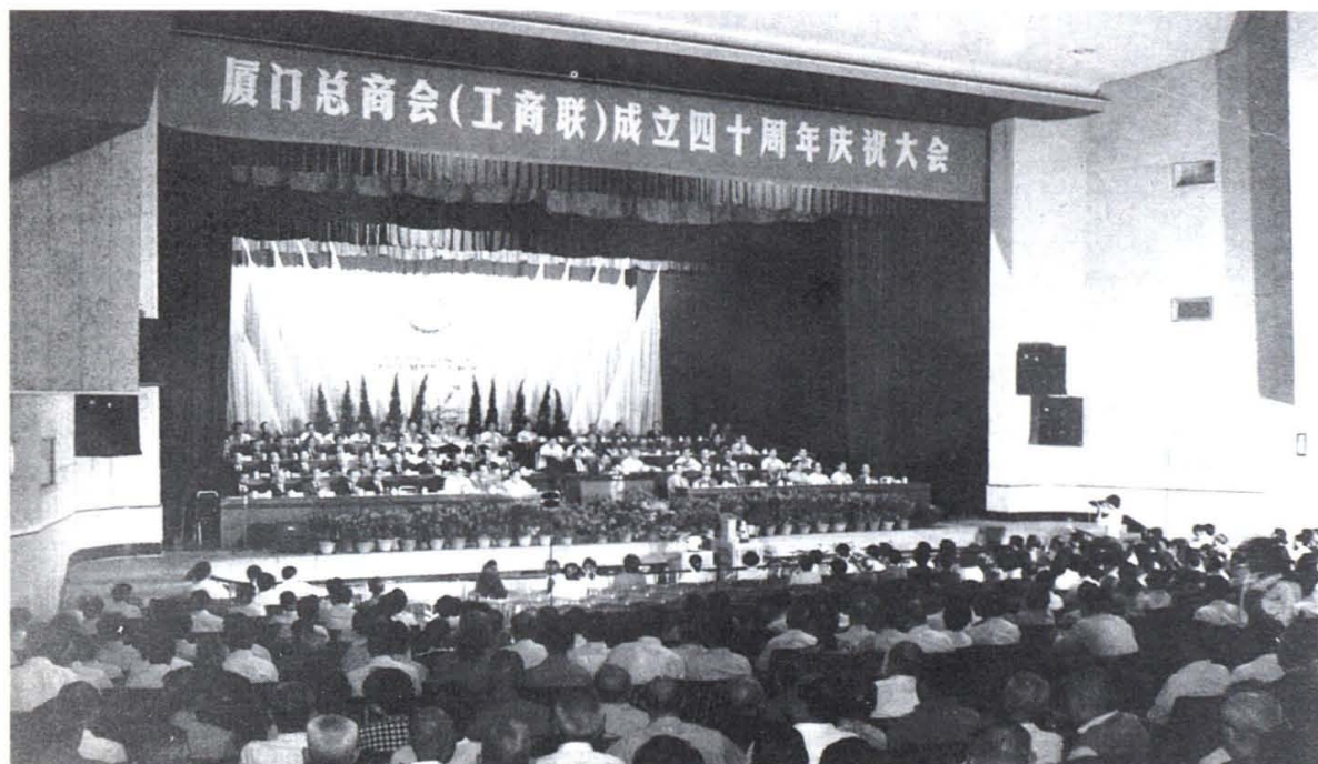
1990年厦门总商会（工商联）在影剧院举行40周年大庆。