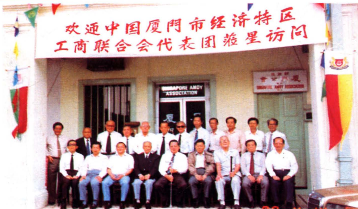
1988年4月，廈門市工商聯代表團赴新加坡考察訪問。