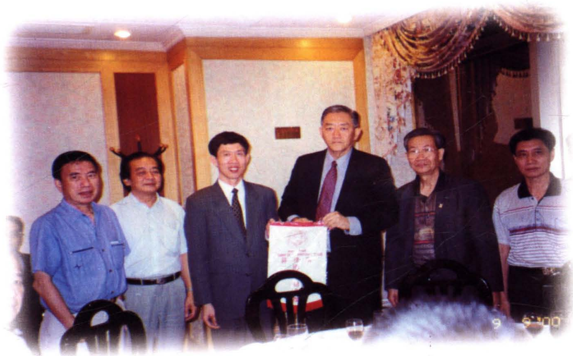
2000年，“9·8”期间接待菲律宾国际商会客人。