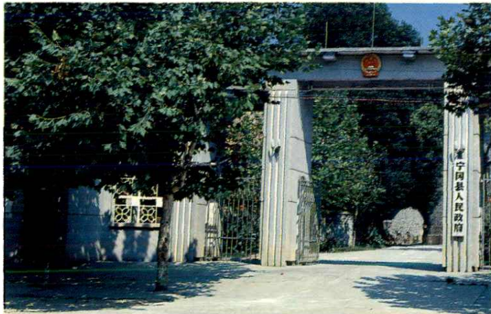
宁冈县人民政府门景