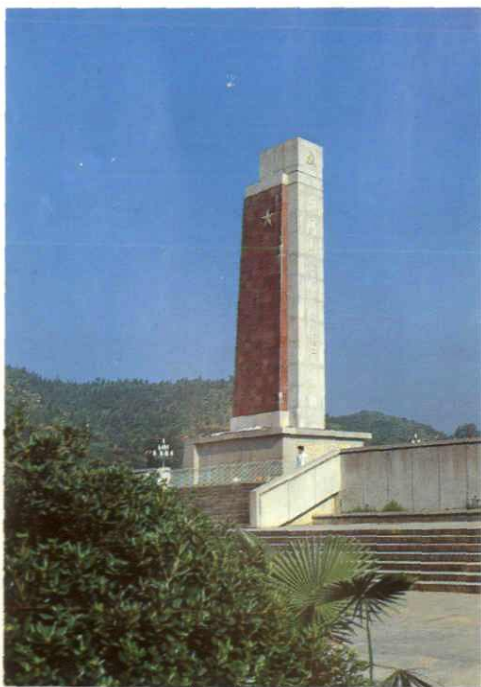
井冈山会师纪念碑