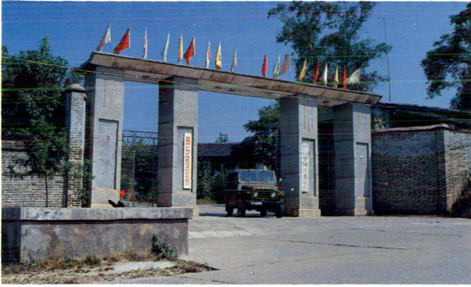
中共宁冈县委员会门景