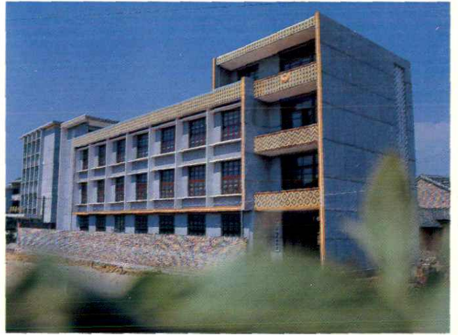
政协宁冈县委员会大楼