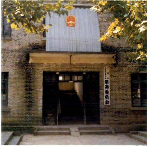
宁冈县人大常委会 门景